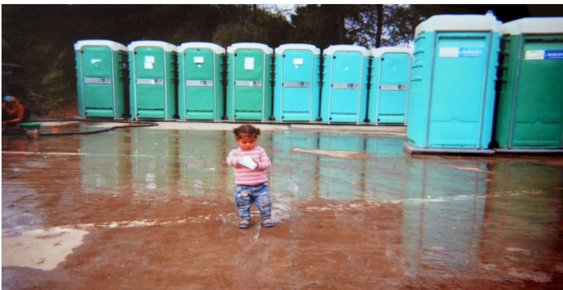
Figura 7. “ You don’t have to be great to start, but you have to start to be great ”

Finalmente, como se puede ver en la Figura 7, encontramos también evidencias de empoderamiento en textos que incitan a la superación (“ You don’t have to be great to start, but you have to start to be great ”, D.) y a la unión de los residentes para ganar poder, apareciendo así un nosotros capaz de salir de las circunstancias en las que se encuentran y construir un futuro mejor: “ We are building hope ” (I.); “ Together we can make life better ” (S.); “ We want to live in peace without war ” (A.).