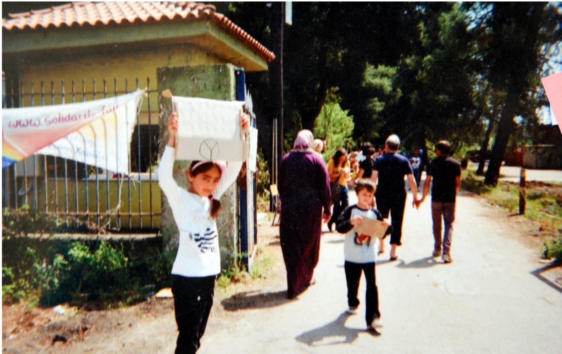
Figura 5. “Kids want to open the border and keep going”

La denuncia/defensa de los más vulnerables se completa con imágenes de ancianos (uno portando leña y otro caminando solitario entre la arboleda) y de un joven discapacitado en la manifestación, cuyos pies de foto indican: “They are old but they didn’t lost hope” (I.); “Pain and suffering of disable people are because they can’t live in this terrible life” (M.).