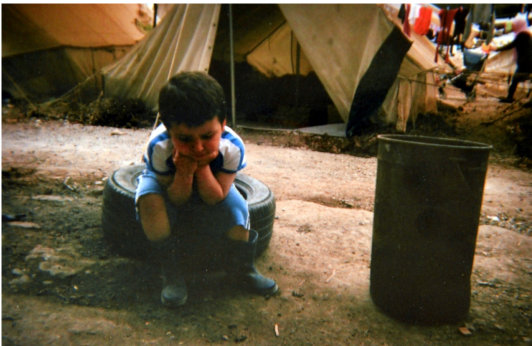
Figura 2. "Silence is the powerful scream"

Este bloque presenta un carácter muy emocional, mostrando imágenes tristes con pies de foto que incluyen palabras como muerte, pena, miedo o sufrimiento (ver ejemplo en la Figura 2). Algunos textos se refieren a la constatación de la dura situación en que se encuentran y a emociones compartidas: "A complicated life :-( (S., D.); "I see people who is sad and I want them in my pictures" (D.); "Silence is the powerful scream" (S.) y "Pain and suffering" (Mh.).