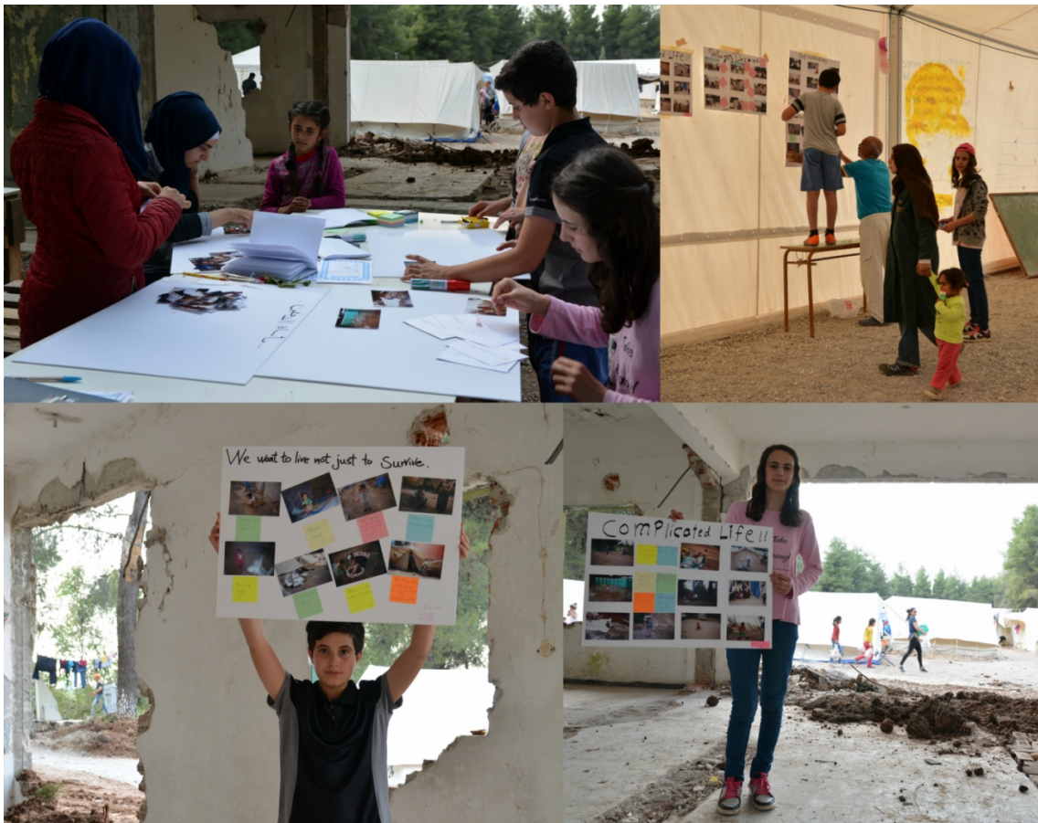
Figura 1. Proceso del taller de photovoice

Tras revelar los carretes, hubo una sesión grupal donde se entregó a cada participante sus fotos, un cuaderno y un bolígrafo. Se comentaron las fotos grupalmente y se les pidió que escribieran, en su idioma, las sensaciones que les generaban las imágenes. Después, se les pidió que seleccionaran las 10 fotografías más representativas y les pusieran pies de foto. Finalmente, se crearon paneles tamaño A2 con estos materiales. Algunos/as participantes decidieron exponerlos para toda la comunidad, donde muchos/as residentes comentaron con los/as chicos/as sus trabajos, construyendo nuevas narraciones en torno a las fotografías. En la Figura 1 se presentan algunas fotos del proceso del taller.