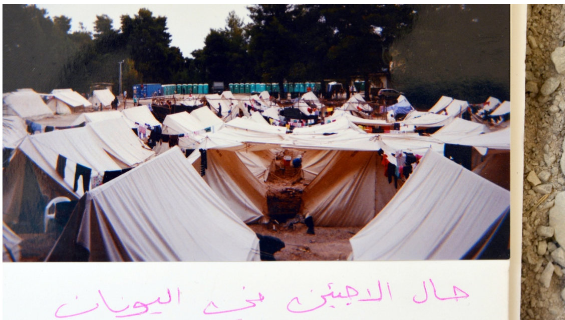
Figura 3. “ Situation of refugees in Greece ”

En este bloque, los textos manifiestan la existencia de otro (que interpretamos como la UE) que impide la felicidad de los que escriben. Los jóvenes, reclaman ayuda (“ We are asking for help ”, A.) o se dirigen a un tú opresor desde un nosotros (“ What we need is small and you make it huge ”; “ Doesn’t our suffering give you a heartache ”, M.), exigiendo la apertura de las fronteras (“ Open the borders ”; “ We have a goal: to open the borders to continue our lives ”, M.) o haciéndose portavoces de los derechos de los/as niños/as del Campo (“ The children want you to open the border to get their rights ”, A.). Otras veces, denuncian situaciones simplemente mostrando la realidad, pues las imágenes hablan por sí solas, como la Figura 3: “ Situation of refugees in Greece ” (A.).