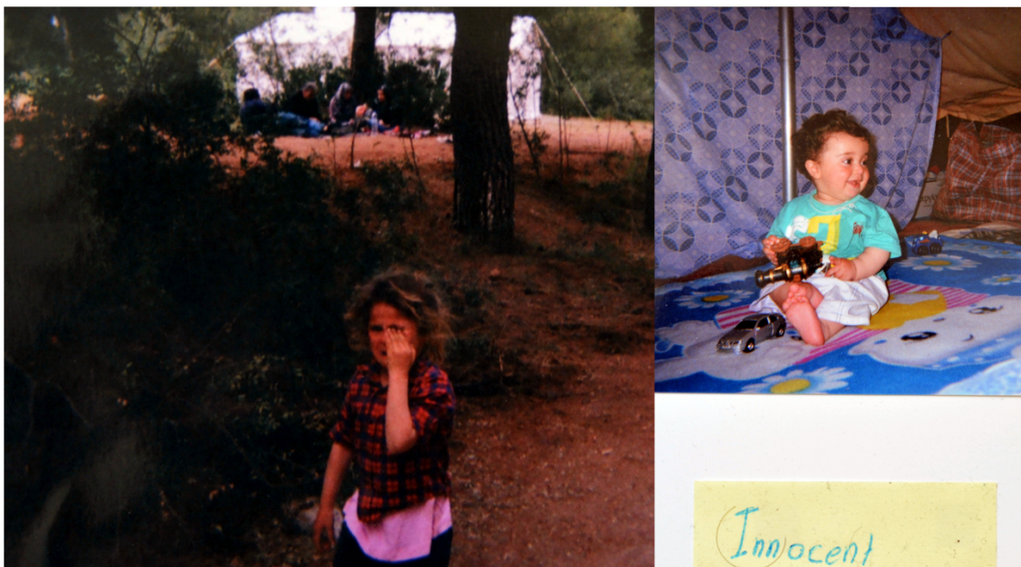
Figura 4. “Sadness of the children in this life” (left) / “Innocent dream” (right)

Tanto las imágenes como los textos hacen mucha referencia a colectivos especialmente vulnerables, donde los/as menores son el tema más recurrente. En 17 fotografías aparece un/a menor solo/a como figura central. Como muestran la Figura 4, suelen estar parados/as mirando a la cámara en el desolado paisaje del Campo, otros/as aparecen jugando con elementos del entorno (cajas, neumáticos, contenedores, etc.) y otros/as están llorando. Cuando los/as menores aparecen en grupo (17 ocasiones) lo hacen en la escuela, jugando o posando con compañeros/as, o bien acompañando a adultos—familiares o voluntarios/as—a los que ayudan en sus tareas. También se tomaron ocho fotografías de menores en la manifestación, que mostraban una actitud muy activa, portando pancartas o gritando.