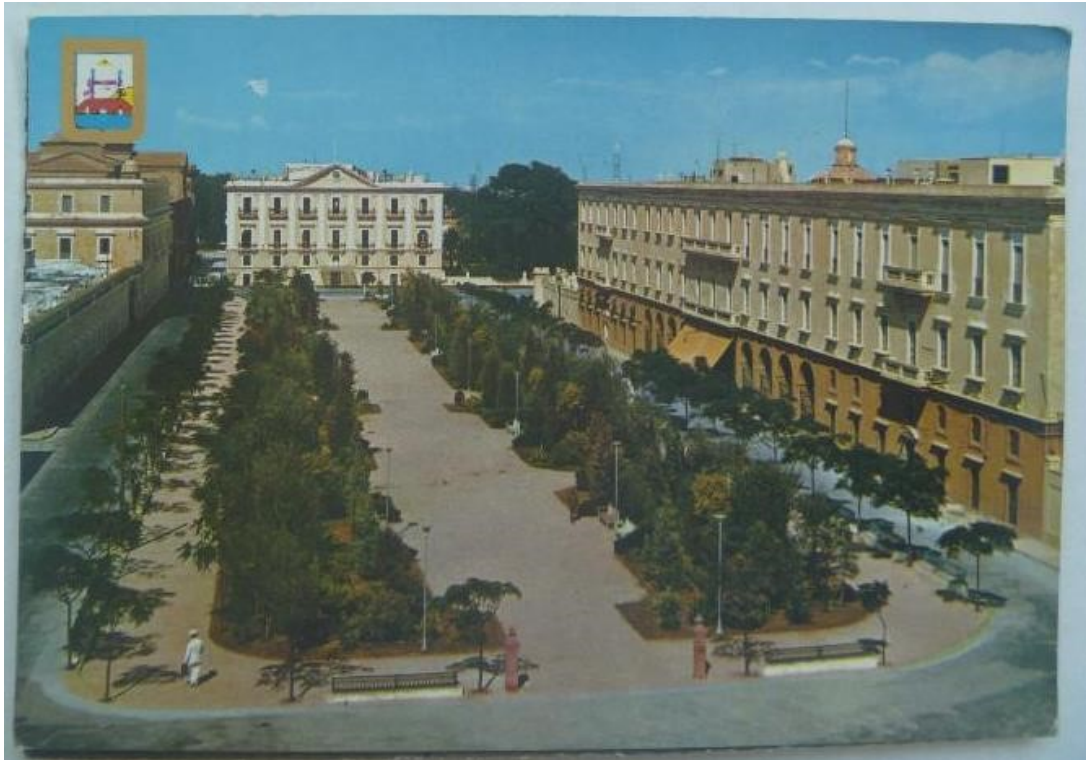
Figura 16. Antigua postal Población de San Carlos. El Capitán. 2005. https://www.todocoleccion.net/postales-andalucia/postal-san-fernando-cadiz-poblacion-militar-san-carlos-anos-60~x150602774