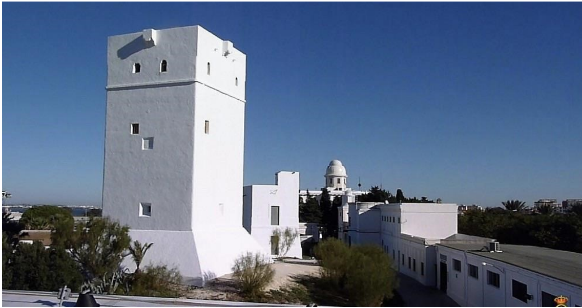
Figura 9. Torre Alta. La mira. 2018. https://elmira.es/02/10/2018/comienza-la-fase-definitiva-de-restauracion-de-torre-alta-en-san-fernando/