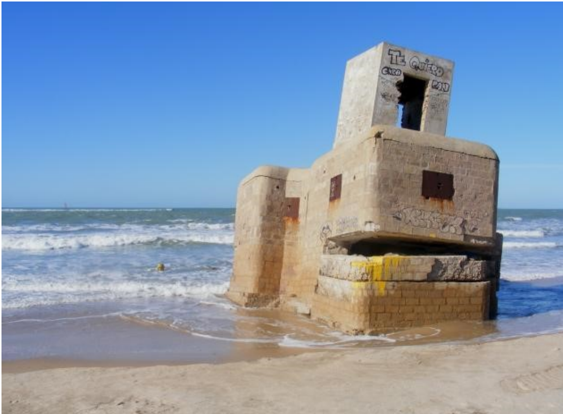
Figura 3. Ruina de Bunker frente al mar. Ignacio Hernández. 2014. https://www.verpueblos.com/andalucia/cadiz/san+fernando/foto/1257998/