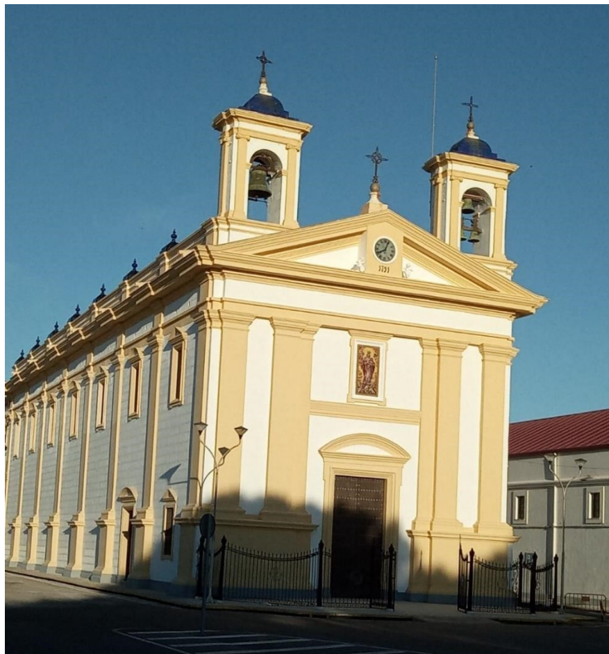
Figura 12. Capilla Arsenal de la Carraca. 2018.