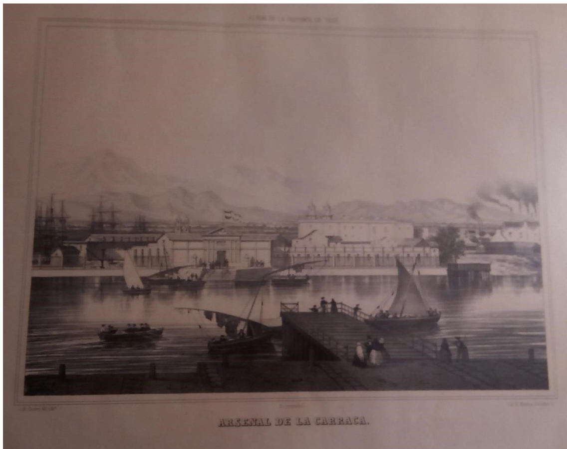
Figura 10. Grabado Arsenal de la Carraca. Colección privada. 2018