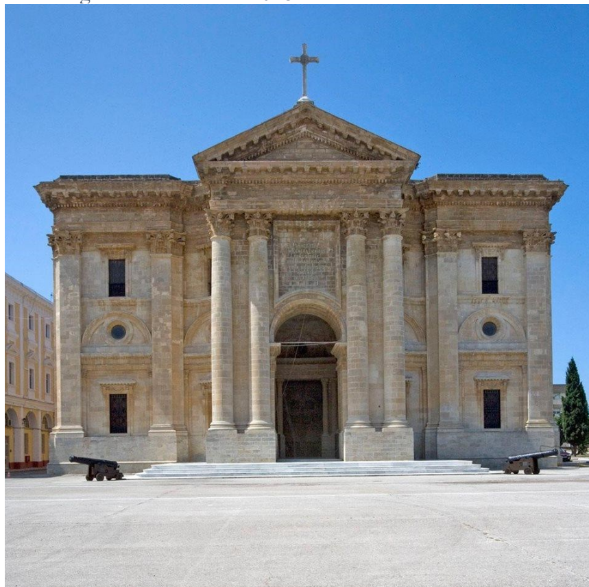
Figura 14. Panteón de Marineros Ilustres.