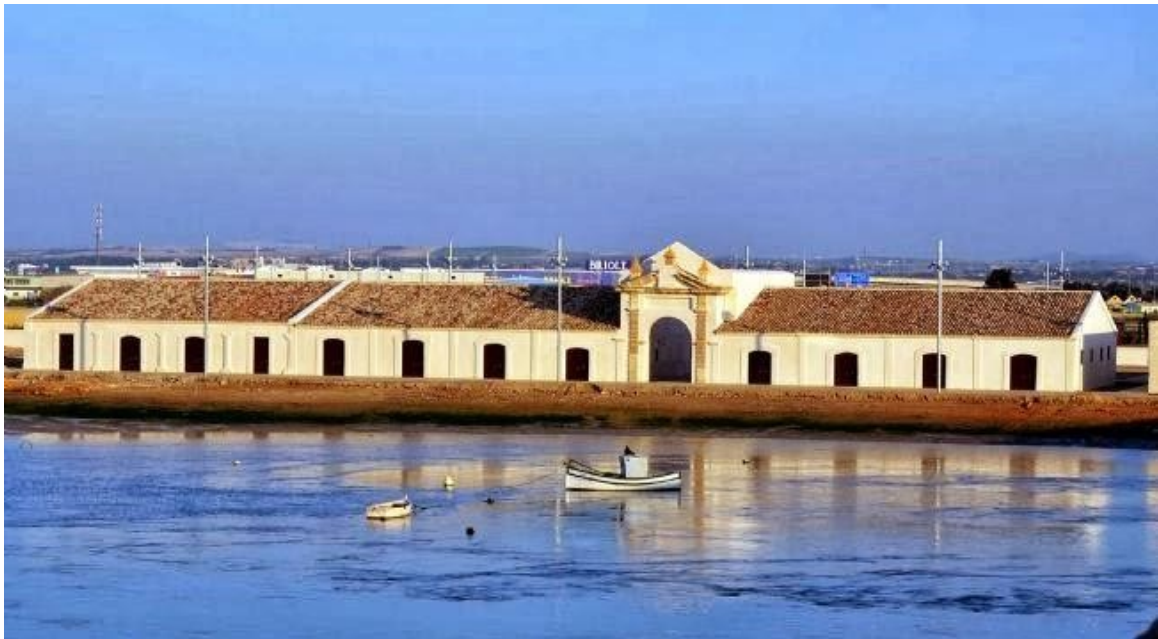
Figura 8. Real Carenero.