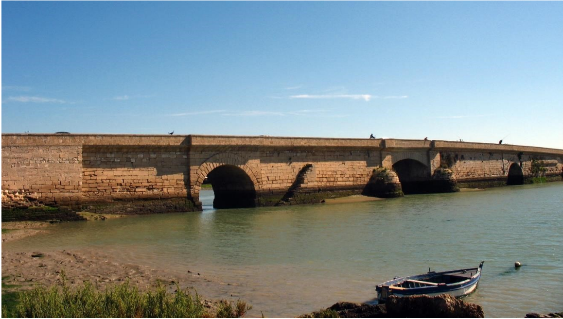
Figura 7. Puente Zuazo.