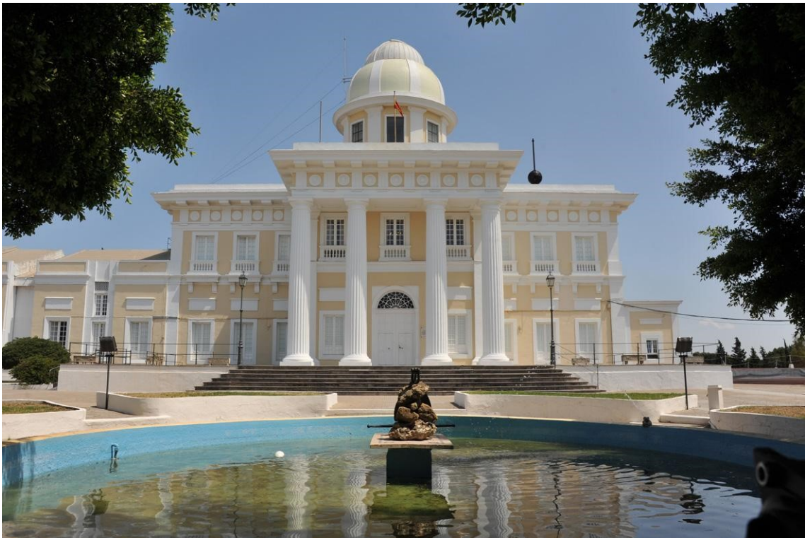
Figura 17. Real Observatorio de la Armada. Andalucía Información. 2016. https://andaluciainformacion.es/san-fernando/785264/el-observatorio-de-marina-abre-las-puertas-por-la-semana-de-la-ciencia/