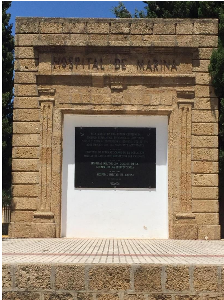
Figura 13. Puerta Antiguo Hospital San Carlos. 2018.