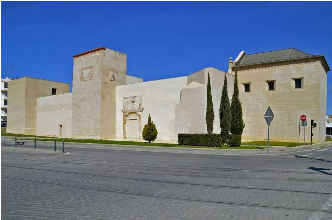
Figura 5. Castillo de San Romualdo. El castillo de San Fernando. 2018. https://www.elcastillodesanfernando.es/2018/02/el-ayuntamiento-incluye-mejoras-en-