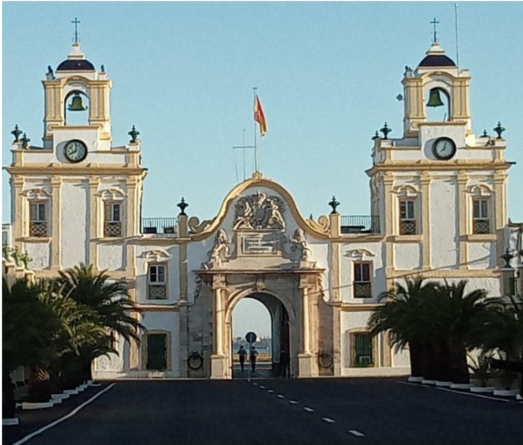
Figura 11. Puerta del Mar. 2018.