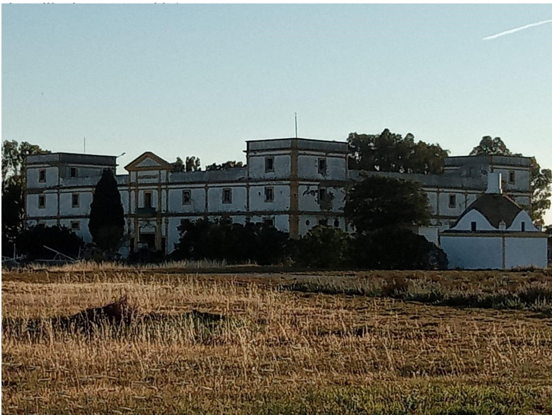
Figura 6. Penal de las Cuatro Torres. 2018.