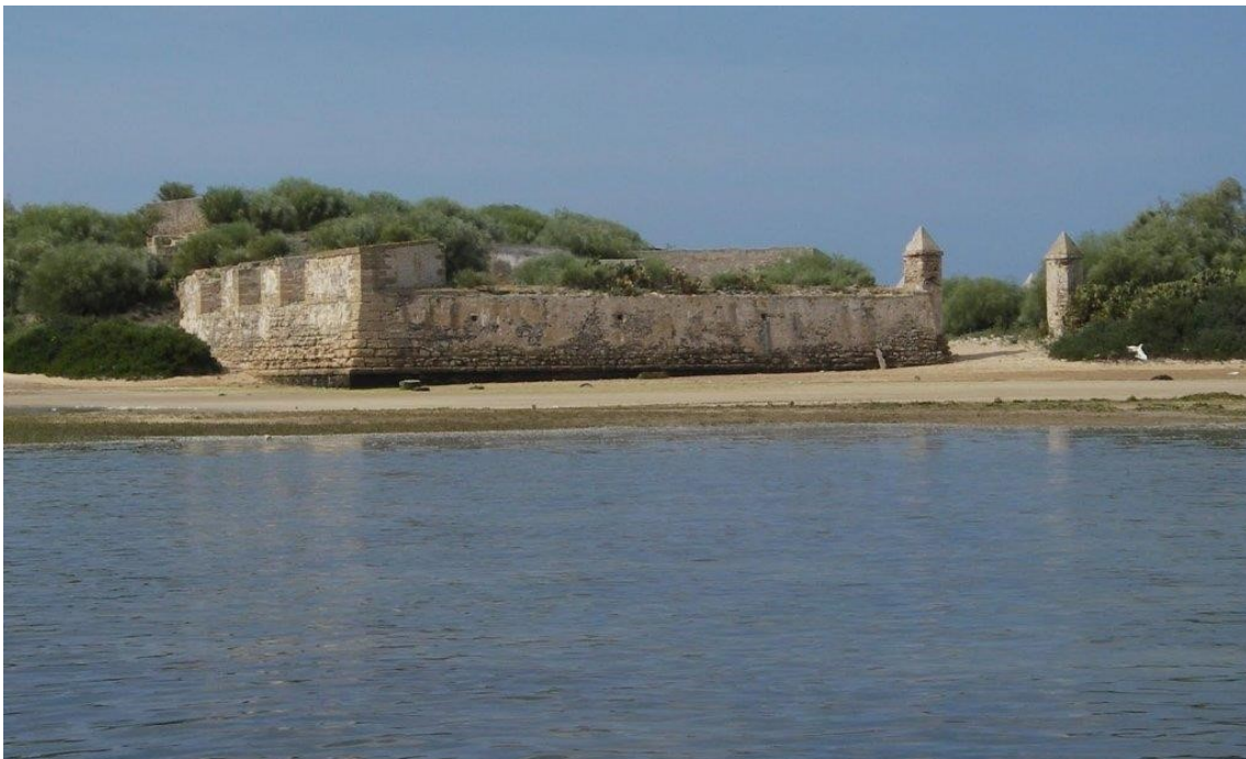
Figura 1. Bateria de Urrutia. dmsanctipetri.blogspot.com/2000/04/6-ruta-de-la-batalla-de-chiclana-5-de.html .