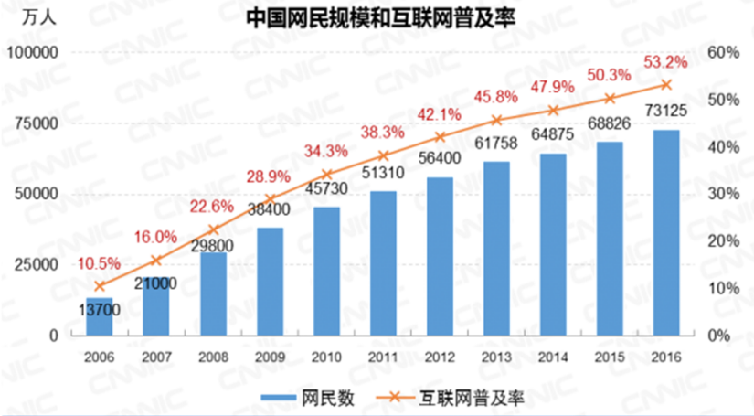
Columnas azules: Cantidad de Cibernauta Chino (Diez Mil) Números rojos: Porcentaje de Acceso a Internet (% Población China)

Primero, claro es que en los últimos 10 años, en China hay un crecimiento tremendo de cibernauta. Se puede ver más claro en el "Informe de las Estadísticas del Desarrollo de la Red de Internet de China" 158 , publicado por el Centro de Información de la Red de Internet de China (China Internet Network Information Center en inglés, CNNIC en abreviatura).