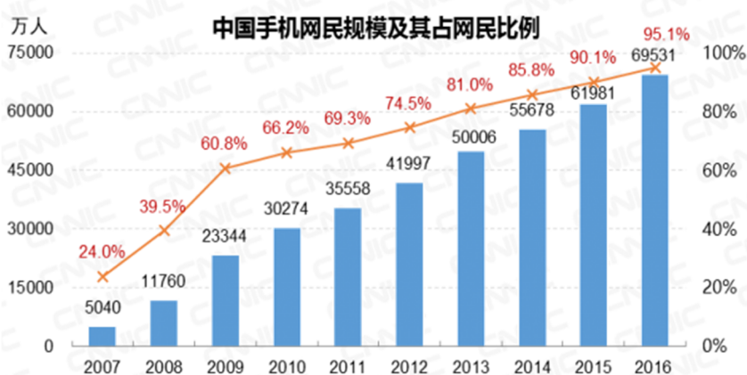
Cibernauta chino con móvil inteligente

Columnas Azules: Cantidad de Cibernauta con Móviles Inteligentes (Diez Mil) Números rojos: Porcentaje de Cibernauta con Móvil Inteligente (% Cibernauta Chino)