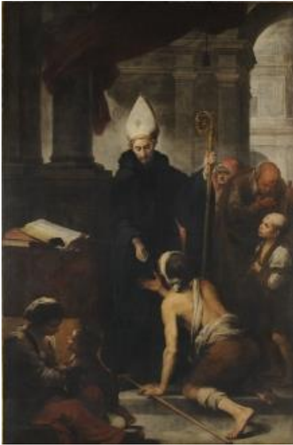
Figura 12. "Santo Tomás de Villanueva dando limosna" (Murillo, ca. 1682)

A la hora de crear narratividad debemos tener en cuenta ciertos recursos que se han ido utilizando a lo largo del tiempo.