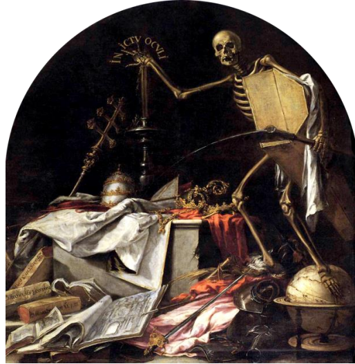
Figura 17. “In ictu oculi” (Valdés leal, ca. 1690)

creados por Valdés Leal, por encargo de Miguel de Mañara 3 , con la idea de representar la fugacidad de la vida. Estos formarán parte de los llamados “jeroglíficos de la caridad” elaborados por Murillo.