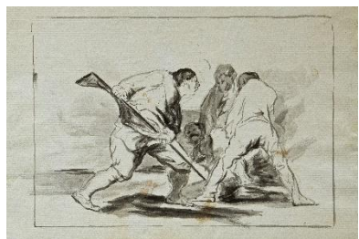
Figura 11. Boceto. ( Fortuny)

Para comenzar hablemos del boceto. Práctica utilizada desde los inicios de la pintura para elaborar las ideas previas a la realización de una obra definitiva. Pero trataremos el boceto de forma eficaz. La elaboración de estudios y bocetos fomenta la retentiva previa en la realización de una obra. No solo hablamos de la utilización de éstos como futuro ejemplar definitivo, si no como herramienta para cultivar nuestra mente y poder realizar obras sin referentes físicos. Como podemos apreciar en las figuras 9, 10 y 11 vemos la gran diferencia de estudios realizados.