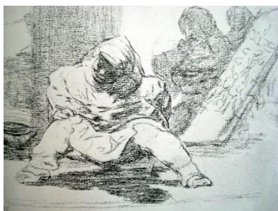
Figura 10. Boceto. ( Goya)