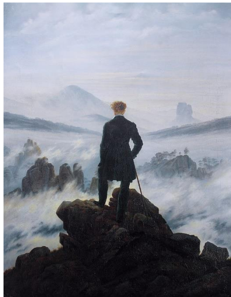
Figura 8. Romanticismo. "El caminante sobre el mar de nubes" (Friedrich, ca. 1818)