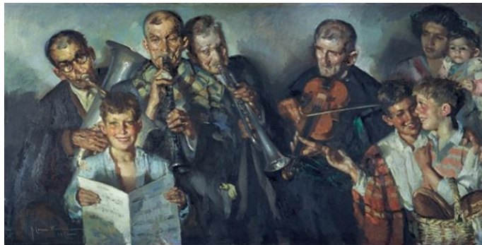
Figura 15. "Los músicos" (Cruz Herrera, ca. Siglo XX)

Otro paso para mejorar la narratividad de nuestras obras es el trabajo de la personalidad, no la nuestra, la de nuestros personajes. Saber y conocer las distintas expresiones a las que puede llegar un rostro son esenciales a la hora de trabajar la expresividad visual. No solo debemos tener en cuenta los elementos gestuales, también habrá que mostrarle gran importancia a saber diferenciar con nuestra pintura, las distintas etapas de la vida, como podemos apreciar en la siguiente figura.