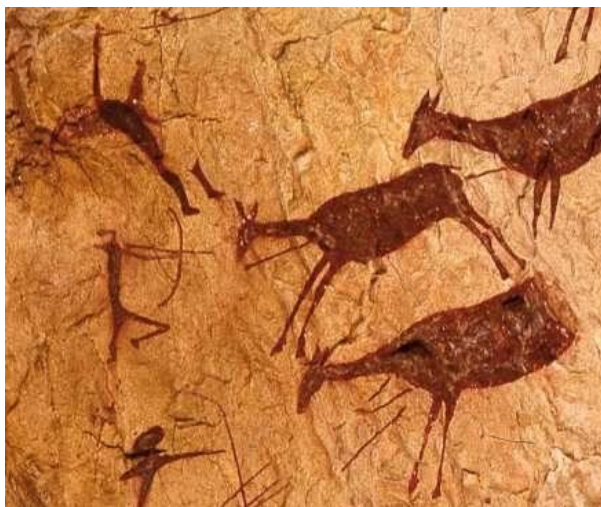
Figura 1. Pinturas rupestres, arte levantino. Cova dels Cavalls de Valltorta. Castellón- Castelló

El arte apareció con el Homo sapiens 2 , cuando el cerebro humano alcanzó sus dimensiones plenas. Desde el comienzo el arte es un medio de expresión de la vida interior del hombre, siendo indiferente el impulso básico del que proceda. El Paleolítico estuvo marcado por los grandes contrastes de la naturaleza, largas