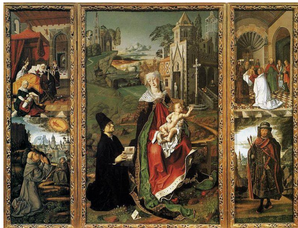
Figura 4. Arte Gótico. Retablo de la Virgen de Montserrat, catedral de Acqui Terme . (Bartolomé Bermejo, ca. 1485)

En la época románica predomina el dibujo y el contorno de las siluetas. La utilización de colores planos unidos a la carencia de profundidad solo provocaba la ausencia de volumen en las figuras. Aunque empezaremos a destacar la expresividad de los personajes debido al gran tamaño en que se realizaban algunas obras. Posteriormente en el gótico se sustituirán los muros por grandes vitrales, perdiendo en gran medida la pintura mural en este periodo y cobrando mayor protagonismo a las miniaturas y la pintura sobre tabla. Los temas seguirán siendo religiosos,