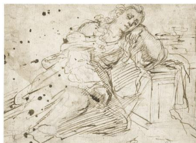
Figura 9. Boceto ( Murillo)

En este apartado hablaremos sobre los distintos recursos visuales y prácticos que llevaban a cabo los artistas del pasado con el fin de lograr la narratividad, comprensión y expectación en sus cuadros. Además, podremos apreciar las grandes diferencias entre las grafías de los artistas a la hora de hacer funcionar estos métodos en su obra.