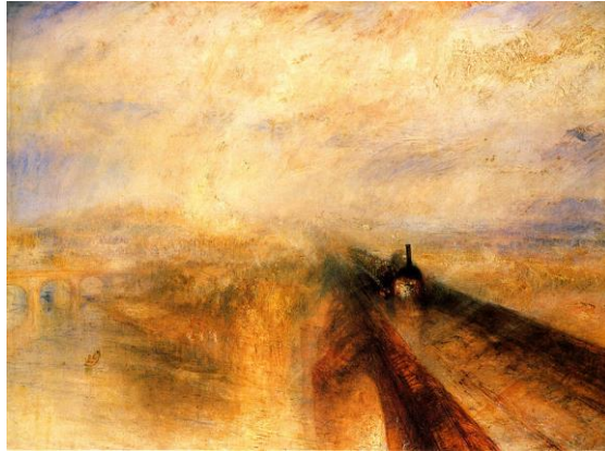
Figura 7. Impresionismo. "Lluvia, vapor y velocidad" (Turner, ca. 1844)

El realismo y lo cotidiano, representarán la realidad en la que se vive. A partir de aquí aparecerá el impresionismo, dotando a los pintores de mayor percepción y sensación, creando cuadros efímeros.