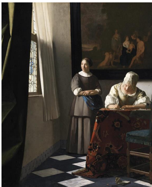
Figura 16. “Una dama escribe una carta con su sirvienta” ( Vermeer, ca. 1671)

A la hora de recrear ambientes, es muy necesario ser tremendamente observadores, ya que la luz incidirá de una forma u otra dependiendo de muchos factores. Aquí entramos en un espectro tan amplio de posibilidades que son imposibles de describir todas. La importancia lumínica es tanta, que gracias a ella podemos lograr escenas como las de la Figura 12 o como esta que veremos a continuación. Vermeer es considerado uno de los grandes maestros de la luz, su uso de las atmosferas