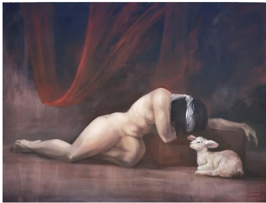
Figura 23 y 24. Experimentación de retentiva sin referentes. (Davinia Morales, ca. 2019)

que el estudiante trabaje su retentiva en clase y también pueda aplicarla en su correcta medida, ampliando su conocimiento iconográfico y estudios de la luz. El artista debe saber utilizar la mente a su favor y no encerrarse en composiciones fotográficas, todo esto hará que sea más sencillo identificar la caligrafía artística de cada alumno. Este tipo de ejercicios de retentiva fomentan un desarrollo de observación análisis y ejecución, así como la propia identificación artística del alumnado.