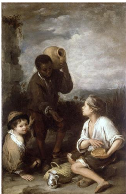
Figura 6. Arte Barroco. "Los tres muchachos" (Murillo, ca. 1670)

abandonar la falta de volumen y perspectiva presente durante el periodo medieval. Con la Edad Moderna las composiciones se llenarán de simetrías y proporciones. Destacará la perspectiva desde un punto de fuga central y un tratado de la piel y las telas mucho más volumétrico.