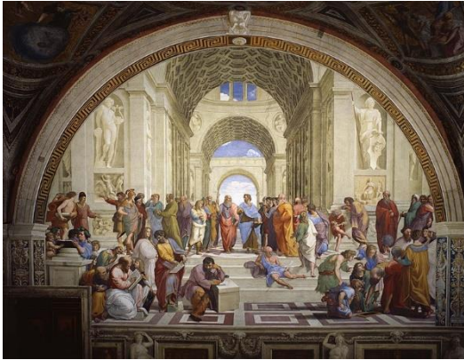
Figura 5. Arte Renacentista. "La escuela de Atenas" (Rafael, ca. 1512)

Al hablar del arte en la Edad Moderna nos referimos a un periodo con enormes cambios filosóficos y políticos que se reflejan en el arte renacentista y barroco. Los artistas abandonan el anonimato medieval y buscan amparo en los grandes mecenas. En el renacimiento se buscará la belleza y en el barroco el naturalismo, intentando