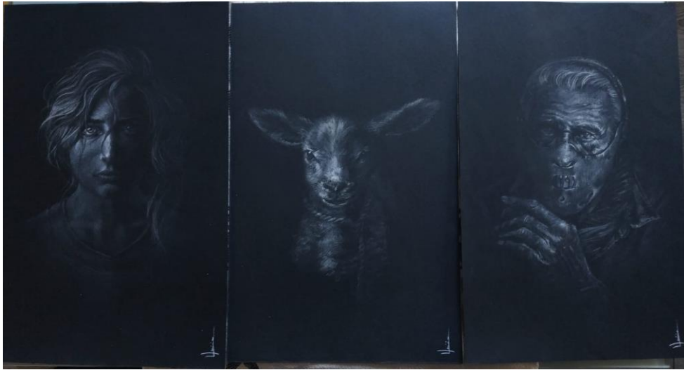
Figura 21. Creación narrativa tras los estudios 1. (Davinia Morales, ca. 2018)

mismo planteamiento puede ser utilizado tanto en la elaboración de paisajes, bodegones, o cualquier otra composición fantástica que tengamos en mente. Lo esencial de este desarrollo intuitivo y auto evaluador, es el trabajo de la memoria. Activar la capacidad cerebral de retención de información del estudiante, no solo le aportara soltura, si no que le permitirá auto evaluarse en cuanto a resultados pretenda obtener. El alumnado debe salir lo suficientemente capacitado como para poder resolver las distintas cuestiones que surjan en su obra y poder resolverlas.