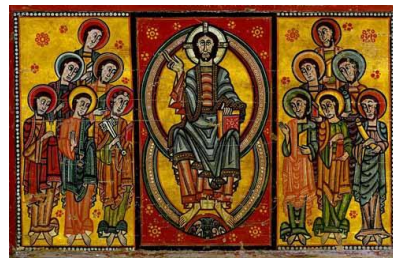
Figura 3. Arte Románico. "Pantocrátor y apóstoles". Anónimo español

Durante este periodo la iglesia alcanza mayor prestigio y poder, provocando una necesidad de templos más grandes y majestuosos, y con ello, un mayor número de obras caracterizadas por rendir culto u ofrenda a Dios.