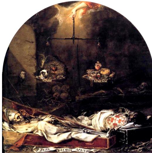
Figura 18. “Finis gloriae mundi” (Valdés Leal, ca.1672)