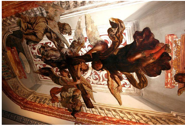
Figura 14. "El triunfo de la santa cruz" ( Valdés Leal, ca. 1685)

Otro paso para mejorar la narratividad de nuestras obras es el trabajo de la personalidad, no la nuestra, la de nuestros personajes. Saber y conocer las distintas expresiones a las que puede llegar un rostro son esenciales a la hora de trabajar la expresividad visual. No solo debemos tener en cuenta los elementos gestuales, también habrá que mostrarle gran importancia a saber diferenciar con nuestra pintura, las distintas etapas de la vida, como podemos apreciar en la siguiente figura.