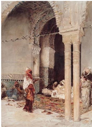
Figura 13. "El café de las golondrinas" (Fortuny, ca. 1868)

atención a las siguientes imágenes podremos contemplar la exactitud con la que estos maestros utilizaban la arquitectura. Fortuny utiliza la usa como propia composición en su obra, a diferencia de Valdés Leal que lo emplea como herramienta para simular la auténtica realidad , exacta e inamovible.