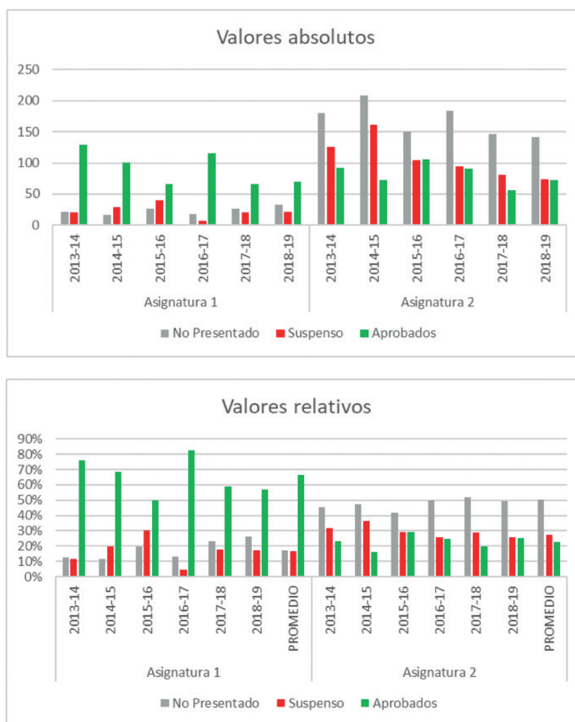
Figura 2. Comparativa de los resultados

mientras que la asignatura 2, debido al volumen de alumnos (ver Figura 2a), no ha participado plenamente. Analizando los resultados mostrados en la Figura 2b, se puede observar como el número de alumnos no presentados en la asignatura 1, es significativamente más bajo (un 17% en la asignatura 1 frente al 50% de la asignatura 2). Igual comparación puede establecerse en el número de aprobados en primera convocatoria.