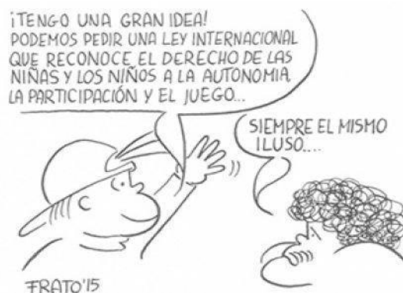
Figura 1. Viñeta a favor de la independencia de los niños y niñas (Tonucci, 2016 Recuperado de http://bonding.es/camino-seguro-entrevista-francesco-tonucci/ ).

Para que quede más clara la idea que describe Tonucci, a continuación, se muestra una imagen relacionada con esto (véase Figura 1).