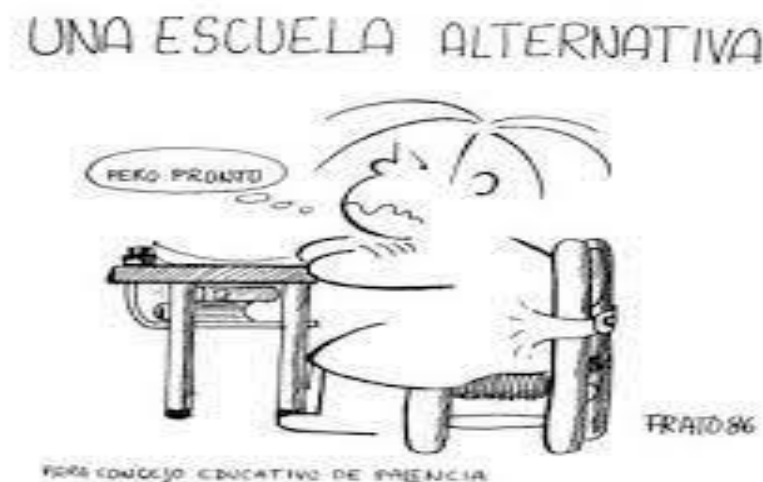
Figura 3: Viñeta sobre la reflexión de Frato (Tonucci, 2014 Recuperado de: https://commons.wikimedia.org/wiki/File:Frato_3.jpg .)

Para dar por concluido este apartado, a continuación, se muestra una imagen que refleja la necesidad que existe de una escuela diferente a la que existe hoy día, capaz de otorgarles a los niños ese protagonismo social que merecen como ciudadanos que son. Por eso buscan una escuela alternativa a la tradicional que tenemos actualmente en muchos centros educativos (véase Figura 3).