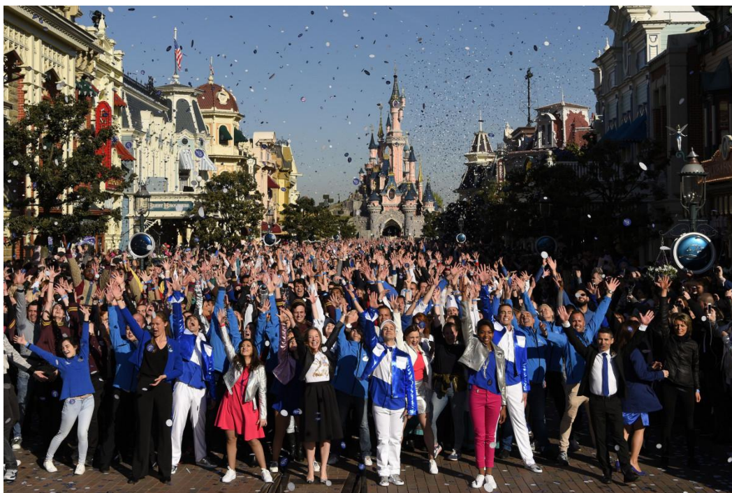
Figura 2.2. Cast Members (trabajadores) de Disneyland Paris celebrando el 25 aniversario del parque.

Orgullosos de su gran capital social, la política de recursos humanos de Disneyland Paris está basada en grandes compromisos para la igualdad de género, contratación de personas mayores, recién graduados y personas con discapacidad; y oportunidades de reinserción para los desempleados de larga duración. Sus diversas iniciativas en este campo trabajan juntas para crear un conjunto mayor que la suma de sus partes. La gente que trabaja en Disneyland Paris es, y siempre será, la base de su éxito (The Walt Disney Company, 2016).