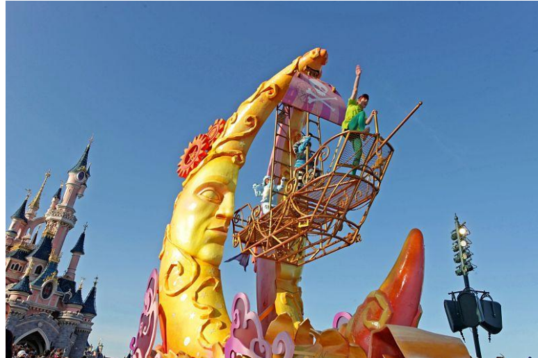
Figura1.5. Detalle de la carroza de Peter Pan.