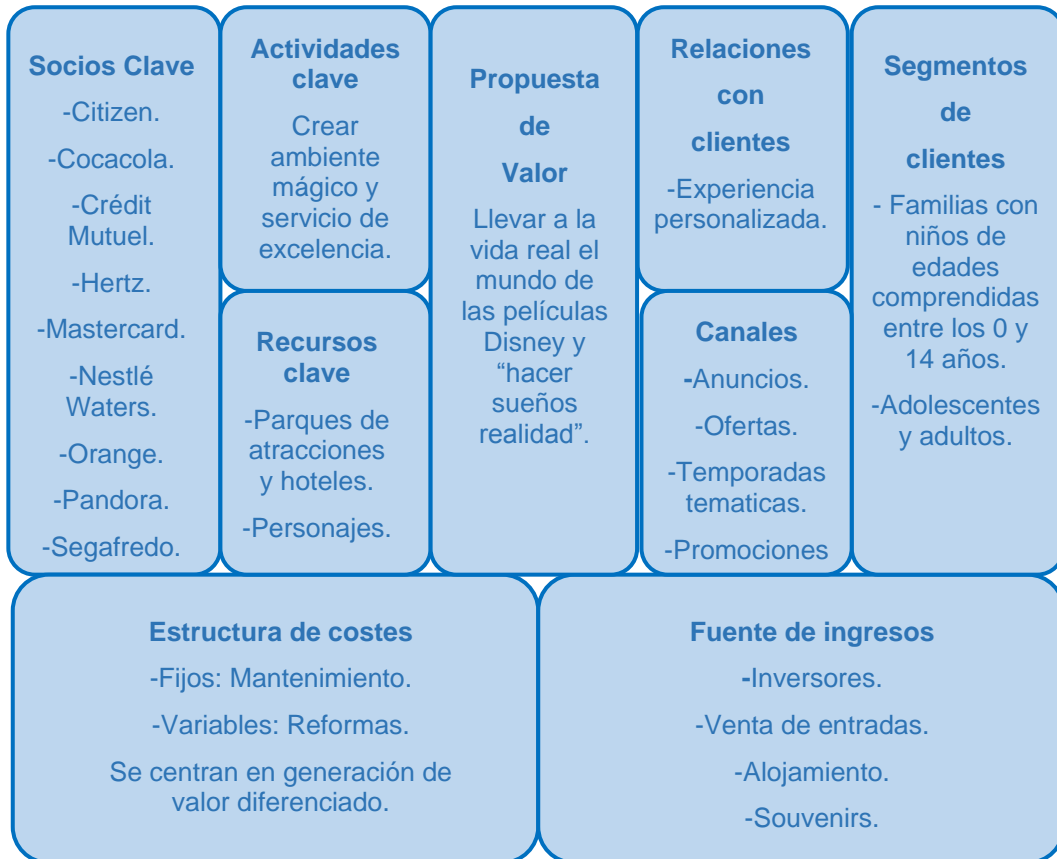
Tabla 3.1. Lienzo de negocio Disneyland Paris

Una vez analizados los distintos módulos, el lienzo de negocio (Canvas) quedaría de la siguiente forma: