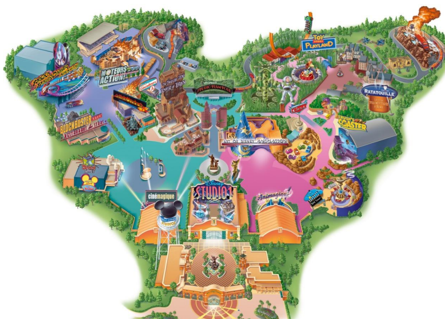
Figura 1.3. Mapa Walt Disney Studios