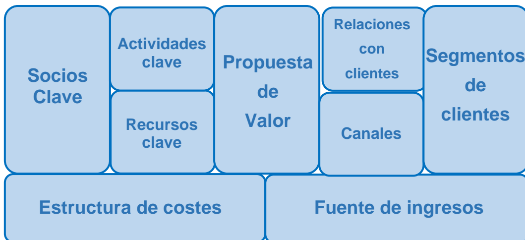
Figura 3.2 Esquema del lienzo de negocio (Canvas)