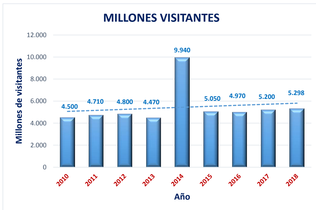
Figura 2.3. Número de visitantes en los últimos años

Todo esto convierte a Disneyland Paris en el quinto complejo turístico más grande de Francia y el primer destino turístico de Europa, lo que viene avalado por el hecho de que el 83% de los visitantes que admitieron que volverían a visitarlo, y por el 93% que lo recomiendan.