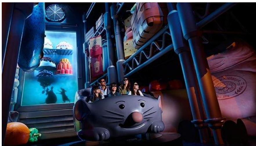
Figura 2.1. Interior de Ratatouille: l'Aventure Totalement de Rémy.

También se ha invertido en la renovación de atracciones que datan desde la apertura del resort como pueden ser Peter Pan's Flight, Big Thunder Mountain y La Cabane des Robinson (The Walt Disney Company, 2014) pues a pesar de los años, siguen siendo muy populares entre los visitantes.