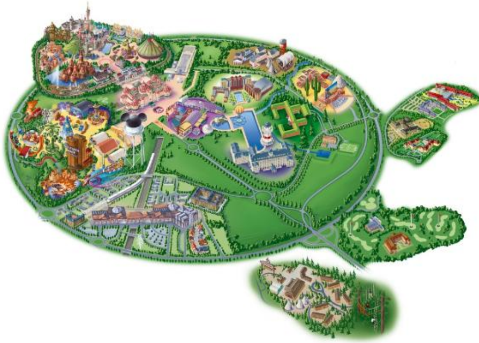
Figura 1.1. Mapa complejo recreacional Disneyland Paris

Todo ello ha contribuido a que Disneyland Paris se haya convertido, desde sus inicios, en el destino turístico más visitado de Europa.