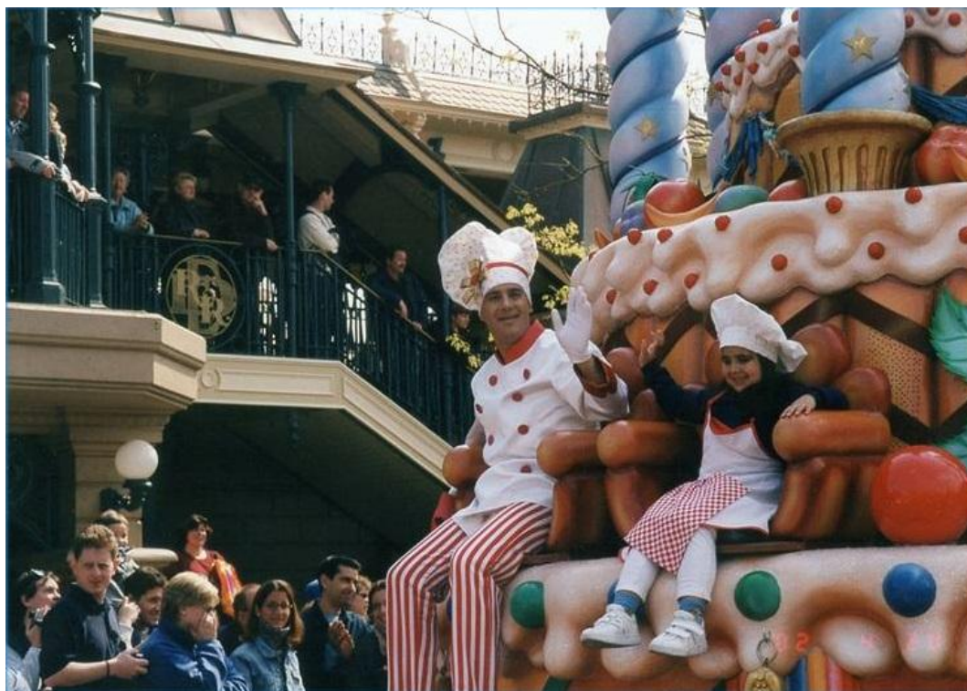
Figura 1.4. Niña escogida al azar durante el 10º aniversario de Disneyland Paris

El año en el que se celebra un nuevo aniversario de la apertura del parque, se elige cada día al azar a una persona o familia completa de entre todos los que esperan el paso del desfile, para que participe directamente en el mismo, contribuyendo así a que su experiencia sea aún más mágica.