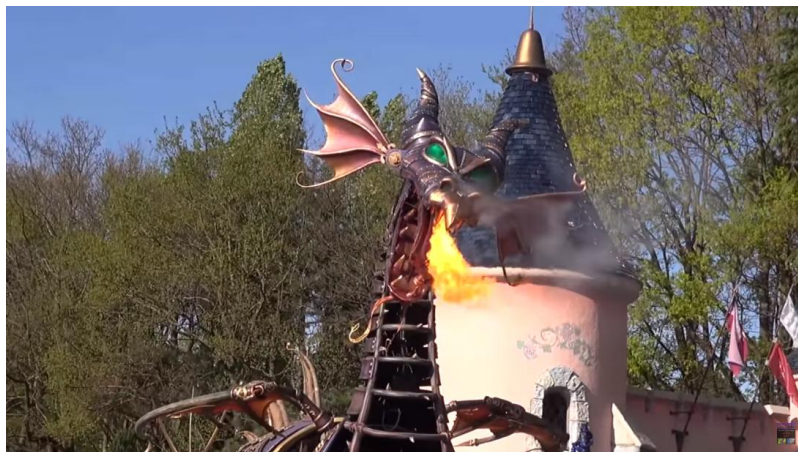
Figura 1.6. Detalle de Carroza expulsando fuego.