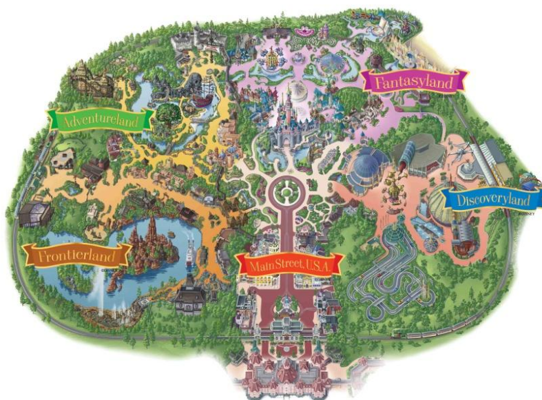
Figura 1.2. Mapa Disneyland Park

En 1992 abre el primero de los parques del resort, Disneyland Park que, como hemos mencionado anteriormente, se encuentra organizado en cinco espacios de temáticas claramente diferenciadas.