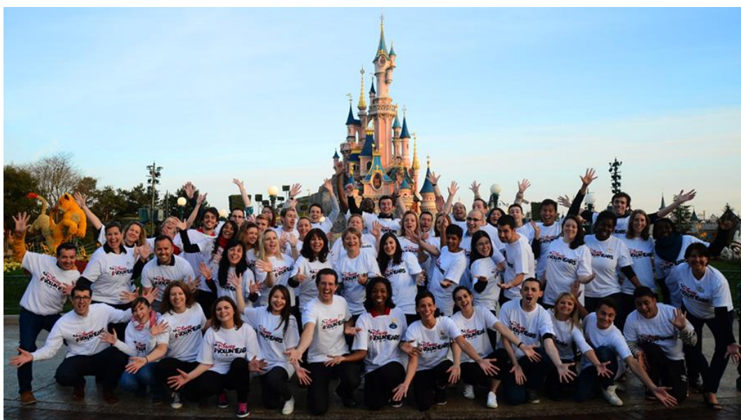
Figura 2.4. VoluntEARS posando delante del castillo en Disneyland Paris.

Todo esto no podría llevarse a cabo sin el compromiso de los trabajadores a través del programa VoluntEARS, un programa que anima a los trabajadores a donar un poco de su tiempo a actividades de voluntariado apoyadas plenamente por la compañía. Cada año, unas 8.000 horas de voluntariado son donadas a estos programas de beneficencia, lo que ha supuesto que puedan realizarse más de 1.000 actividades dedicadas a los niños.