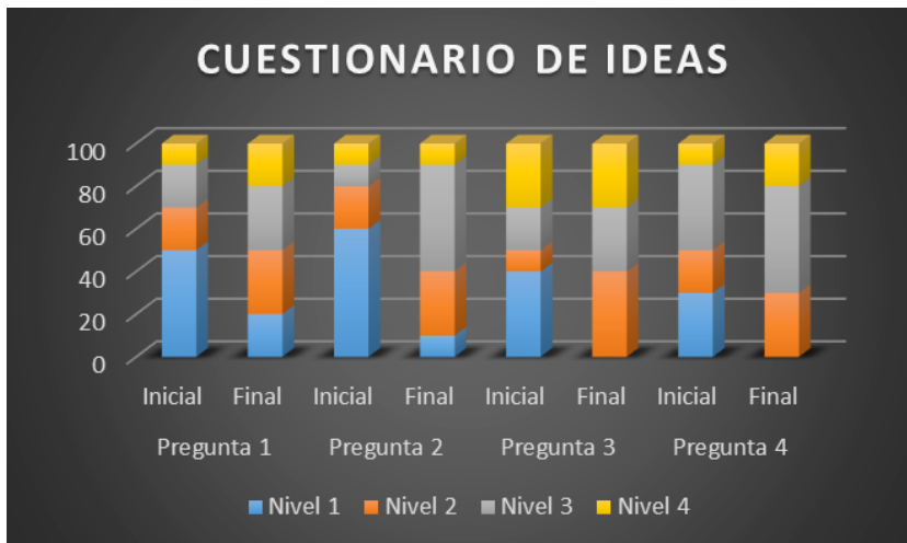
Figura 3. Niveles de conocimiento iniciales y finales del alumnado.

El análisis de los resultados puede llevarse a cabo teniendo en cuenta el nivel de la clase en general. En la Figura 3 se representan los niveles de conocimiento iniciales y finales mostrados en las respuestas del alumnado a las 4 preguntas citadas, lo cual refleja los conocimientos de que dispone la clase sobre los aspectos más relevantes del tema de estudio. En cuanto a los conocimientos iniciales podemos destacar que se trata de un grupo heterogéneo, ya que hay alumnos distribuidos en todos los niveles