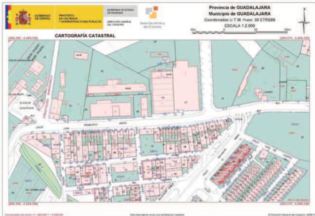
Figura 3. Cartografía Catastral de un Barrio de la Ciudad de Guadalajara (España).

Es evidente que el catastro da, o debería de dar, respuesta a preguntas sobre el tamaño y valor de la propiedad y su distribución en el territorio, así como sobre el uso relativo de las parcelas y su aptitud potencial, constituyendo en sí mismo un catálogo de bienes de un país. Las posibilidades funcionales que posee en aspectos tales como, la planificación económica y la ordenación del territorio son múltiples, y van mucho más allá del enfoque meramente fiscal que se le atribuyó en un primer momento.