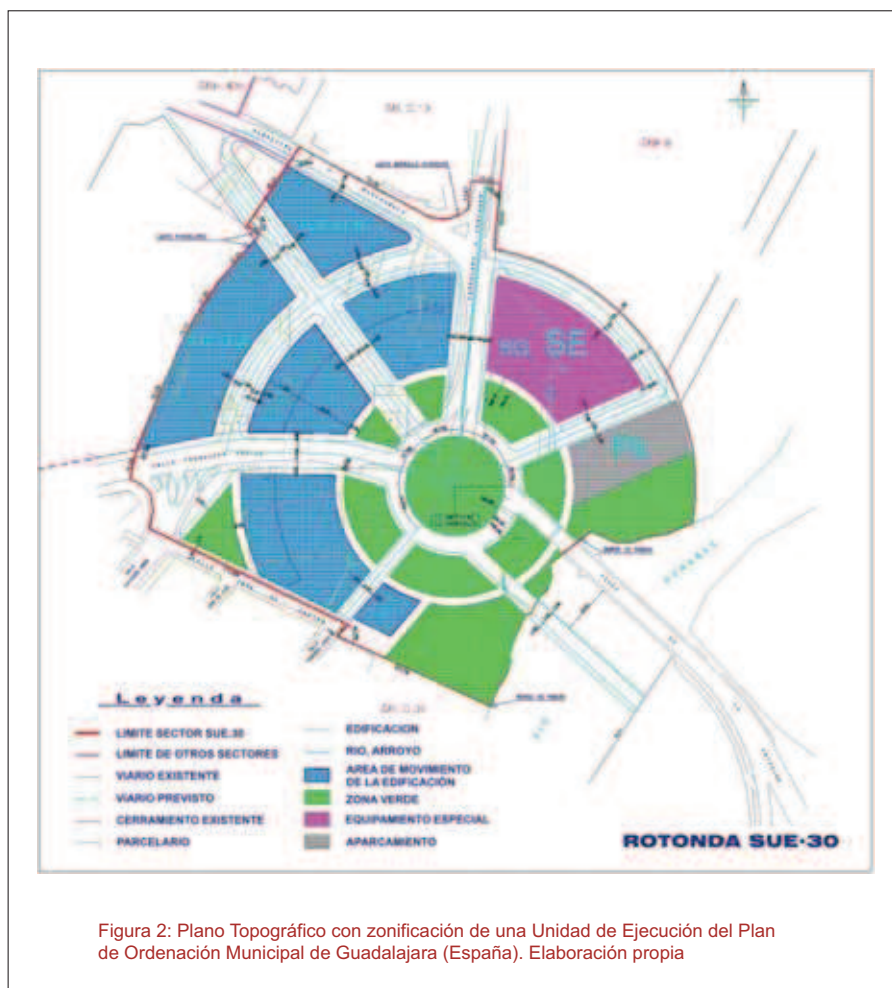
Figura 2: Plano Topográfico con zonificación de una Unidad de Ejecución del Plan de Ordenación Municipal de Guadalajara (España). Elaboración propia

Cada país establece su Sistema de Referencia Oficial, basado en un Sistema Geodésico, es decir, las prescripciones científico-técnicas que establecen un modelo matemático no real de la Tierra, pero lo más ajustado posible a la superficie del nivel gravimétrico de la misma (Geoide), determinado por unos parámetros matemáticos (Datum, elipsoide de referencia) y aplicación de un Sistema de Proyección Cartográfico que permite transformar la superficie curva terrestre en una superficie plana.