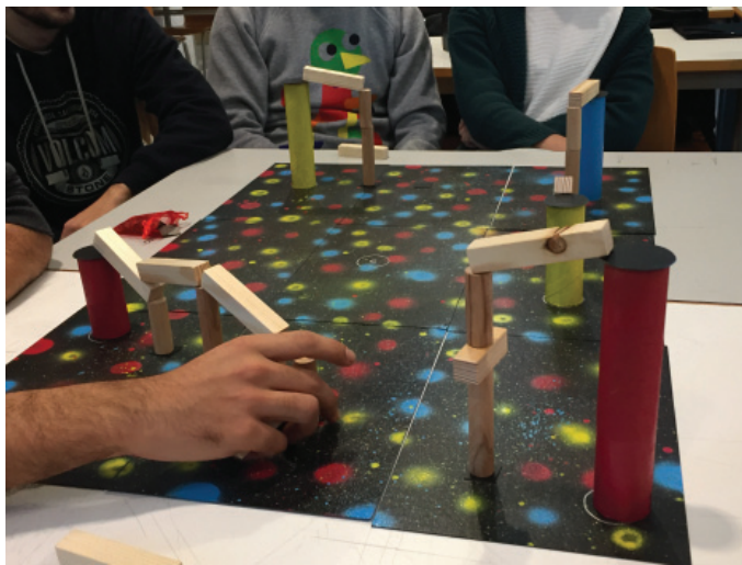
Fig. 4 Juego Pontejan realizado por los alumnos Jaume Cantarero, Llum Ruíz y Adrian Serra

Con la intención de crear no únicamente un juego de construcción que ponga en valor la arquitectura sino que además este suponga a su vez una formación en valores como la relación y el trabajo en equipo, nace el juego Pontejan , en el que la colaboración entre los diferentes equipos será un factor determinante para lograr el objetivo último y común del juego. Un juego colaborativo en el que todos ganan y será el azar el que irá dictando las fases de la construcción del mismo, con lo que la competitividad desaparece de la ecuación.