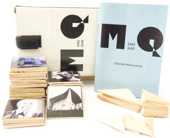
Fig. 1 Juego Arquivista realizado por el alumno Carlos Terry

Aparecen también juegos de construcción, cuyos materiales presentan similitudes con los juegos de construcción tradicionales. En el caso de Arquibloques , se utilizan piezas geométricas de madera que permiten construir elementos arquitectónicos de distintas épocas. En el juego Arquiwall se incorporan piezas de metacrilato junto con las de madera para formar un sistema de soportes y planos opacos y transparentes que reproducen distintos frentes acristalados de las obras de arquitectura más representativas del siglo XX.