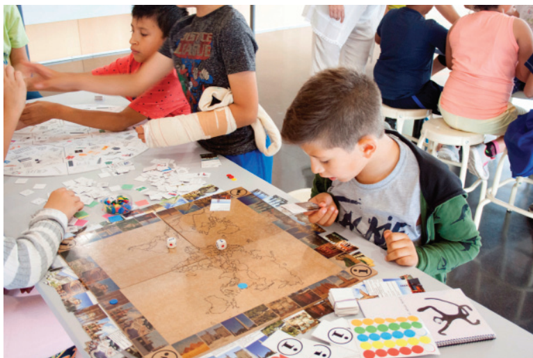
Fig. 5 Jornada de celebración de “Día del Juego” en la UPV, mayo 2017

Y finalmente, tras este proceso, el 31 de mayo del curso 2016-17, se tuvo la oportunidad de participar en el “Día del Juego” organizado por el Aula Infancia y Adolescencia en la UPV, con varios de los juegos realizados por los alumnos de Proyectos 2: Memoria Arq, Arquiwall, Arquivista, y La vuelta al mundo en 90 días. Esta jornada se recogió en un video y se comprobó que los juegos tenían una gran aceptación por parte de los niños de cuarto de primaria que durante cuatro sesiones de 45 minutos cada una estuvieron jugando con los juegos realizados por los alumnos de arquitectura. https://www.youtube.com/watch?v=p0EluXLjxus .