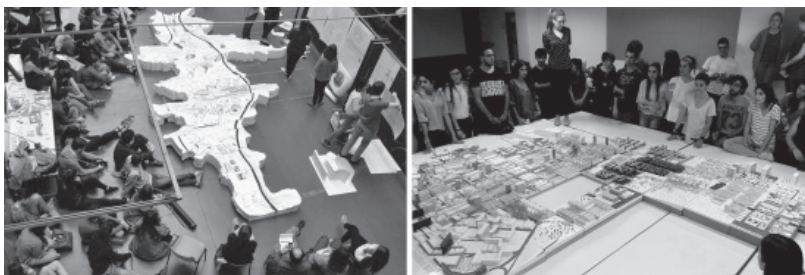
Fig. 1 Maqueta bandas Eibar, 2016; maqueta pixels Cobo Calleja, 2017

Los planteamientos subyacentes a estas experiencias son cada vez más frecuentemente valorados globalmente. De hecho, en los últimos años se han explorado infinidad de dimensiones del trabajo colaborativo, desde las relaciones entre distintos tipos de agentes (de la misma disciplina o de disciplinas distintas, consumidores y productores, alumnos y docentes, etc.), a los tipos de colaboración (sincrónica, asincrónica, etc.) o el número de colaboradores y la escala de los grupos, con aplicación a todo tipo de ámbito, desde el empresarial hasta el educativo.