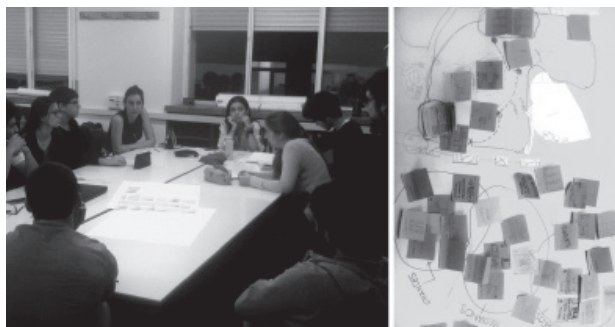
Fig. 2 Sesión de la táctica “Tablón de Anuncios”. Dinámicas basadas en estrategias “Design thinking”

Tácticas proyectuales colaborativas propone una experiencia pedagógica a través de una simulación de escenarios profesionales en los que se aprende, decide y produce colaborativamente, pautando el proyecto individual a través de un programa de dinámicas grupales. El proyecto supone un ejemplo de aprendizaje experiencial, al promoverse un espacio de aprendizaje universitario, por momentos similar a un estudio profesional de 30-50 agentes, donde tanto profesores como alumnado se someten al reto de desarrollar proyectos verosímiles en contextos reales o realistas. Este aspecto también conecta con otras tendencias como el “aprendizaje-servicio”, al plantear un contexto formativo cada curso, respecto al cual la comunidad de alumnos responde desarrollando trabajo de campo y asumiendo los roles que conforman cualquier proyecto urbano real y complejo (ciudadanos, políticos, expertos, constructores y arquitectos).