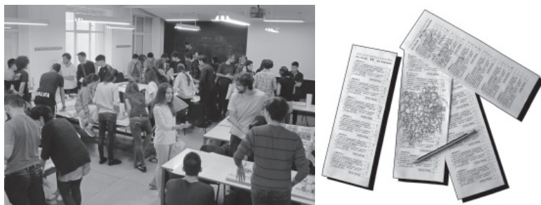
Fig. 8 Sesión de autoevaluación grupal. Dinámica de ida y vuelta entre Unidad Soriano y Unidad CoLab