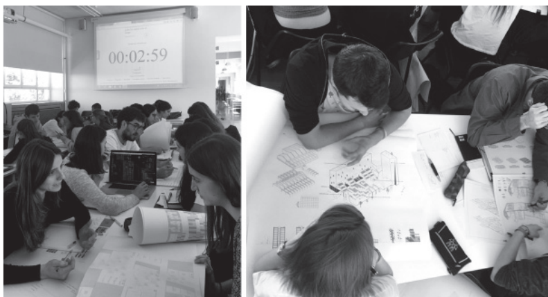
Fig. 5 Sesión de la táctica "Speed Dating". Unidades CoLaboratorio (2ºcurso) y Herreros (4ºcurso)

Finalmente, con la Autoevaluación grupal es posible cerrar cualquier fase, compartiendo la visión del propio alumno con toda la clase. Tras esta táctica, los alumnos que destacan para sus compañeros por ciertas capacidades identificadas en la autoevaluación, pueden ayudar con la Transferencia horizontal del Know-How a elevar las habilidades globales del grupo compartiendo sus herramientas y habilidades.