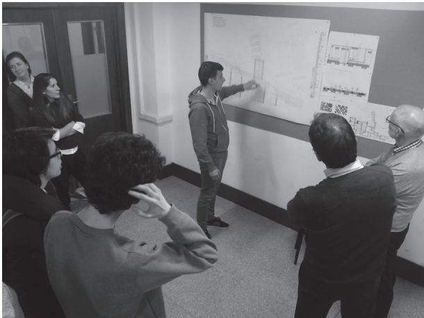
Fig. 6. Sesiones de Brainstorming con comité de expertos

A continuación, para favorecer el avance de proyectos ensamblables en una fase más convergente, y a su vez aprender a negociar y llegar a acuerdos colectivos, tomando decisiones y empatizando con las necesidades de todos los miembros del grupo, se superpone al curso la táctica Philips 66 . También, durante el desarrollo del proyecto, la táctica del Speed dating ayuda a encontrar soluciones a problemas y dudas detectadas, facilitando posibles vías de desarrollo del proyecto. Con esta táctica, además de desarrollar la capacidad de síntesis y comunicación de ideas, se fomenta la actitud crítica del alumno y su habilidad para analizar y evaluar los proyectos, otorgándoles protagonismo y confianza en el aula.