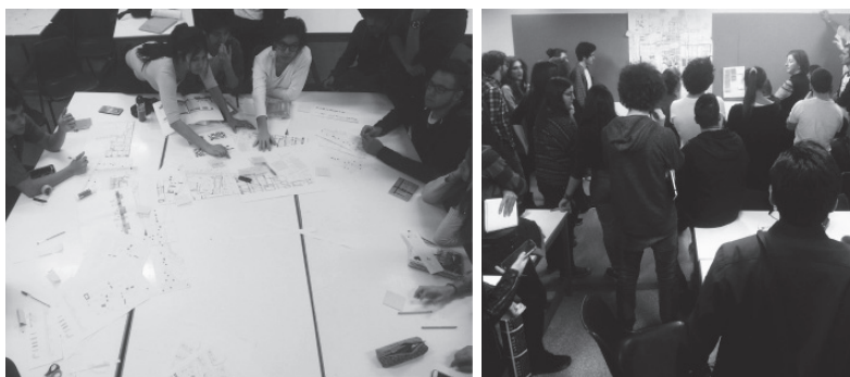
Fig. 7 Sesión de Philips 66 adaptado. Con fases grupales y conclusiones finales de toda el aula

En el resto de tácticas, la estructura de la clase tiene un carácter más individual, y cada alumno extrae sus propias conclusiones a partir de la suma de las aportaciones recibidas de otros compañeros. En el Speed dating participan hasta tres clases diferentes, y todos los alumnos se cruzan entre sí por parejas que van rotando cada determinado tiempo. Con la Autoevaluación grupal se cruzan dos clases diferentes, donde una de ellas reflexiona y evalúa el trabajo de la otra y viceversa, promoviendo la empatía y el enriquecimiento de las relaciones entre unidades docentes.