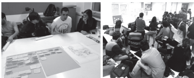
Fig. 4 Sesión de la táctica “Tablón de Anuncios”

Complementando a las cuatro anteriores, las tácticas de Transferencia horizontal de Know-How y Autoevaluación grupal , se asocian de manera más directa con la redistribución de habilidades y la cooperación y no tanto con la resolución de problemas.