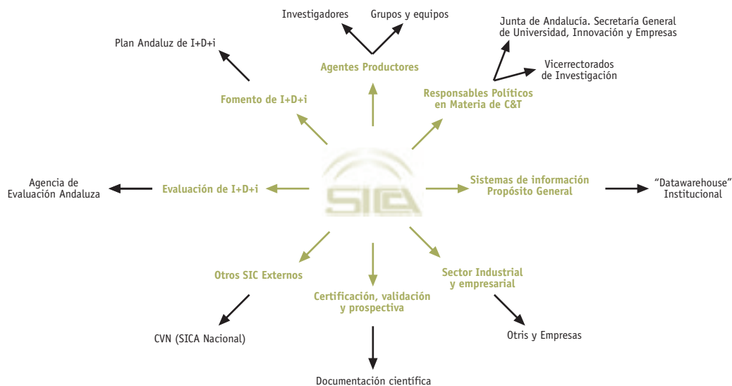
Figura 5. Agentes del conocimiento de SICA