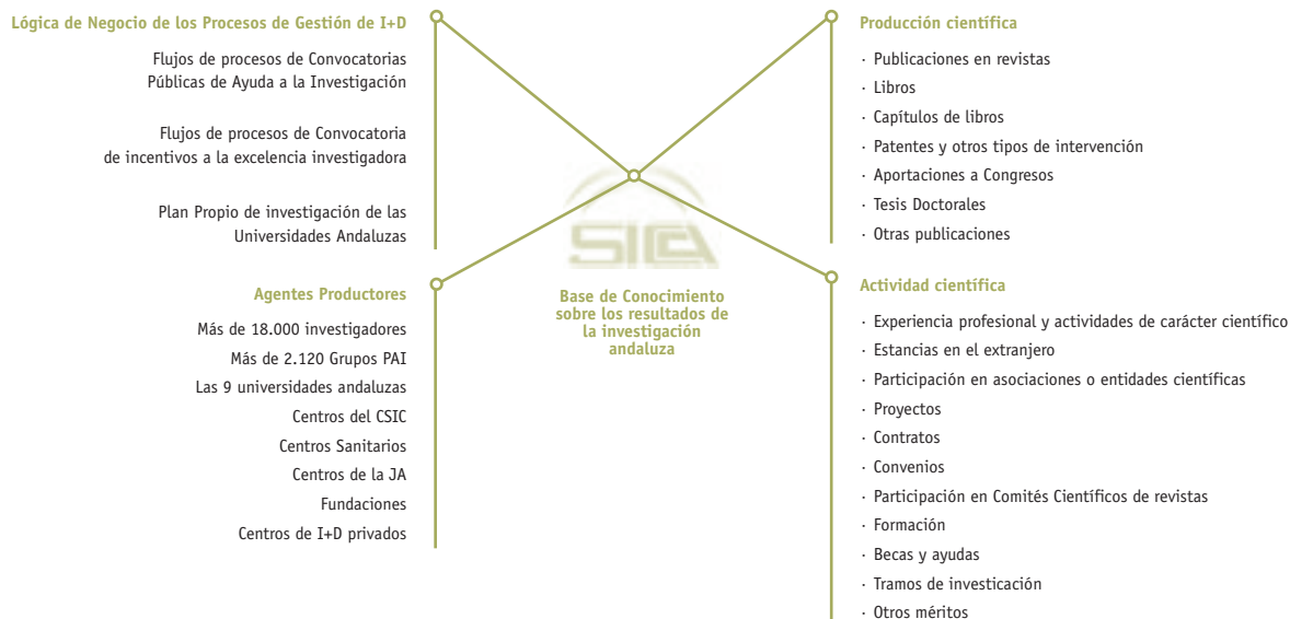
Figura 1. Arquitectura Institucional y Funcional de SICA