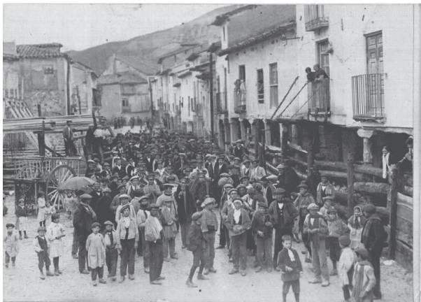
Fig. n.º 4.- Plaza Mayor de Tendilla (Guadalajara) en 1911 preparada para los festejos taurinos.

Esta conducción era presenciada por numerosos vecinos a pie que participaban como espectadores y provocaban la carrera de los toros. Los toros entraban en la población a través de una de las puertas de la muralla que rodeaba a la ciudad, desde la cual eran conducidos por las calles de la población, preparadas al efecto mediante andamios y vallas, hasta la plaza en que tendría lugar la corrida. Por las calles de la ciudad los toros eran conducidos por vecinos a pie, que corrían con los toros participando