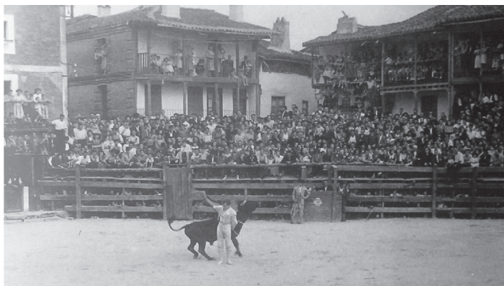
Fig. n.º 2. Plaza Mayor de Candelada (Ávila) en tarde de toros.

también aparecen involucrados en la celebración, pues, aunque no tenían dinero suficiente para poder adquirir una entrada para contemplar el espectáculo, constituían la masa popular que acompañaba a las reses desde que se aproximaban a la ciudad hasta que eran conducidas a los toriles en los que se guardaban antes de su lidia (Flores, 1999:269-270). Era de estas clases más humildes de las que salían muchos de los lidiadores, que primero fueron aficionados y, posteriormente, profesionales.