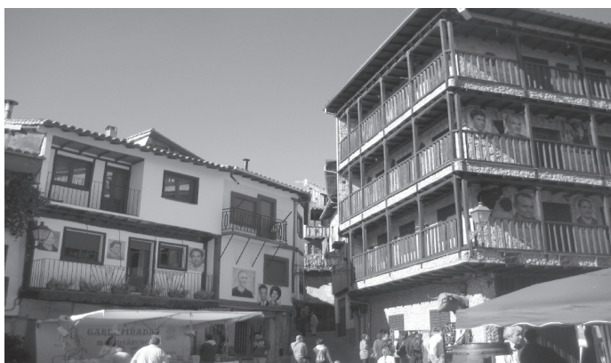
Fig. n.º 6.- Plaza Mayor en Mogarraz (Salamanca) , cuyas fachadas están corridas por galerías abalconadas para contemplar los festejos taurinos.

centro de poder local, ya que en ella suelen residir las sedes de los diferentes organismos municipales, especialmente las Casas Consistoriales. Pero también es el lugar de reunión de la ciudadanía, bien como consecuencia de la convocatoria de las autoridades, bien por iniciativa propia para asistir a actos lúdicos y de esparcimiento. Por último es la sede del mercado, primero periódico, generalmente semanal, posteriormente permanente al albergar las tiendas que los mercaderes abren a dicha plaza. En