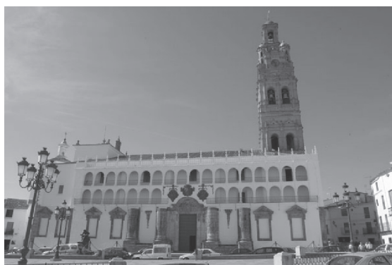
Fig. n.º 1. Fachada de la Parroquia de Nuestra Señora de la Granada en Llerena (Badajoz), claro ejemplo de mirador a la Plaza Mayor de la localidad.

Cuando el recurso a los asentistas del matadero, o el cobro de ciertos arbitrios en el caso de las corridas ordinarias fue insuficiente, sobre todo como consecuencia del aumento de los gastos derivados del incremento en el número de toros lidiados y de la elevación de su precio, así como de la creciente profesionalización de los lidiadores, se recurrió a otros nuevos expedientes. Entre éstos estaba la fijación de un arbitrio a los propietarios de ventanas o balcones de las plazas en las que se celebraban los