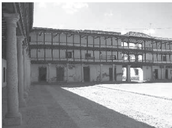
Fig. n.º 7.- Plaza Mayor de Tembleque (Toledo), cuyas balconadas y galerías permiten contemplar los espectáculos que se celebran en la misma.

La organización de fiestas de toros en la Plaza Mayor era un negocio rentable gracias a la explotación de las localidades que se vendían. Lo más frecuente era que los dueños, en el caso de tener alquiladas sus casas, se reservaran el uso y aprovechamiento de sus balcones. El alquiler de los mismos durante