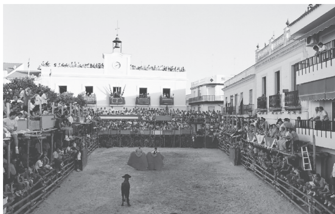
Fig. n.º 5.- Plaza de España en Beas (Huelva) en tarde de toros.

De esta forma, los espectáculos taurinos se fueron adecuando a los espacios urbanos disponibles, sin introducir en ellos grandes modificaciones permanentes, pero sí desarrollando