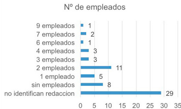
Tabla 6. Elaboración propia a partir del Registro Mercantil y observación de los medios

Su distribución territorial ratifica que son aquellas provincias con localidades de mayor tamaño y con mayor tejido industrial en sus comarcas – Toledo y Ciudad Real – las que agrupan mayor número de digitales. Al igual que sucede con los medios convencionales, Guadalajara y Cuenca destacan por sus carencias, con apenas 7 y 5 digitales, respectivamente.