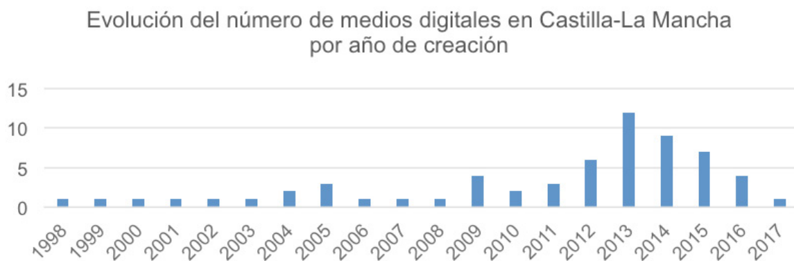
Tabla 4. Elaboración propia a partir de la información aportada por los medios

La información localizable a partir de la observación directa revela que el 17,5% no aporta datos sobre su empresa editora y, por tanto, no se puede conocer su fórmula empresarial ni el tamaño de su plantilla. Tampoco a través de fuentes complementarias como OJD Interactiva puesto que no todos han solicitado su sistema de auditoría. Esto significa que en once digitales no se puede saber quién controla y gestiona la información, una opacidad que suscita preocupación. En los que es posible identificar la empresa editora, la fórmula predominante es la sociedad limitada, quedando en segundo lugar los autónomos. Las cooperativas o las comunidades de bienes son clara excepción, al igual que las alianzas. Sólo se identifica una fórmula de colaboración entre la edición autonómica del eldiario.es CLM y Las Noticias de Cuenca y Albacete Capital , que consiste en un intercambio no remunerado de información entre el medio regional y los locales.