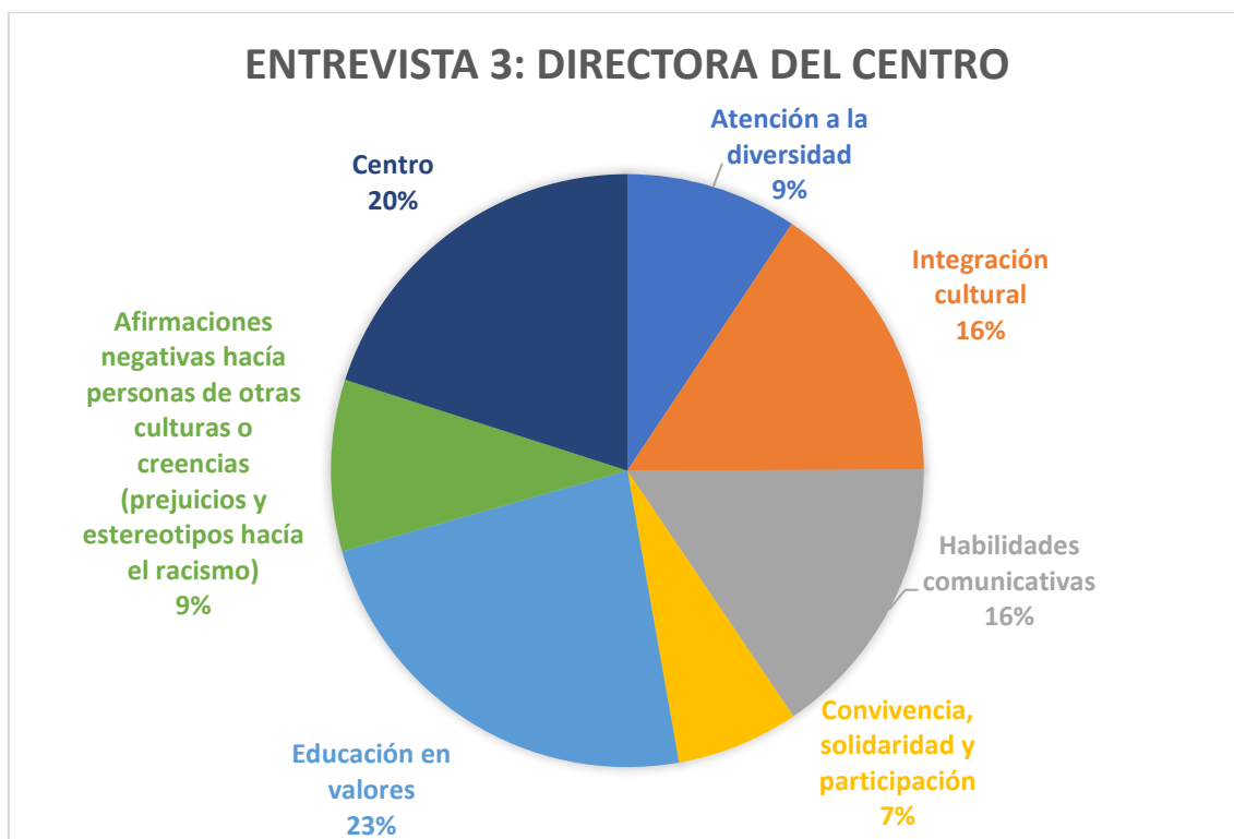
Entrevista 3. Directora del centro