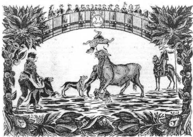
Fig. n.º 5.- Toro volteando a perros en una plaza de toros.

a problemas, escritos y pérdidas de tiempo en la gestión municipal. El corregidor de Madrid resume así la condición del conde: «Yo lo puedo todo, yo lo mando todo. En todo se ha de ver mi nombre». Esta actitud poco reflexiva e impulsiva le llevó a tomar decisiones y a dar órdenes (con todo el papeleo consiguiente), que después había que desechar, pues no eran operativas o contradecían otras que se habían dado con anterioridad.