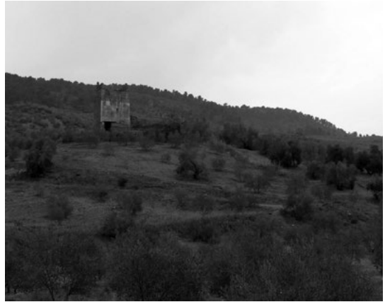
Implantación del recinto del Cardete en el cerro que controla el área cultivable