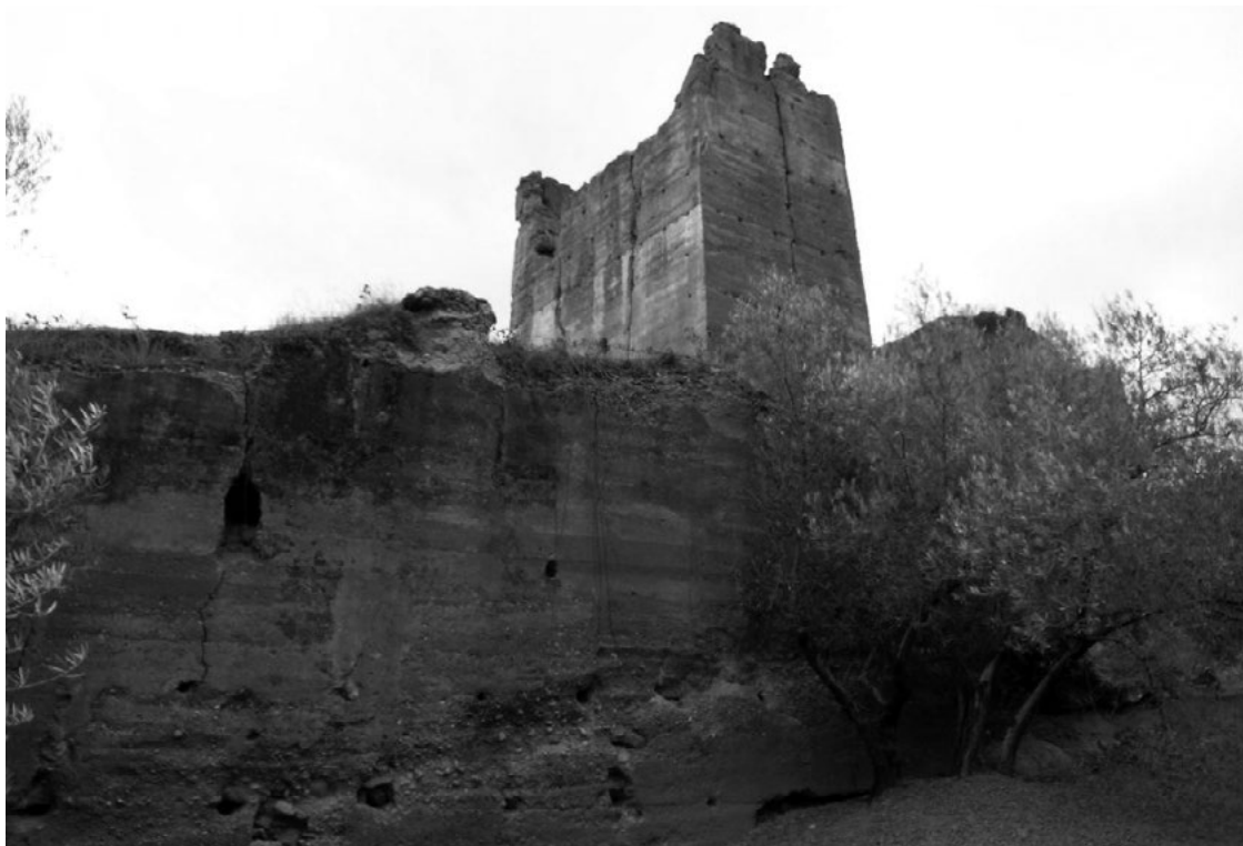
Vista norte de la torre y recinto del Cardete