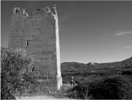
Castillo del Cardete al fondo el castillo y núcleo de Segura de la Sierra, con restos de ruinas de un lienzo del recinto, actualmente desaparecidos.