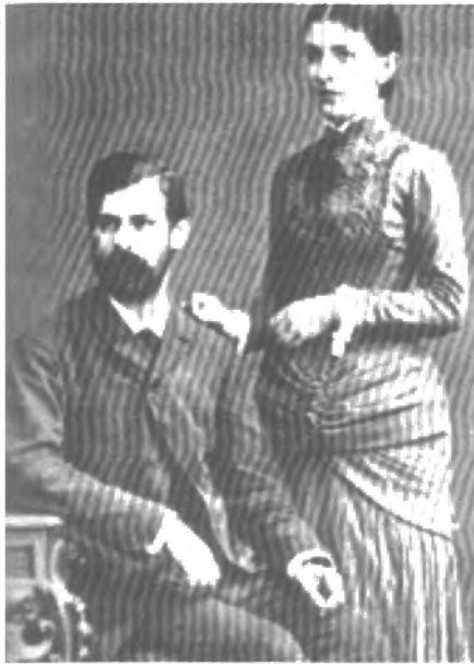
Fig. n.º 78.- Freud con su novia Martha. Apud Freud (1973: I, Lám. 14).

tendencias pregenitales de orientación homosexual. La interpretación del machismo de Ramírez se apoya en el contenido del duelo verbal, un desempeño diario del papel de macho . En el transcurso del duelo se emplean corrientemente diversas metáforas que acusan al oponente de feminidad (Romano, 1960: 972). La dialéctica entre feminidad y masculinidad en el machismo