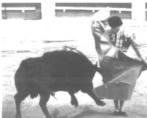
Fig. n.º 79.- 'Chicuelina' de Manolo Vázquez. Apud López Uralde (2000: 10, 127).

embellecimiento que hace el torero cuando toma en su boca el cuerno del toro (Arruza, 1956: 195) podría ser una extensión de este modelo, el cual refuerza el propio nombre del pase más importante de los que se dan con el capote, la verónica . Su nombre proviene de la santa que enjugó el rostro del Cristo, porque a la santa siempre se la ha representado sosteniendo el paño de la misma manera que el torero sujeta el capote cuando inicia el pase (Hemingway, 1954: 65-66). El toro también se