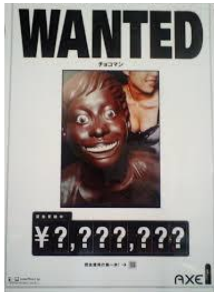
Ilustración 8: Anuncio japonés parte de una campaña de Axe centrada alrededor de un buscado chico hecho de chocolate.