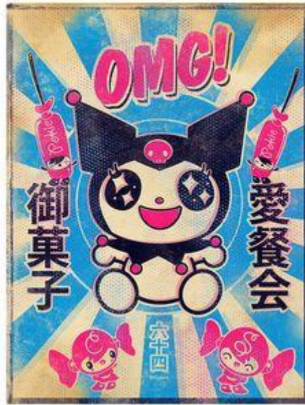
Ilustración 10: Ejemplo de publicidad de estética kawaii .

En cuanto a las características estéticas de estos personajes, cuentan con una fórmula bastante básica y fácilmente reconocible. Se pueden distinguir por el uso de figuras simples y redondas, a menudo representados de manera emocionalmente ambigua para permitir al público interpretarlos libremente. Los rasgos faciales tienden a ser muy sencillos salvo por los ojos, los cuales son el punto de atención principal al ser más grandes y detallados. La cabeza de estos personajes suele ser más grande que el cuerpo, imitando las proporciones de un bebé o un cachorro y apelando así al impulso humano de cuidar a los recién nacidos. Delineados en negro, en ellos predominan los colores pastel y una apariencia infantil. Se trata de un estilo minimalista con el que los diseños resultan simples y a la vez lo más adorable posible, todo para conseguir esta estética kawaii con la que llegar hasta el consumidor. Un ejemplo ampliamente conocido y que reúne todas estas características es Hello Kitty, icono de lo kawaii no solo en Japón sino en el mundo entero.