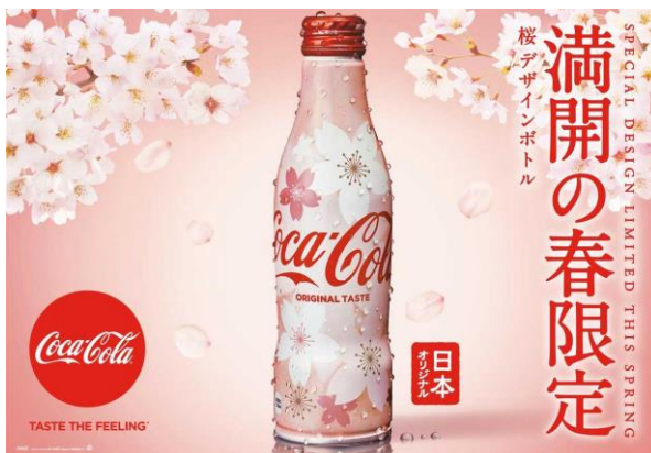
Ilustración 16: Coca Cola anuncia un nuevo diseño para sus botellas basado en los sakura .

Otro ejemplo podría ser el uso de la imagen de los sakura , los cerezos japoneses en flor que tanto caracterizan a la cultura nipona, así como el hanami , la tradición de observar y apreciar estos cerezos durante la primavera. La publicidad japonesa ha sabido aprovechar el valor estético de los cerezos sakura y combinarlo con el sentir nacional japonés para transformar estas icónicas flores en una potente herramienta publicitaria.