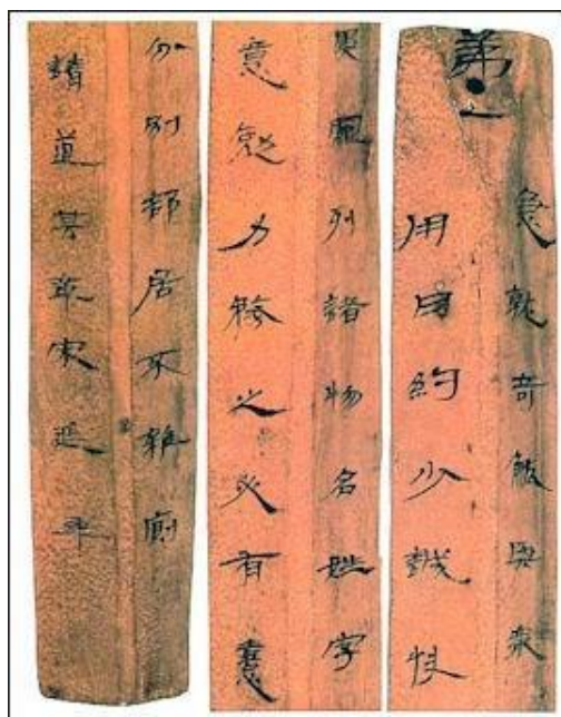
Ilustración 1: Mokkan japonés