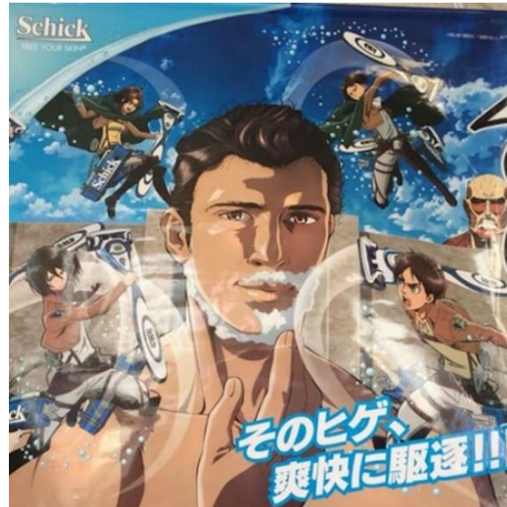
Ilustración 19: Schick anuncia sus cuchillas de afeitarse a través del popular anime Attack on Titan .

La influencia del anime en la publicidad japonesa es tan grande que no es de extrañar encontrar cortos publicitarios animados con este estilo como si de una serie o película más se tratase. La publicidad anime ha contado con la presencia de algunos de los animadores de más reputación del panorama de la animación japonesa, como Yoshiharu Sato, conocido por dirigir y participar en varias películas de Studio Ghibli -considerado por muchos uno de los mejores de estudios de animación del mundo- para producir piezas publicitarias. En estos casos estamos hablando de anuncios de alrededor de un minuto de duración en los que el valor estético propio de piezas gráficas viene acompañado de una historia y unos personajes, elementos que suponen dos pilares esenciales del anime también aplicables al ámbito publicitario. Por lo tanto, cabe destacar estos anuncios de alto nivel de producción que pasan a reunir todas las características de valor de la animación japonesa y a usarlas para fines comerciales, prueba de que el anime, incluso en su forma más pura y más allá de lo estético, vende.