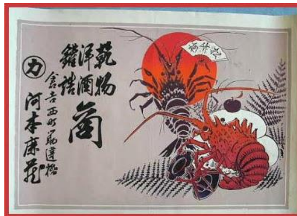
Ilustración 2: Imagen de un hikifuda japonés

En este contexto es donde surge el antecedente de los flyers o panfletos, los hikifuda , un tipo de publicidad de gran éxito basada en impresiones litográficas sobre papel. Los hikifuda seguirían siendo popular hasta bien entrado el siglo XIX, coincidiendo con el surgimiento del ukiyo-e , una variante de carácter estrictamente publicitario con la que compartían técnicas y formato. Además, el efecto y eficacia de los hikifuda ya fue objeto de estudio en el año 1683, mientras que en occidente no fue hasta el siglo XX cuando se comenzó a estudiar la publicidad y su influencia (Alberola, 2013). Cabe destacar la fuerte influencia en la actividad publicitaria del país del teatro Kabuki mediante la interpretación de historias que tenían lugar antes de que comenzase la representación teatral y cuyo fin era vender un producto al espectador de manera muy similar a los anuncios actuales basados en el storytelling . Se trata de los primeros casos de publicidad audiovisual emitida en directo que se pueden apreciar en la historia de Japón.