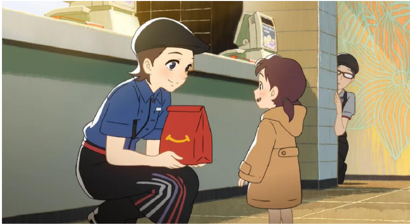
Ilustración 20: Imagen de un corto publicitario anime emitido por McDonalds para su campaña Crew ni Naro .

Es imposible negar que nos encontramos ante de una de las herramientas más poderosas del ámbito publicitario japonés, teniendo en cuenta su dominante presencia mediática. Ofreciendo un inmensurable valor tanto estético como intangible, el anime cuenta con un reclamo difícil de igualar al ser un fenómeno cultural que ha pasado a ser otro de los numerosos elementos que definen la cultura japonesa.