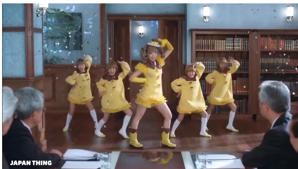
Ilustración 25: Anuncio japonés en el que una reunión de serios trabajadores es interrumpida por un grupo de chicas que bailan vestidas de flan.

Una característica concreta mediante la cual podemos distinguir el humor absurdo de la publicidad japonesa es el uso de elementos que destacan en un contexto relativamente normal y realista. En anuncios japoneses a menudo podemos ver situaciones cotidianas que a primera vista resultan aburridas, pero que contienen un solo componente que destaca de manera sorprendente por su extravagancia. Normalmente estos elementos aparecen de manera inesperada, siendo el repentino contraste entre lo mundano y lo absurdo lo que otorga el tono humorístico. Un ejemplo sería un anuncio en el que aparece una reunión de apagados oficinistas, de entre los que de repente aparece del bolsillo de uno de ellos un sonriente gato gigante para repartir felicidad –siendo esta felicidad el producto a anunciar–.