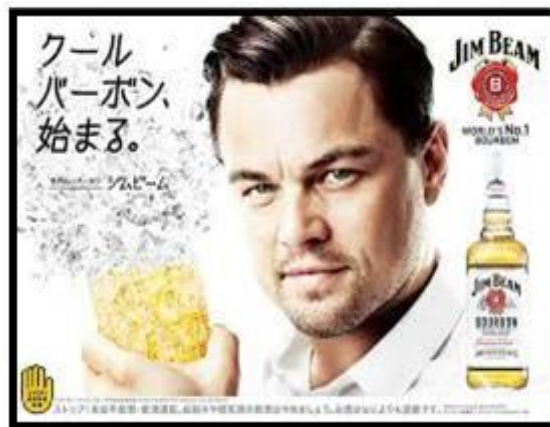
Ilustración 5: Leonardo Di Caprio anuncia ginebra Jin Beam.

Por último, conviene hablar de otra característica de bastante relevancia en el panorama publicitario japonés de hoy día, la constante presencia de celebridades. El uso de celebridades es una estrategia bastante común en el ámbito publicitario mundial, aprovechando la influencia que estas tienen ante el público para hacer llegar el mensaje y crear una imagen positiva no solo para el producto sino para el propio anunciante. Sin embargo, el caso de Japón es algo más extremo, ya que según Praet, el porcentaje de anuncios japoneses en los que se hace uso de la imagen de una celebridad supera el 47%, un número bastante alto comparado con el 20% de EEUU o el 15% de Francia. (2001). Aun así, cabe destacar que una parte importante de estas estrellas está formada por los denominados talents -o tarentos en japonés-, potenciales celebridades todavía en camino a la fama y de las que hablaremos más adelante. ¿A qué se debe por lo tanto este excesivo uso de la imagen de los famosos? Praet resume las principales razones y las divide en tres categorías distintas (citado en Björn, 2014)