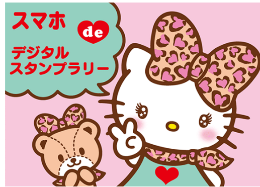
Ilustración 11: Gráfica publicitaria de Hello Kitty extraída de http://kao-ani.com

La enorme influencia que tienen estos personajes es algo que destacar, puesto que los podemos ver en contextos en los que fuera Japón resultaría fuera de lugar. Por ejemplo, en Occidente nos resultaría extraño ver como un aeropuerto se promociona con una mascota de dibujos animados de aspecto infantil, pero en Japón es algo que se considera normal por la relevancia que tiene lo kawaii en su sociedad. Existen casos que nosotros consideraríamos más extremos en los que se ha usado esta estética en publicidad japonesa gubernamental o incluso militar.