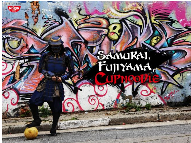
Ilustración 15: Cup Noodle anuncia sus fideos con un samurái jugando al fútbol en Brasil.

Otro ejemplo podría ser el uso de la imagen de los sakura , los cerezos japoneses en flor que tanto caracterizan a la cultura nipona, así como el hanami , la tradición de observar y apreciar estos cerezos durante la primavera. La publicidad japonesa ha sabido aprovechar el valor estético de los cerezos sakura y combinarlo con el sentir nacional japonés para transformar estas icónicas flores en una potente herramienta publicitaria.