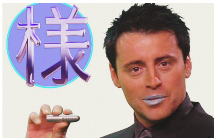
Ilustración 22: Matt LeBlanc protagoniza un anuncio japonés de pintalabios masculino.

Otra característica a destacar del enfoque japonés de la publicidad basada en el uso de celebridades es el amplio de uso figuras extranjeras. Mientras que es común ver celebridades de origen japonés protagonizando anuncios- especialmente los denominados talents mencionados anteriormente-, en Japón predominan aquellas que son extranjeras, siendo mucho más reclamadas en comparación con los casos de países como EEUU. Particularmente, son los personajes famosos occidentales los que más reclamo tienen en el ámbito publicitario nipón.