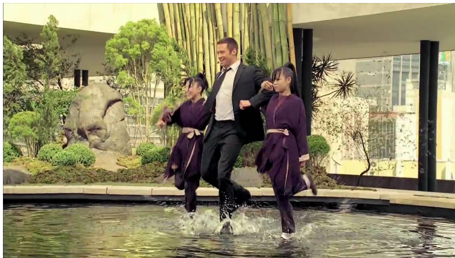
Ilustración 21: Hugh Jackman baila con dos jóvenes chicas en un anuncio japonés de Lipton Ice Tea.

Otra característica a destacar del enfoque japonés de la publicidad basada en el uso de celebridades es el amplio de uso figuras extranjeras. Mientras que es común ver celebridades de origen japonés protagonizando anuncios- especialmente los denominados talents mencionados anteriormente-, en Japón predominan aquellas que son extranjeras, siendo mucho más reclamadas en comparación con los casos de países como EEUU. Particularmente, son los personajes famosos occidentales los que más reclamo tienen en el ámbito publicitario nipón.