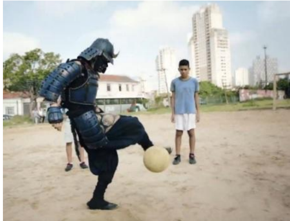
Ilustración 4: Cup Noodle anuncia sus fideos instantáneos con un samurái jugando al fútbol en Brasil.

Si seguimos hablando de la publicidad japonesa actual, es imposible no mencionar el simbolismo, elemento característico en el que se basa la actividad publicitaria de este país. El simbolismo es un concepto que existe en cualquier cultura pero que, al mismo tiempo, es exclusivo de cada una de ellas. Palabras e imágenes pueden estar cargadas de significado simbólico, pero desde un punto de vista ajeno al contexto cultural pueden resultar imposibles de entender. En cuanto al caso de Japón, la cultura japonesa se caracteriza no sólo por la cantidad de símbolos que existen en ella, sino además por la complejidad de estos.