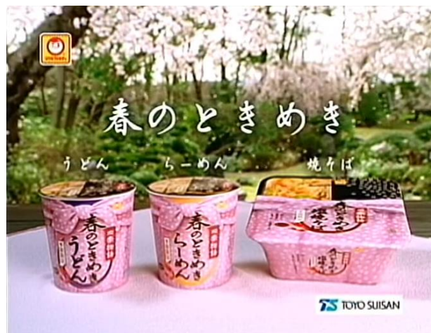
Ilustración 17: Imagen de un anuncio de Instant Noodles.

estéticamente agradables, las flores de estos cerezos son de fácil uso en la comunicación comercial, contando con un color claro y brillante con el que hacer destacar la pieza y otorgando al mismo tiempo un énfasis en la belleza natural. Aquellos anuncios que hagan uso de los sakura tenderán a estar centrados en una estética más natural y menos llamativa de lo común, transmitiendo un sentimiento de tranquilidad y armonía. A menudo se presentan en el contexto del hanami , el festival en el que la gente se reúne y acude a parques a contemplar los cerezos una vez florecen en primavera, normalmente con la familia. Al suponer una tradición muy importante, es de esperar que se haga de uso de ella a la hora de realizar publicidad que apele al kokumin-sei .