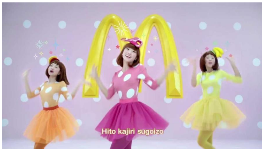
Ilustración 23: Tres chicas cantan para un anuncio japonés de McDonalds.

Sin embargo, no todo son alegres jingles difíciles de olvidar. Tampoco cabe analizar lo que distingue la publicidad japonesa y su uso de elementos musicales sin volver al kokumin-sei , aquel sentimiento de nacionalidad por el que la publicidad puede llegar al consumidor mediante la representación de componentes tradicionales de la cultura japonesa. Anteriormente incluido en la categorización de la publicidad japonesa según su estética debido a su fuerte presencia visual, al kokumin-sei también se puede apelar mediante elementos musicales, al contar Japón con una cultura musical arraigada y fácilmente reconocible. La presencia de música folklórica tradicional en el ámbito publicitario nipón es algo que destacar al poder ser apreciada en la gran mayoría de anuncios en los que el objetivo de comunicación sea apelar al sentimiento nacional japonés, aunque bien es cierto que aquí esta pasa a ser un elemento secundario que acompaña el resto del anuncio.