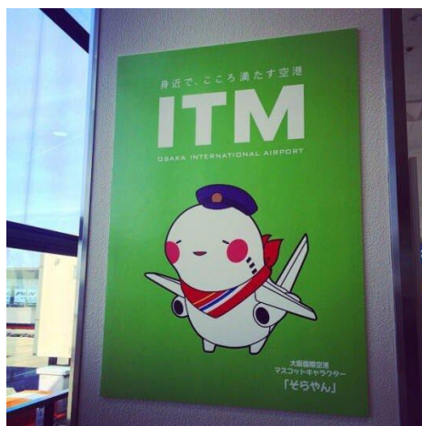
Ilustración 12: Sorayan, la mascota oficial del Aeropuerto Internacional de Osaka

La enorme influencia que tienen estos personajes es algo que destacar, puesto que los podemos ver en contextos en los que fuera Japón resultaría fuera de lugar. Por ejemplo, en Occidente nos resultaría extraño ver como un aeropuerto se promociona con una mascota de dibujos animados de aspecto infantil, pero en Japón es algo que se considera normal por la relevancia que tiene lo kawaii en su sociedad. Existen casos que nosotros consideraríamos más extremos en los que se ha usado esta estética en publicidad japonesa gubernamental o incluso militar.