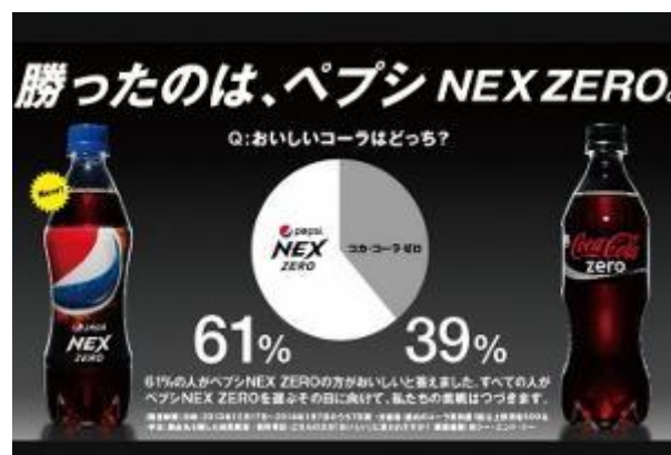
Ilustración 9: Ejemplo de publicidad japonesa hard-sell en la que Pepsi compara su nueva Pepsi Nex Zero con Coca Cola Zero.

Aunque escaso, en Japón este tipo de publicidad también es un caso diferenciado del resto del mundo, ya que se trata de un hard-sell light -por denominarlo de alguna manera- más indirecto y menos ofensivo. Los pocos casos que se pueden apreciar en la publicidad de Japón suelen ser comparativos, y aun así tienden a ser comparaciones sutiles en las que ante todo se respeta el nombre de la competencia y se le pide al consumidor en un tono normalmente gentil y afable que compare por él mismo características demostrables del producto.