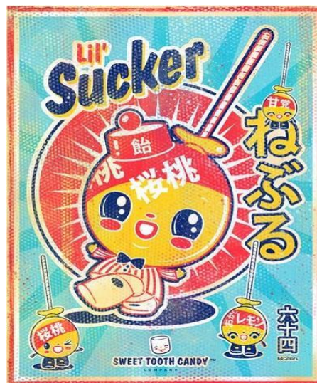
Ilustración 7: Imagen de un anuncio de caramelos japoneses

japonesa, por lo que supone un concepto relativamente nuevo, aunque no por eso carece de relevancia, ya que lo kawaii ha pasado a ser parte de la identidad nacional del país de Japón. Se vincula a un considerable abanico de elementos de la sociedad japonesa actual, así como a varios ámbitos artísticos, ya estemos hablando de música, moda, cómic o arte. Por supuesto, las industrias de la comunicación y el entretenimiento tampoco se libran de la influencia kawaii , puesto que estamos hablando de un concepto que se encuentra fuertemente integrado en lo comercial. A la hora de diseñar marcas, mascotas o piezas publicitarias, no es de extrañar que este concepto tenga una fuerte presencia.