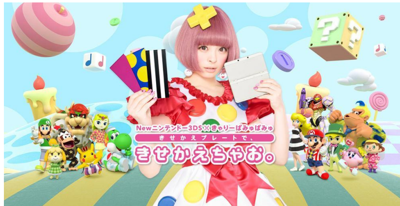
Ilustración 13: Idol japonesa anuncia la nueva Nintendo 3DS.

Por supuesto, esto no se limita a mascotas corporativas en cuanto a publicidad se refiere, ya que también podemos apreciar características propias de la estética kawaii aplicadas de otras formas al ámbito publicitario. Otro caso que destacar es el de la representación de chicas jóvenes de aspecto llamativo en la publicidad japonesa.