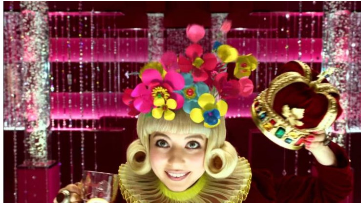
Ilustración 14: Imagen de un anuncio japonés de soda.

No hay duda de que nos encontramos con un ejemplo más de la proyección de la cultura de un país a través de su publicidad, puesto que anuncios que presenten estas características visuales concretas rara vez los encontraremos fuera de Japón sin que nos resulten fuera de lugar. La estética kawaii ha pasado a ser uno de los elementos que más definen la identidad visual de la publicidad japonesa, siendo totalmente inconfundible al estar única y totalmente arraigada en el Japón del siglo XXI y en su cultura popular.