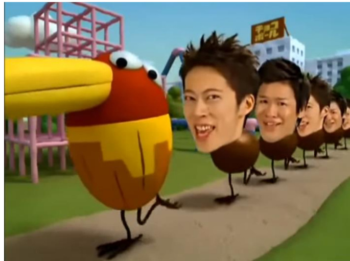
Ilustración 24: Anuncio japonés de nueces cubiertas de chocolate.

Una característica concreta mediante la cual podemos distinguir el humor absurdo de la publicidad japonesa es el uso de elementos que destacan en un contexto relativamente normal y realista. En anuncios japoneses a menudo podemos ver situaciones cotidianas que a primera vista resultan aburridas, pero que contienen un solo componente que destaca de manera sorprendente por su extravagancia. Normalmente estos elementos aparecen de manera inesperada, siendo el repentino contraste entre lo mundano y lo absurdo lo que otorga el tono humorístico. Un ejemplo sería un anuncio en el que aparece una reunión de apagados oficinistas, de entre los que de repente aparece del bolsillo de uno de ellos un sonriente gato gigante para repartir felicidad –siendo esta felicidad el producto a anunciar–.