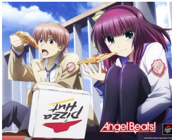
Ilustración 18: Pizza Hut se publicita haciendo uso de personajes anime.

surrealista- y colores vivos que contribuyen a la estética tan llamativa que tanto caracteriza al anime.