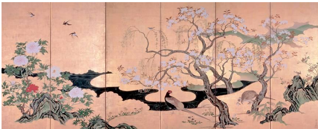
Ilustración 6: Pájaros y flores de primavera y verano

Por otro lado, del sintoísmo se toma prestada la importancia de la naturaleza y del paisaje, algo fuertemente relacionado no solo con esta belleza de lo efímero, ya que en la naturaleza se aprecia fácilmente el paso del tiempo, sino con otros