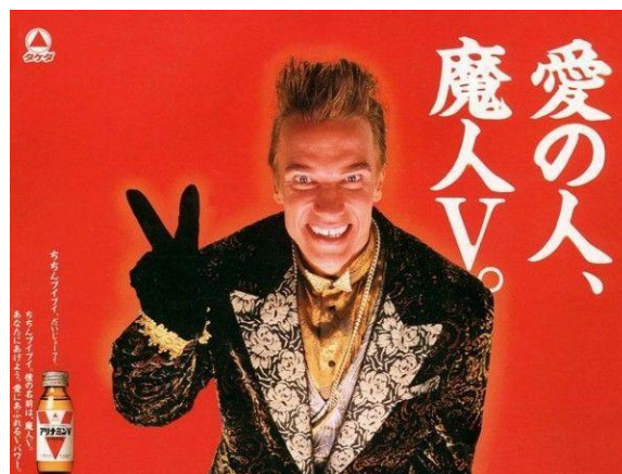
Ilustración 3: Anuncio japonés protagonizado por Arnold Schwarzenegger.

Como es de esperar, con estos cambios vinieron nuevas tendencias y teorías publicitarias con las que la publicidad experimentaría un punto clave de inflexión, adaptándose a las nuevas demandas del sector. Se comienzan a usar elementos hasta ahora fuera de lo común como personajes animados coloridos, música estridente o efectos digitales. Poco a poco, la publicidad informativa enfocada a factores como el precio o las características del producto va siendo sustituida por la emocional, la cual va más allá de la venta directa y busca provocar una reacción en el espectador. Un ejemplo de esto es el comienzo del uso de celebridades en los anuncios japoneses, entre las cuales se encontraban actores occidentales de reconocimiento mundial.