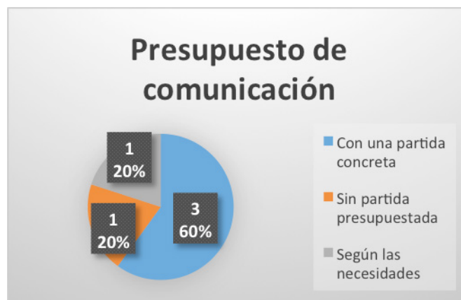
Figura 3. Presupuesto de comunicación

También puede estudiarse la presencia de partidas tiene una cantidad definida, y Monachil, a pesar de no presupuestarias que, en este caso, no coincide con la contar con gabinete, sí que tiene fijada una partida. presencia de gabinetes: Maracena, con gabinete, no Se muestra en la Figura 3.