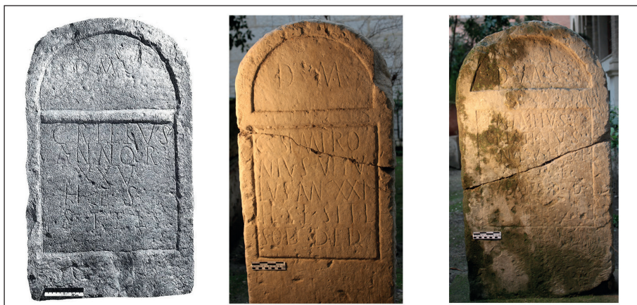
Figura 3. Similitud formal de las inscripciones. La situada a la izquierda proviene de Salaria (Úbeda), las dos restantes mencionan a sodales y proceden de la comarca de Cazorla. (Fotos izq. González y Mangas 1991: lám. 243; resto fotografía del autor).

mismos rasgos internos y externos, repartidas por esta área geográfica y la cercana colonia Salaria (Úbeda, Jaén).