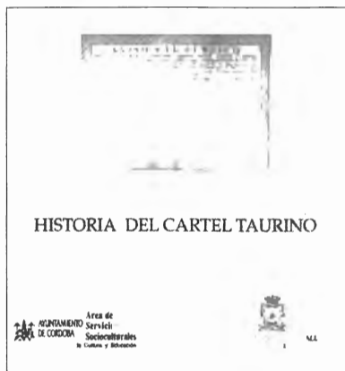
Fig. nº 49.— Portada del Catálogo de la Exposición Historia del Cartel Taurino procedente del Museo Taurino de Córdoba y celebrada en la Sala de Exposiciones de la Plaza de Toros de la Maestranza de Sevilla. Se reproduce el cartel más antiguo de Córdoba en el que se lidiaron, en la plaza de la corredera, reses de Utrera por los diestros Pedro Romero, Pepe-Yllo y Antonio Romero (Apud.: Portillo, s. f.).

Rafael Portillo Martín Director del Museo Taurino de Córdoba