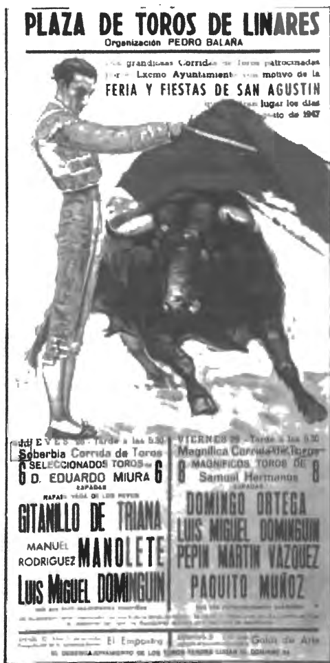
Fig. nº 53.— Cartel de las corridas celebrada en Córdoba con motivo de la Feria de San Agustín de Linares (Jaén) los días 28 y 29 de agosto de 1947 (Apud.: Portillo, s. f.: 17).