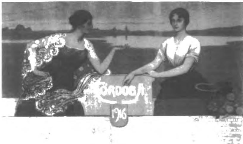
Fig. nº 51.— Cartel de las corridas celebrada en Córdoba con motivo de la Feria de Nuestra Señora de la Salud de 1916 a partir de un boceto de J. Romero de Torres (Apud.: Portillo, s. f.: 14).

La iconografía de lo taurino ya había conocido, desde el caballete del artista, una rica historia. En el siglo XIX y de la mano de la literatura de los viajeros del romanticismo, se