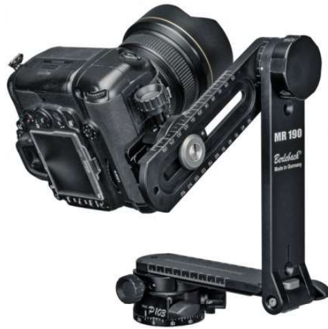
Figura 1. Cámara réflex sobre rótula nodal