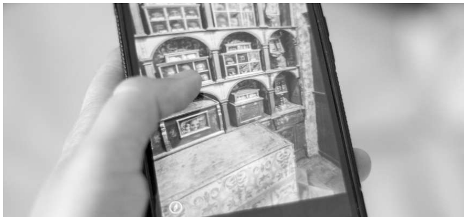
Figura 3. Panorámica 360° visualizada a través de un dispositivo móvil.

Para que el software la interprete correctamente, la imagen panorámica en 2D debe tener el doble de ancho que de alto.