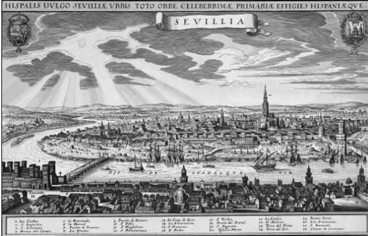
Figura 5. Vista de Sevilla. Mathäus Merian (ed. y grab.), 1638.

También deben mencionarse dos vistas anónimas realizadas al óleo y datadas hacia mediados del XVII, sobre el sector norte, hacia el arrabal de la Macarena, con el hospital de la Sangre como protagonista (Cabra Loredó y Santiago Páez, 1988, pp. 195-199).