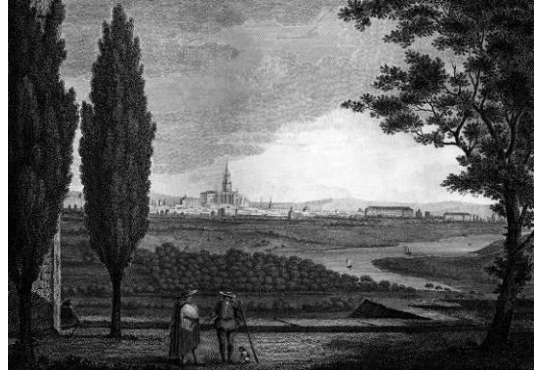
Figura 9. Vista de Sevilla desde San Juan de Aznalfarache, Henry Swinburne (dib.), 1775-1776.

entorno del antiguo castillo de San Juan de Aznalfarache, reflejando el paisaje de la vega de Triana y el Guadalquivir. Al fondo se perfila la ciudad, identificándose la torre del Oro, la muralla y dos volúmenes, que corresponderían con el colegio de San Telmo y la nueva Real Fábrica de Tabacos.