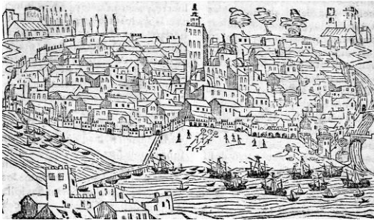
Figura 1. Vista de Sevilla. Pedro de Medina (grab.), 1548.

publicación del humanista y cosmógrafo sevillano Pedro de Medina (1493-1567), con diversas reediciones posteriores (Medina, 1548). Tiene un carácter muy esquemático y aunque se reconocen algunas edificaciones, apenas aporta datos significativos sobre su entorno extramuros (Fig. 1). Por entonces hubo algunas otras vistas bastante idealizadas y también con un valor documental muy limitado (Cabra Loredo y Santiago Páez, 1988).