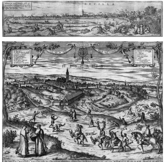
Figura 2a y 2b. Vistas de Sevilla. Joris Hoefnagel. Publicadas en 1572 (arriba) y 1598 (abajo).

Por otra parte, el pintor Joris Hoefnagel (1542-1601) sería autor de dos vistas de Sevilla durante su viaje por la península Ibérica hacia 1563-1567. Se incluyeron en una monumental publicación con seis tomos y más de quinientas vistas de ciudades, conocida como Civitates Orbis Terrarum (1572-1617), promovida por George Braun y Frans Hogenberg (Gámiz Gordo, 2011). La panorámica de Sevilla incluida en el tomo I (Braun y Hogenberg, 1572) (Fig. 2a) comparte lámina con Cádiz y Málaga. Fue tomada desde Chapina, en la Enramadilla de Triana y cerca del monasterio de la Cartuja, con el Guadalquivir y un gran banco de arena o alfaque en primer plano. Comenzando por la derecha aparece Triana con las almonas o “jabonería”, el castillo de San Jorge o de la Inquisición envuelto en llamas, incluyéndose también el rótulo “alfarería”. Al fondo y detrás del puente de barcas se representó el puerto con numerosos navíos atracados y la ermita de San Telmo. A continuación se contempla el Arenal con la torre del Oro y la de la Plata, el muelle, la grúa y las Atarazanas. Tras los arrabales de la Carretería y la Cestería se extiende la muralla con varios torreones hasta la puerta de Goles. Junto a ella se alza la casa de Hernando Colón y sus célebres huertas, el arrabal de los Humeros y continúa la muralla. Al otro lado del río el monasterio de la Cartuja o de Santa María de las Cuevas aparece mal rotulado como San Jerónimo.