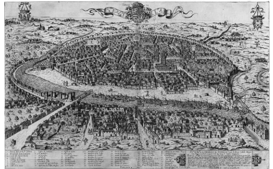
Figura 3. Vista de Sevilla. Ambrosius Brambilla (grab.) 1585.

Todas estas vistas simbolizan el esplendor de la ciudad tras el Descubrimiento de América, que propició un floreciente comercio y un notable incremento de su población (Morales Padrón, 1977) con el puerto como emblema representativo de su paisaje urbano.