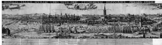
Figura 4. Vista de Sevilla. Joannes Janssonius (ed.), 1617.

Dicha imagen pudo servir de inspiración a otra bastante importante, incluida en la obra Neuwe Archontologia Cosmica (Fig. 5) realizada en 1638 por el grabador y editor suizo Mathäus Merian (1593-1650) (Carrete Parrondo, Vega y Solache, 1996, pp. 126-127) que tuvo gran difusión y fue objeto de plagios hasta el siglo XIX (Oliver Carlos y Pleguezuelo Hernández, 2002, pp. 32-37). Entre ellos cabe destacar un célebre óleo del Museo de América de Madrid, otro de la Fundación Focus de Sevilla, y uno de inferior calidad procedente del Museo del Prado, todos ellos de gran formato.