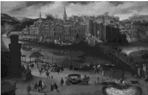
Figura 8. Vista de Triana desde el Arenal. Anónimo, h. 1730-1740.