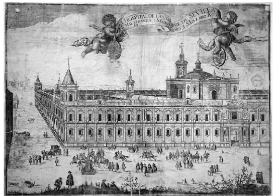
Figuras 7a, 7b y 7c. Vistas de Sevilla. Pedro Tortolero (dib. y grab.) 1748 (arriba) y 1738.