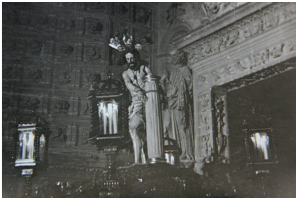
3. Primera salida procesional del Cristo atado a la columna, Miércoles Santo de 1960.