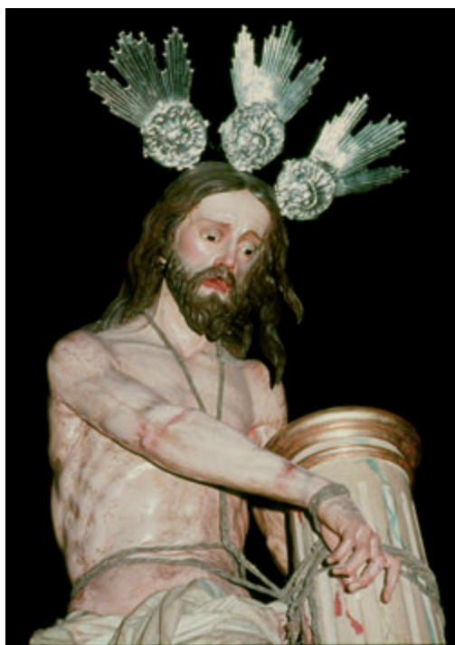
4. Cristo atado a la columna, Semana Santa de 1982.