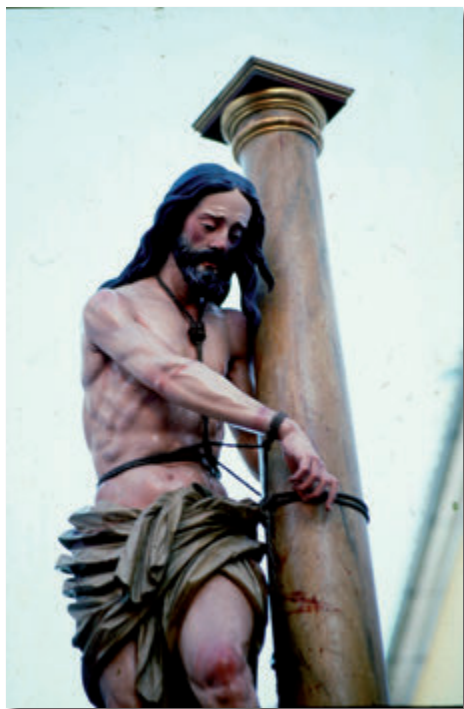
9. Cristo de los Aceituneros. Miércoles Santo de 1984.