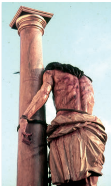
7. Cristo de los Aceituneros, Miércoles Santo de 1983.