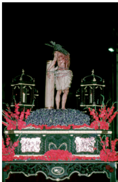
6. Paso de Cristo de la Hermandad de los Aceituneros, Semana Santa de 1982.