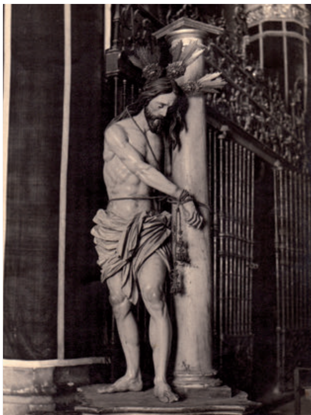
2. Cristo atado a la columna en el coro de Santa María de Utrera hacia 1959.