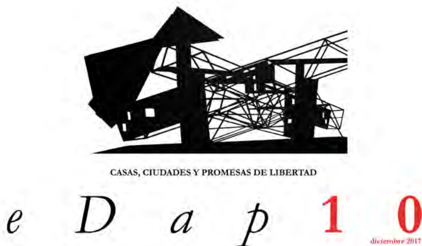
Fig. 3. Portada del próximo número -en construcción-

Archivos de eDap de la revista. El elenco de autores que aparecen en los números editados atestiguan el trabajo editorial realizado, son ellos el mayor patrimonio que hemos podido alcanzar.