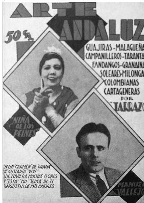
Cancionero de la niña de los peines

10. Finalmente, y respecto a los documentos gráficos , la Documentación Técnica exige registros fotográficos realizados por el documentalista para Bienes Muebles, Inmuebles y Actividades de Interés Etnológico. En el flamenco convendría ampliar el material también para la información sonora y en movimiento, con registros visuales y de sonido, y, sobre todo, hacer acopio del material visual de este signo ya existente, como patrimonio mueble y documental de tipo etnográfico.