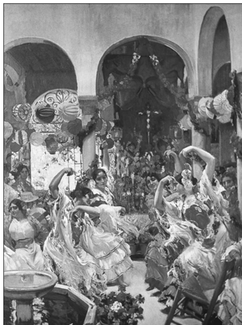
Dos entornos de sociabilidad flamenca rural y urbana tradicionales: ventas y patios de vecindad