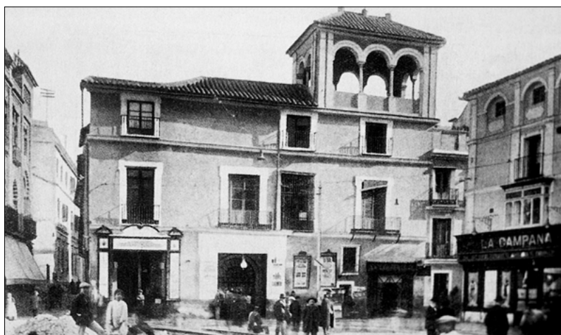
Café Novedades, destruido para el ensanche del entorno de La Campana (Sevilla)

6. Resulta más que discutible la incorporación de un apartado de datos histórico-artísticos , "estilos" o "autores", en espacios y lugares asociados al flamenco que radican en parajes naturales -caso de ciertas romerías o fiestas- o en construcciones que tal vez no tengan demasiado interés desde un punto de vista estético o técnico. Una taberna, por ejemplo, alguna determinada casa de vecindad, el barrio de Santiago de Jerez,... lugares que bien podrían tildarse de Interés Etnológico desde el punto de vista flamenco, pueden tener bastante poco que ver con una idea de "arte culto" que contrasta con el modelo de arquitectura popular que les caracteriza. Nos parece mucho más interesante que la Ley 1/1991 otorgue importancia a delimitar " los elementos tipológicos básicos de la construcción, y la estructura o morfología urbana que deben ser objeto de potenciación o conservación " (art. 30 y ss.). El desarrollo del Reglamento, en este sentido, supone una advertencia muy adecuada para la consideración de los inmuebles como formas de concebir el espacio, definidas socialmente. Esa definición social es una de las pocas tablas de salvación que restan al "flamenco de uso" en Andalucía, que se facilita precisamente por la existencia de tramas espaciales donde se hace favorable el rito.