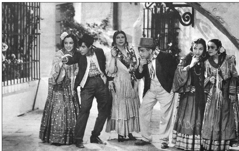
Cine flamenquista –"La Marquesona"– con Pastora Imperio

c) Espacios, prácticas y rituales de expresión flamenca , según las tipologías de Monumentos y Lugares y la categoría de Actividades de Interés Etnológico. Metodológicamente, cabe clasificar las prácticas flamencas según el nivel de institucionalización y formalización, el grado de participación y los vínculos entre las partes que las integran y la distinción entre lo que denominaremos el valor de uso de la expresión flamenca, y su valor de cambio, una vez que ésta se convierte en mercancía. Respecto a rituales y prácticas "de uso", el flamenco se desarrolla en fiestas con ocasión de ritos de paso (bautizos, bodas, y hasta comuniones y cumpleaños), lugares de sociabilidad informal (tabernas, tabancos, ventas, plazas, cuartos de cabales, vecindades, patios de vecinos, puertas de las casas), acontecimientos festivos (ferias, romerías, carnavales), ámbitos laborales (gañanías, cortijos, minas, fraguas) y todo lo que representa el hábito de "cantar" como costumbre en la vida cotidiana de los andaluces. En lo segundo, el flamenco comercial, determinadas formas de representación pueden ser acogidas en el campo patrimonial por su trayectoria histórica (algunos tablaos, festivales flamencos), por su singularidad (Bienal de Flamenco, Festival de Música y Danza de Granada, Concurso de Córdoba) o por su contenido societario (recitales en las peñas flamencas, ciertos espectáculos locales).