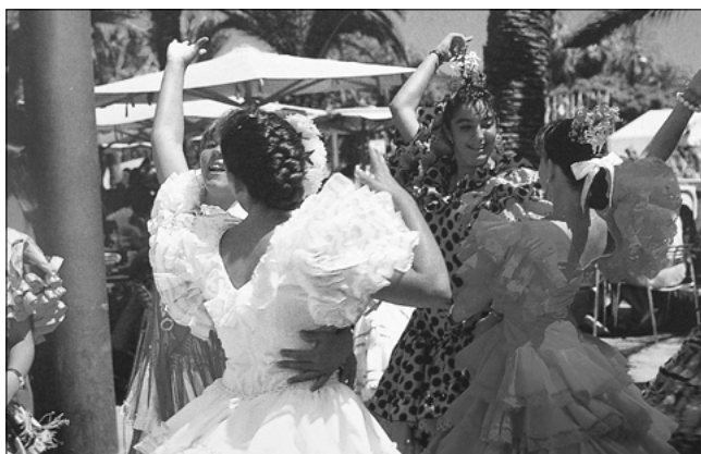
Baile por sevillanas actual

El 3 de Julio de 1999 se publicó en BOJA el Decreto por el que se declaraban Bien de Interés Cultural, con la categoría de Patrimonio Documental, los registros sonoros de la Niña de los Peines radicados en Andalucía. La definitiva publicación en BOE (11 de Agosto de 1999) culminaba el proceso por el cual, por primera vez, se ejecutaba la política andaluza de Bienes Culturales sobre el flamenco, entendido como Patrimonio Cultural en su expresión más estrictamente administrativa.