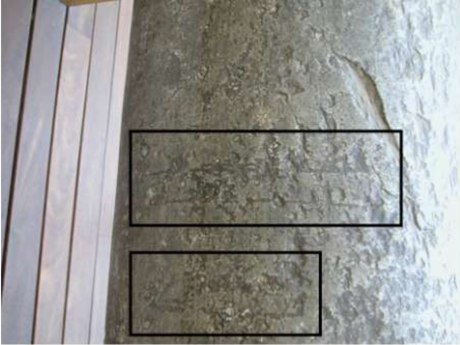
Fig. 5 Dos de las nuevas inscripciones en árabe descubiertas recientemente sobre el fuste fundacional de Adabbás, actualmente en estudio (Foto F. Amores).

A mediados del s. XII, el nuevo poder almohade ejecuta una intensa transformación del urbanismo de la ciudad al desplazar el centro de la vida política y religiosa al Sur, junto a la muralla, en un extremo de la ciudad. Se erige una gran mezquita, moderna y digna de la capital del imperio en Al-Andalus, con una portentosa torre como signo evidente del nuevo poder triunfante. La mezquita de Adabbás quedó relegada a mezquita secundaria, de barrio, pero nadie pudo arrebatarle la primacía simbólica, Omeya, que ostentaba. A este respecto L. Torres Balbás recoge una serie de citas que demuestran la importancia simbólica del edificio: