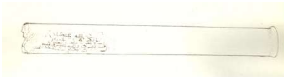
Fig. 7 Dibujo del fuste de Adabbás por José María López (1848)

tendrá una. Se ignora donde haya sido hallada, pero basta para curiosidad una exacta noticia de la situación de esta bella antigüedad. También los moros tenían costumbres abrir inscripciones en las columnas. La de ésta la tiene de lado, infiriéndose que esta columna estaría siempre tendida en donde quiera que sirvió, porque no siendo así, no se podría leer sus caracteres. Pero si fuese dable adivinar para lo que serviría, diría yo que estuvo en alguna de las mezquitas de Sevilla, y quizás en la mayor, que es hoy el sitio que ocupa la Santa iglesia catedral. El verdadero diseño es éste.