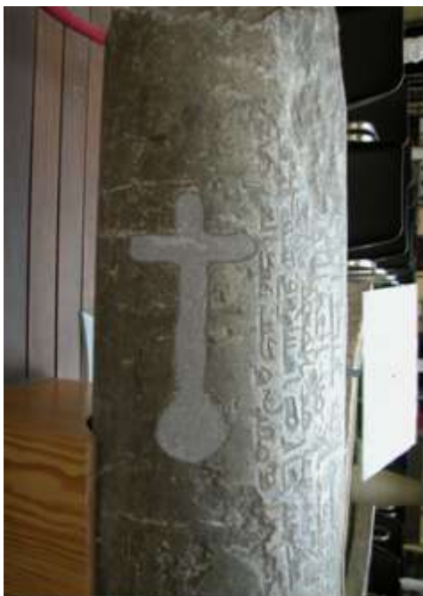
Fig. 6 Cruz sobre orbe en grabado tosco junto a la inscripción fundacional islámica, a la que se adosa.

Por otro lado, recordamos de nuevo la existencia de la cruz patriarcal grabada. No sabemos si se hizo en estos siglos de vieja colegial, como hemos apuntado, por la pretensión de otorgar un rango de primacía a la colegial