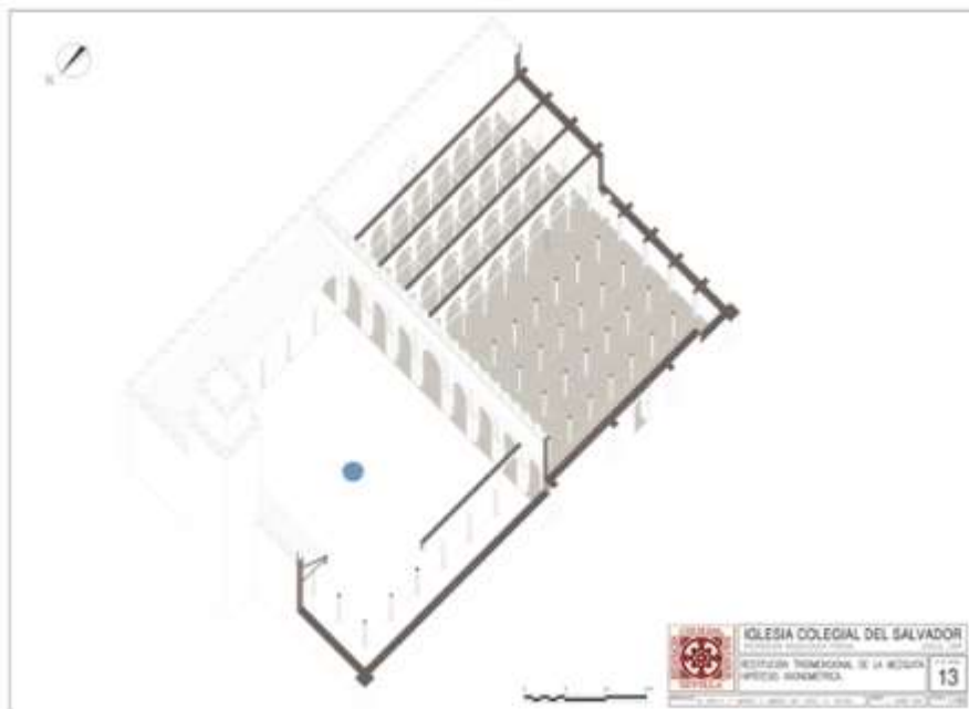
Fig. 4 Restitución axonométrica de la mezquita de Ibn Adabbás (dibujo de L. Núñez Arce).

Se trata de una cita extraña y única en las descripciones de las viejas mezquitas, quizás relacionada con la rareza de este tipo de soluciones epigráficas en la tradición musulmana o con el privilegio que suponía certificar su antigüedad.