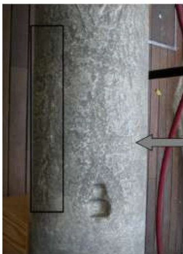
Fig. 3 Cruz patriarcal en grabado tosco -¿visigoda?- que presenta el fuste romano usado como soporte de la inscripción fundacional de la mezquita de Adabbás. La base engloba a dos oquedades yuxtapuestas que pudieron ser realizadas en origen para fijar una cancela y, posteriormente, para acoger una reliquia. A la izquierda de la cruz, en recuadro y sin superposición alguna, se advierte parte de una inscripción árabe inédita en un picado muy basto.

La famosa columna fundacional de Adabbás dispone de más información de la que se ha creído hasta ahora. A media altura se distingue una cruz patriarcal, de doble travesaño, en diseño tosco mediante grabado piqueteado (fig. 3). La base de la cruz engloba a dos huecos realizados sobre la columna, rectangulares y unidos, relacionables en origen con la huella de la fijación de una cancela o puerta asociada al fuste en época romana. Lo rodea en forma de bola y la cruz se desarrolla en vertical, aunque de factura y diseño torpes. Este tipo de trabajo se puede adscribir a momentos tardoantiguos o visigodos aunque no de forma excluyente.