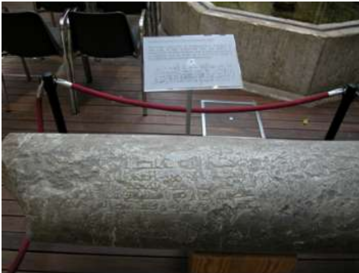
Fig. 2 Inscripción fundacional de Adabbás, 829 d.C. (214 h.) en la parte superior del fuste

También se tiene en respeto la torre de la iglesia Colegiata de San Salvador, porque se edificó de las mismas piedras.