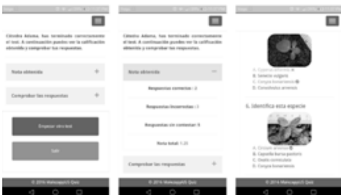
Figura 4. Pantalla final de preguntas y respuestas: (izquierda) ventana resumen; (central) resumen de calificación final; y (derecha) comprobación de respuestas.