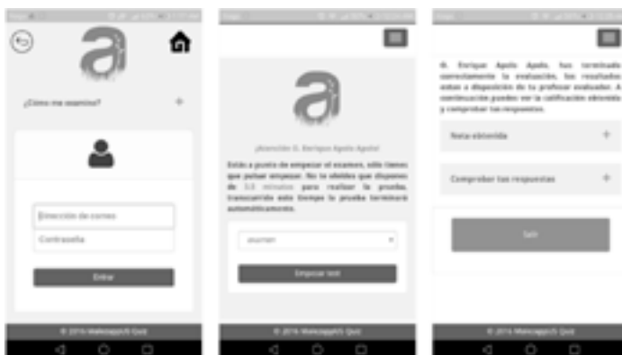
Figura 3. Pantalla módulo alumnos: (izquierda) pantalla de acceso; (central) instrucciones del examen; y (derecha) pantalla final.