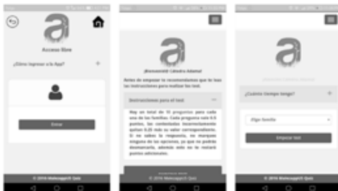
Figura 1. Pantallas del módulo libre: (izquierda) pantalla de ingreso a la app; (centro) se muestran las instrucciones para realizar el test; y (derecha) elección de la familia.

El módulo libre que está diseñado para el uso de la aplicación en modo lúdico, de forma que no es necesario registrarse y el usuario accede a cuestionarios de 10 preguntas que puede repetir ilimitadamente (Fig. 1).