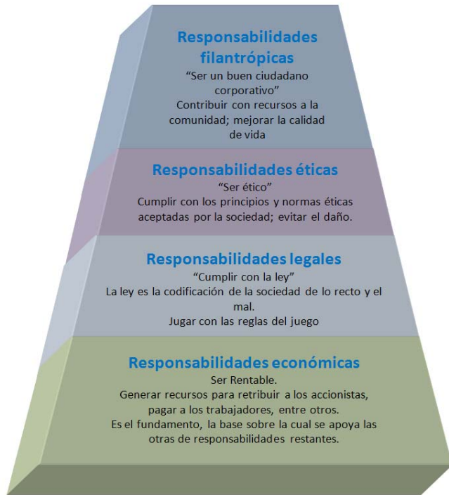
Pirámide de la responsabilidad social corporativa de Carroll

Aupperle, Carroll y Hatfield (1985) establecieron una dicotomía entre el componente económico descrito como "preocupación por el performance económico" y los tres componentes no-económicos (legal, ético, y discrecional) denotados como "preocupación por la sociedad". Consideraban que la orientación social de una organización podía evaluarse de manera apropiada comparando la importancia de los tres componentes no-económicos respecto al componente económico, pues una gran "preocupación por la sociedad", indica una alta orientación de la organización hacia la responsabilidad social.