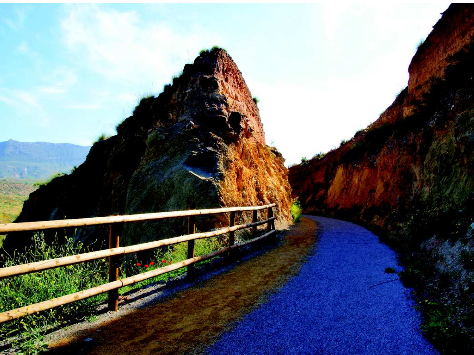
Detalle del trazado de la vía verde