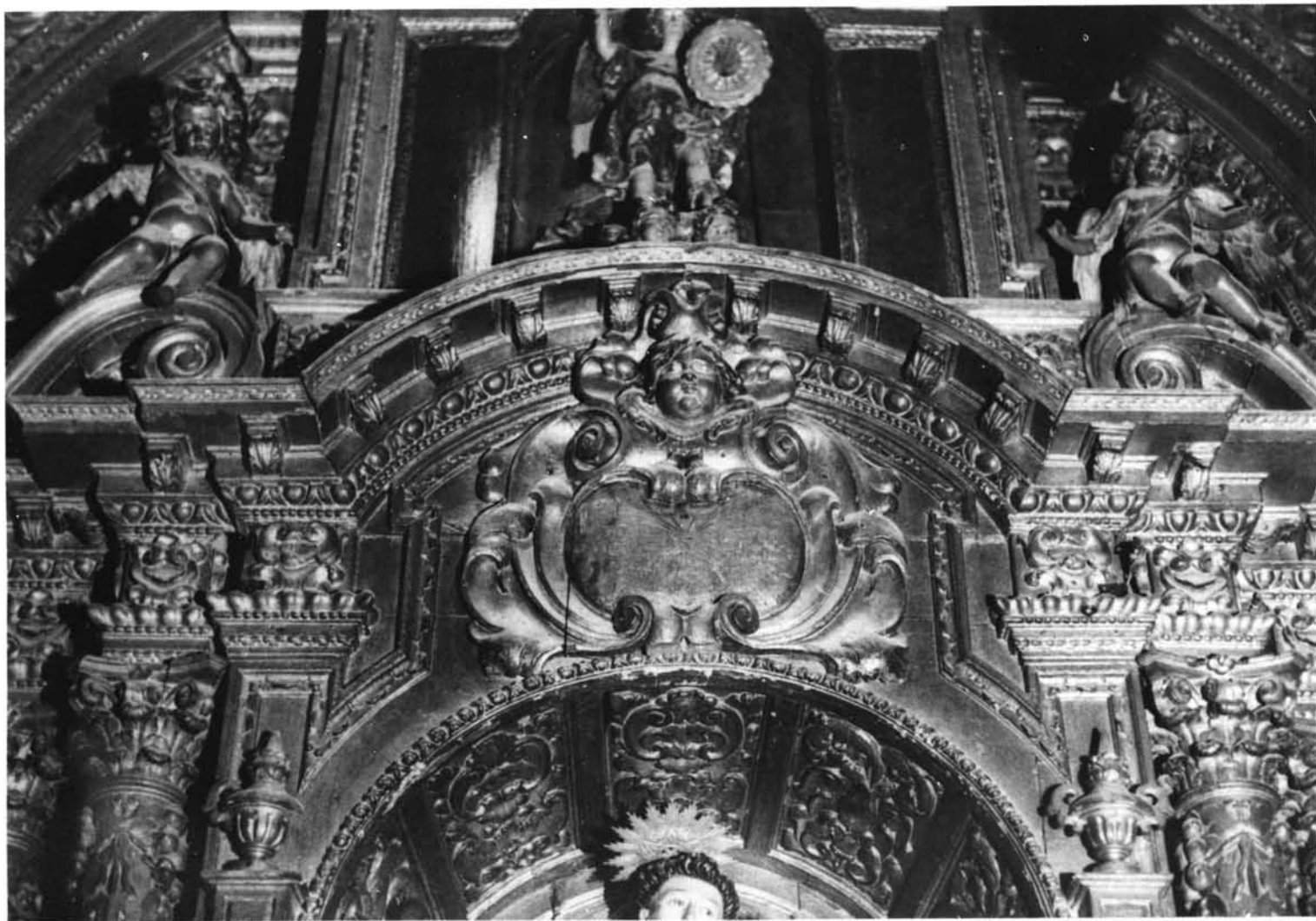
Sarriells. Inscricio del Sagrario. Detalle del retablo de San Antonio, por Bernardo Simón de Pineda.