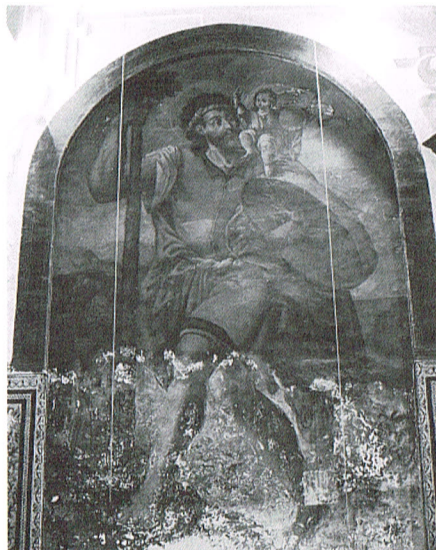
Pintura mural de San Cristobal antes de intervenir

Este artículo pretende ser una llamada de atención hacia la labor del conservador-restaurador, no solo como mero técnico especializado en la salvaguarda del patrimonio (que no es chica tarea), sino por la aportación inestimable que ofrece a la historia a través de la información derivada de cualquier intervención sobre una obra.