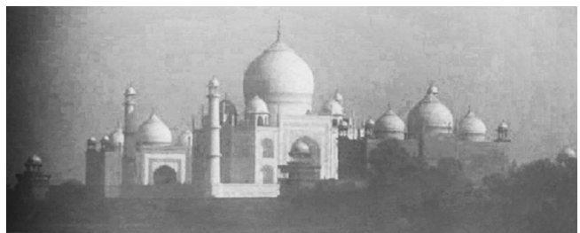
Abbildung 4: Fotogramm „Taj Mahal“

In dieser Szene sehen die beiden Brüder Salim und Jamal zum ersten Mal in ihrem Leben das Taj Mahal. In der englischen Bildbeschreibung wird dieses Gebäude sofort identifiziert (Identifikation) und mit dem Zusatz „majestic white marbled palace“ beschrieben. In der deutschen Hörfilmfassung wird zunächst nur von einem weißen palastartigem Gebäude gesprochen; erst im zweiten Teil der Beschreibung werden die Türme und Kuppeln des Taj Mahal genannt. Das Taj Mahal kann