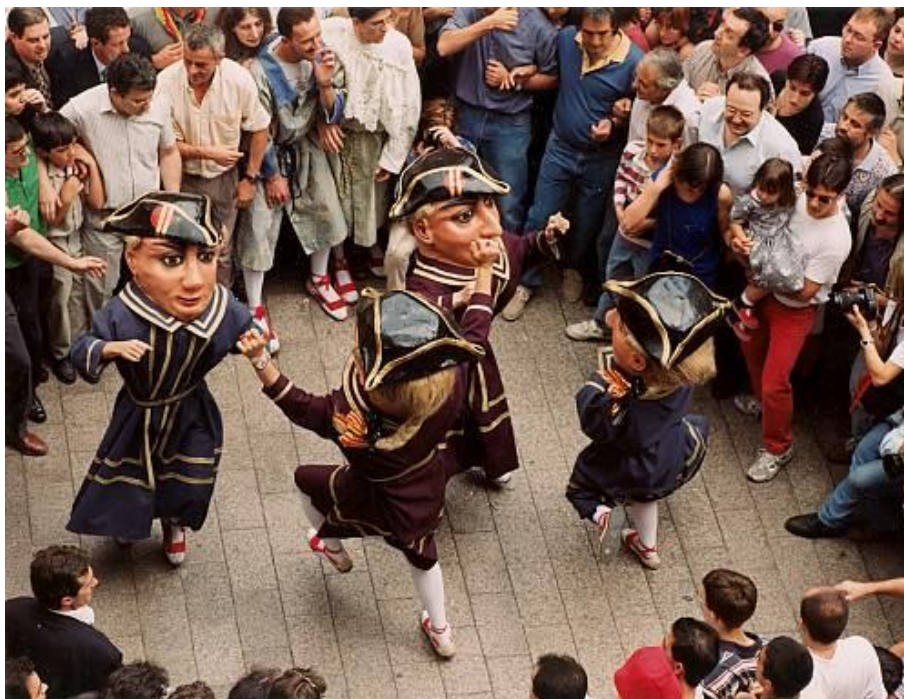
Figura 2.4. La Patum de Berga.