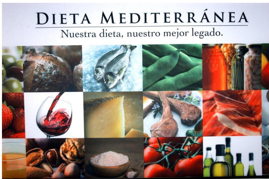
Figura 2.11. Cartel dieta mediterránea

Chipre, Croacia, España, Grecia, Italia, Marruecos y Portugal comparten en la Lista la dieta mediterránea como Patrimonio Cultural Inmaterial de la Humanidad (2013), está compuesto por todas las competencias culinarias, rituales y tradiciones vinculadas al cultivo, pesca, ganadería y al modo de cocinar y consumir los alimentos mediterráneos. Constituye un modo de vida caracterizado por valores como la hospitalidad, creatividad y respeto por la diversidad, transmitido de generación en generación en los países mediterráneos. Comprende también la artesanía y elaboración de recipientes para la conservación y consumo de alimentos (cerámicas, platos y vasos). ( https://ich.unesco.org/es/RL/la-dieta-mediterranea-00884 . Consultado el 29/05/2017).