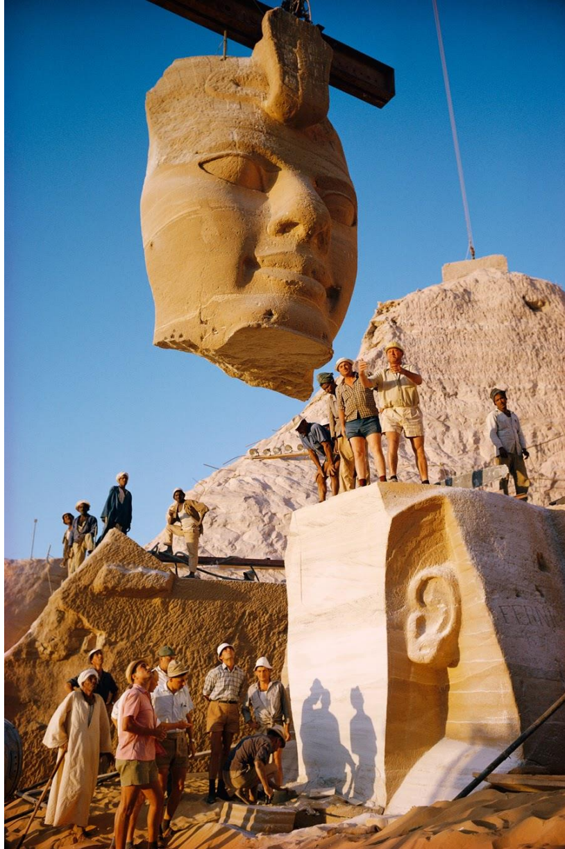
Figura 2.1. Traslado de los Templos de Abu Simbel