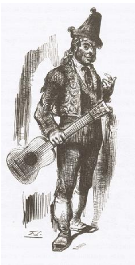
Figura 3.1. Cantao El Planeta

- Etapla inicial o pre-flamenca (desde su origen hasta mediados del s. XIX). De esta primera etapa llamada Hermética por algunos autores existen pocos documentos que ayuden a los flamencólogos a analizar su historia, es a partir del siglo XVIII de donde datan las primeras referencias que nos han llegado, las cuales demuestran que el flamenco se desarrolló en los enclaves de Triana, Cádiz y Jerez. En esta primera fase hay que mencionar a cantaores como El Planeta, el cantao más antiguo del que se tiene evidencia, y su alumno El Fillo, grandes figuras de las seguiriyas y tonás, La Andonda con sus cantes por soleá y Paco la Luz. Para ese entonces el flamenco se limitaba a un ambiente privado y familiar en fiestas particulares., el cantao flamenco pasaba parte de su vida de pueblo en pueblo alegrando las reuniones tanto de jornaleros como de señores con sus cantes, a cambio de comida, cobijo y, en ocasiones, regalos o dinero (Mairena y Molina, 1979).