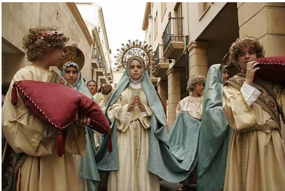
Figura 2.3. El misterio de Elche.

España cuenta con 16 inscripciones en estas listas, 3 en el Registro de buenas prácticas y 13 en la Lista representativa del Patrimonio Cultural Inmaterial. Las dos primeras fueron en 2008, incluyendo el Misterio de Elche 1 y la Patum de Berga 2 . ( https://ich.unesco.org/es/RL/ . Consultada el 27/05/2017).