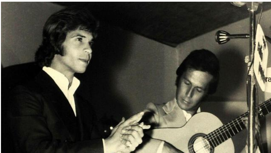
Figura 3.4. Camarón de la Isla y Paco de Lucía en la cata flamenca de Montilla (1971)

Dentro de las cantiñas son las alegrías las más cultivadas en el mundo flamenco, caracterizadas por su “tirititrán” introductorio. Ya en la época de los cafés cantantes de finales del siglo XIX eran bailadas por grandes artistas como Juana la Macarrona, la Mejorana y Gabriela Ortega. Una de las grabaciones de alegrías más lejanas que se conserva data de 1909, cantada por El Pena, tocada por el Hijo del Ciego y bailada por la Macarrona. Otros grandes artistas que interpretaron este género fueron Manolo Caracol, Camarón de la Isla y Paco de Lucía a la guitarra. ( http://www.flamencoviejo.com/alegria.html . Consultado el 08/06/2017).