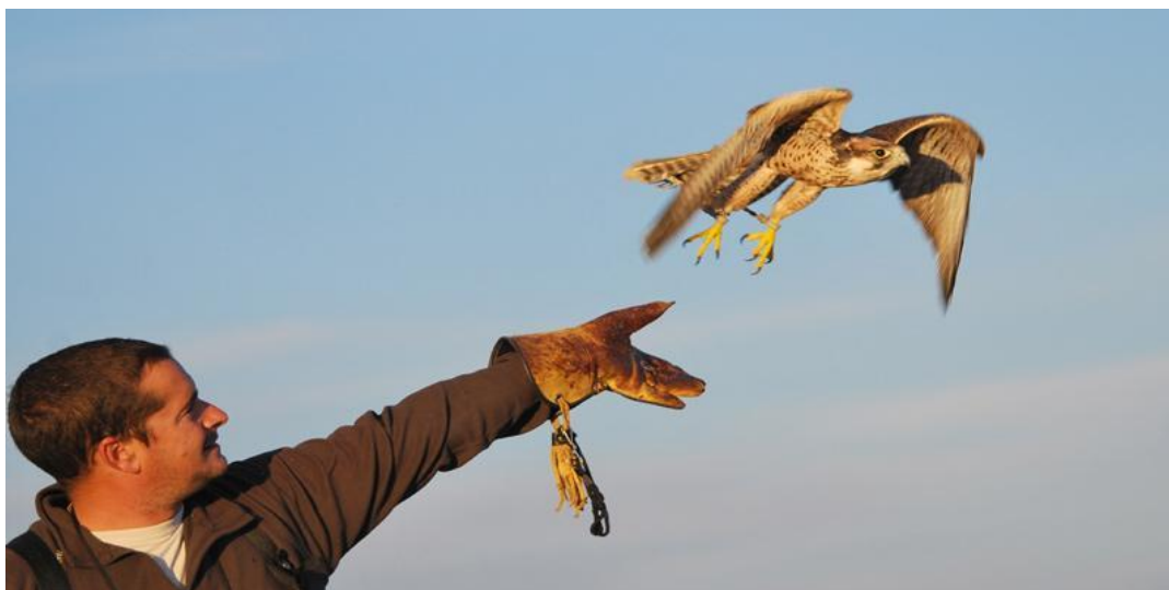
Figura 2.14. Cetrero domando ave rapaz

El último de los bienes declarados Patrimonio Cultural Inmaterial de la Humanidad en España ha sido el arte de la cetrería, así, en 2016 la UNESCO incluyó a la cetrería de nuestro país y de otros tantos 3 en la Lista Representativa de Patrimonio Cultural Inmaterial. Ésta consiste en el arte de domar y cuidar aves de presa con el fin de cazar animales silvestres libres en su medio. Las prácticas y conocimientos llevados a cabo son transmitidos de generación en generación en la comunidad de cetreros. ( http://www.mecd.gob.es/patrimoniocultural/elementos-declarados/internacionales/cetreria.html ). Consultado el 29/05/2017).