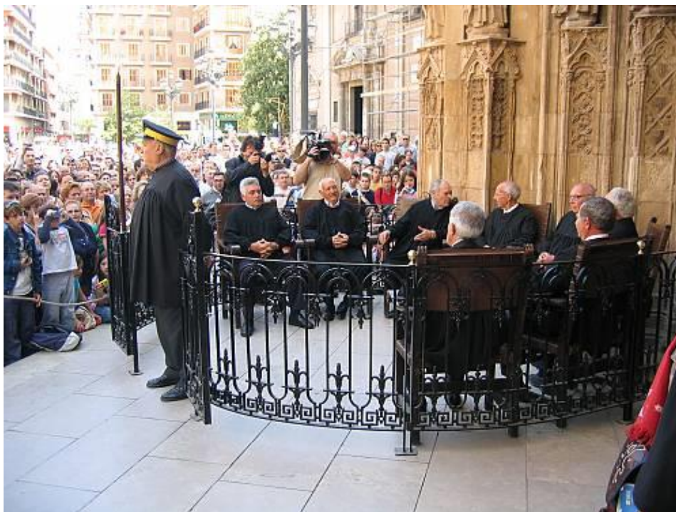
Figura 2.6. Tribunal de las Aguas de la Huerta (Valencia).