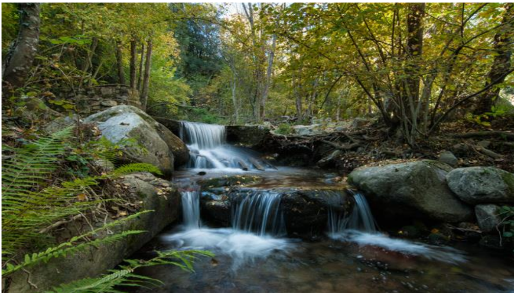
Figura 2.17. Parque Natural del Montseny.