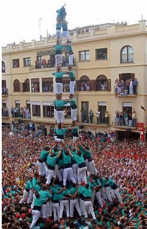
Figura 2.8. Los Castells (Cataluña)

Ese mismo año son declarados Patrimonio Cultural Inmaterial el Flamenco, el cual abordaremos en profundidad en el próximo capítulo, y los Castells. Estos últimos son propios de la región de Cataluña, se trata de torres humanas motivadas por la celebración de festividades anuales en ciertas ciudades y pueblos catalanes que llegan hasta los diez pisos manteniéndose sobre los hombros. ( https://ich.unesco.org/es/RL/los-castells-00364 . Consultado el 28/05/2017).