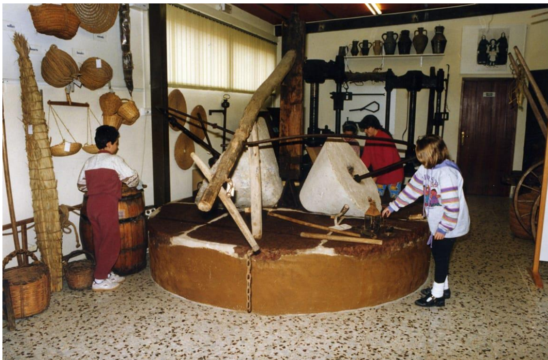
Figura 2.15. Museo escolar de Fusol