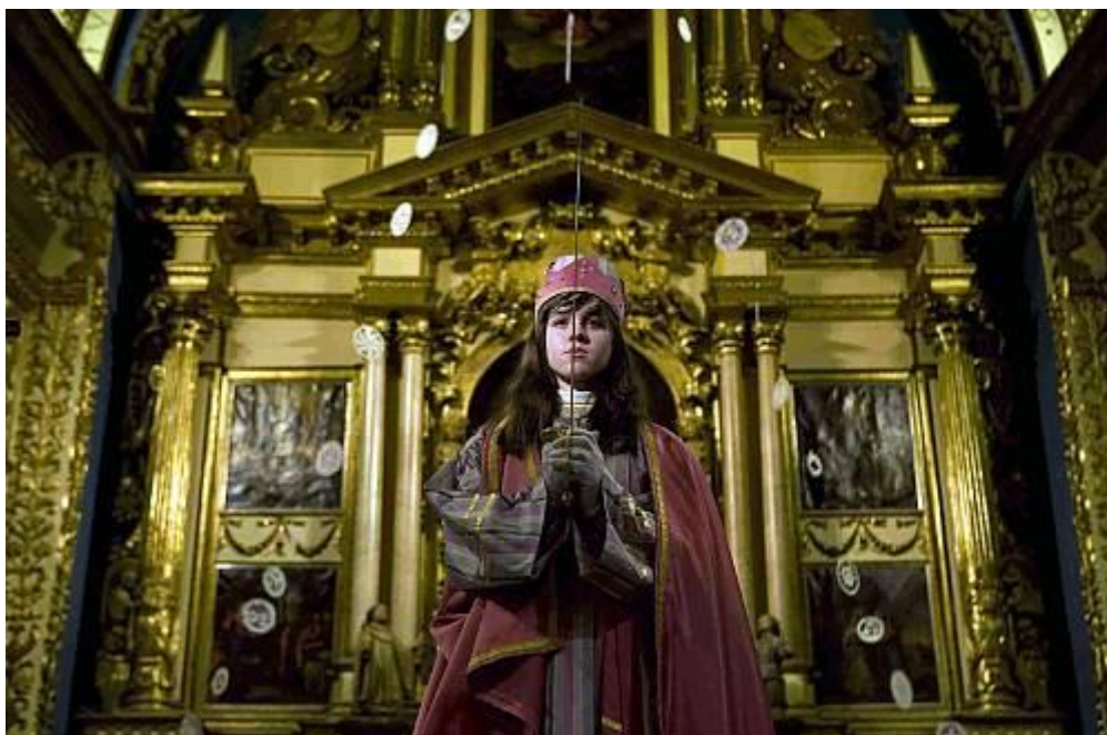
Figura 2.7. El canto de la Sibila (Mallorca).

En el año 2010 se incorporan a esta lista el Canto de la Sibila de Mallorca, se trata de una procesión con canto que se realiza cada noche del 24 de diciembre en las iglesias mallorquinas, tanto la indumentaria como los cantos acompañados de órganos no se alejan de su origen gregoriano. ( https://ich.unesco.org/es/RL/el-canto-de-la-sibila-de-mallorca-00360 . Consultado el 28/05/2017).