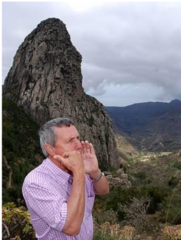
Figura 2.5. El Silbo Gomero

Al año siguiente, se incluyeron en esa misma lista dos más, por un lado, el Silbo Gomero, que se trata de un lenguaje silbado totalmente articulado capaz de reproducir mediante silbidos cualquier mensaje desde grandes distancias, este lenguaje ha sido transmitido a lo largo de los siglos a través de los isleños de la Gomera (Islas Canarias). ( https://ich.unesco.org/es/RL/el-silbo-gomero-lenguaje-silbado-de-la-isla-de-la-gomera-islas-canarias-00172 . Consultada el 27/05/2017).