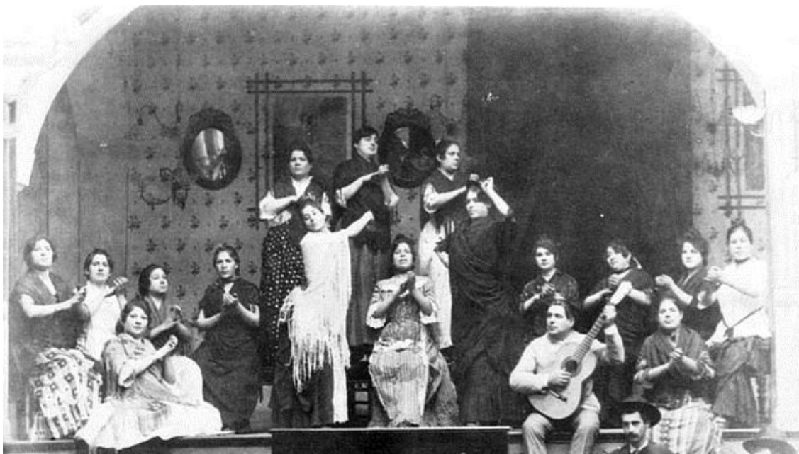
Figura 3.2. Estampa del café cantante el Burrero, C/ Tarifa (Sevilla) finales siglo XIX

El primer café cantante con verdadero éxito fue el creado por Silverio Franconetti en la calle sevillana Rosario, posteriormente se abrieron otros tantos como el “Burrero” en la calle Tarifa inicialmente y luego en la calle Sierpes, o el “Café de San Agustín” en Puerta Carmona. Casi no existía ciudad andaluza que no tuviese sus cafés cantantes. El cuadro flamenco de estos espectáculos se componía generalmente por una guitarra, uno o varios cantaores y tres o cuatro bailaoras y dos bailaores, con fondos decorados con pinturas simulando vistas andaluzas como la Giralda o la Torre del Oro. Gracias a estos cafés cantantes muchos cantes flamencos hasta entonces solo conocidos en un ambiente privado pasaron a darse a conocer públicamente ganando prestigio social (Blas Vega, J., 1987)