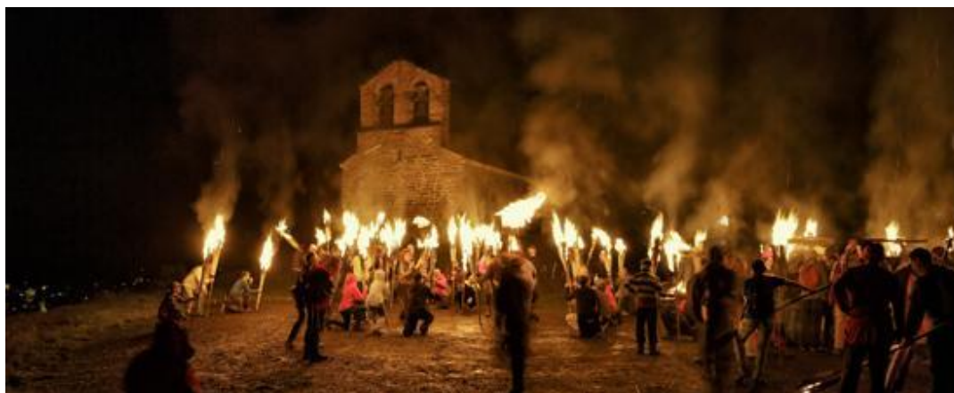
Figura 2.12. Fiestas del fuego del solsticio de verano en los Pirineos. Vall de Boí (Lleida)