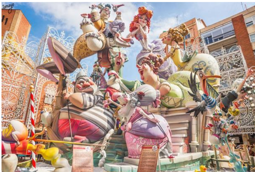
Figura 2.13. Fallas de Valencia (2016)

El primero de éstos es la fiesta tradicional celebrada cada año al llegar la primavera en la región de Valencia, singularizada por la elaboración de grandes conjuntos escultóricos, llamados “fallas”, que se componen por estatuas satíricas (“ninots”) inspiradas en la realidad política y social, a los cuales se les prende fuego el último día del festejo, simbolizando la purificación primaveral. Durante toda la semana se realizan desfiles con bandas musicales y fuegos artificiales, y se elige a una reina de la fiesta reconocida como la “Fallera Mayor”. La última Fiesta de las Fallas celebrada en el mes de marzo del presente año ha sido la primera festejada como Patrimonio Cultural Inmaterial de la Humanidad. ( https://ich.unesco.org/es/RL/la-fiesta-de-las-fallas-de-valencia-00859 . Consultado el 29/05/2017).