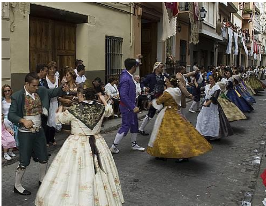
Figura 2.9. Fiesta de “la Mare de Déu de la Salut” de Algemesí (Valencia).