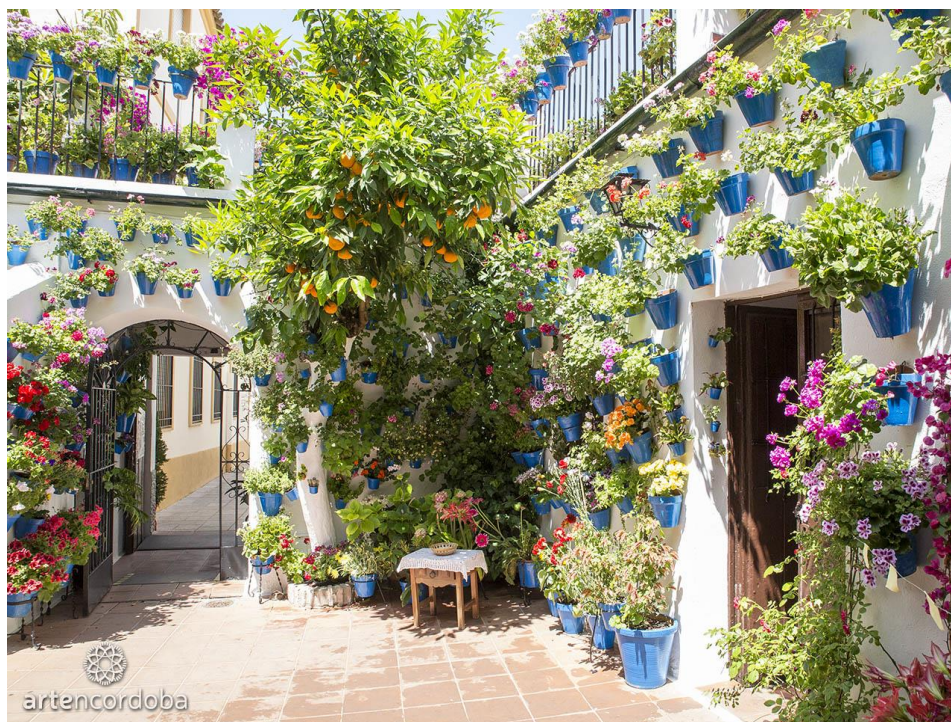
Figura 2.10. Patio de la Calle Tinte, 9 (Córdoba)

Cada mes de mayo tiene lugar en la ciudad de Córdoba la fiesta de los patios, declarada Patrimonio en 2012. Las casas de patio son ornamentadas con una amplia y variada multitud de plantas, dispuestas estéticamente. La fiesta comprende el Concurso de los Patios, donde se otorgan premios a los patios más atractivos en cuanto a vegetación, balcones y rejas; y la Fiesta de los Patios de Córdoba, que consiste en espectáculos con cantos y bailes en los patios más grandes. ( https://ich.unesco.org/es/RL/la-fiesta-de-los-patios-de-cordoba-00846 . Consultado el 28/05/2017).