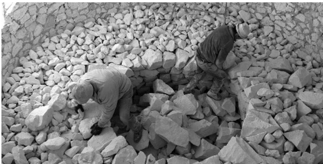
Figura 2.16. Oficio de la cal en Morón de la Frontera (Sevilla)