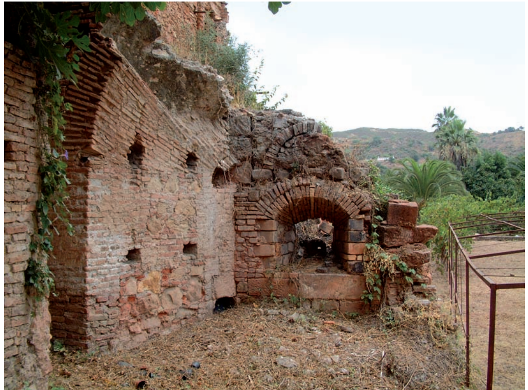
Figura 4. Estado actual.