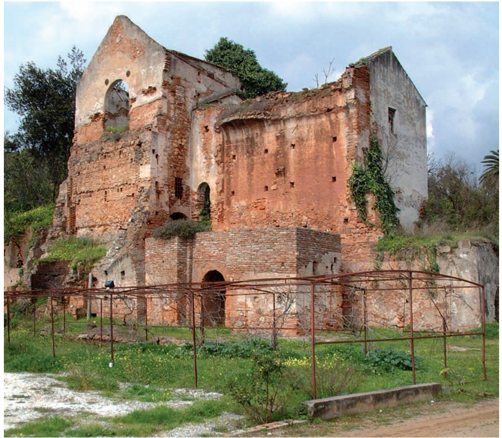
Figura 3. Estado actual.