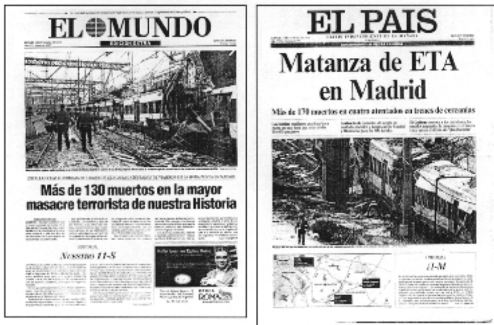
Portada del diario El Mundo y El País del 11-M

Reinhard Gäde sostiene que “para separar o agrupar bloques cabe igualmente alterar el ancho de las columnas del texto continuo o, antes que abusar de filetes y recuadros, aumentar los blancos que las separan” “... El blanco es un elemento configurativo y ordenador de primer orden; no existe mejor recurso que él para guiar el ojo del lector sin imitaciones” 3 .