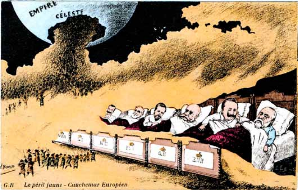
Ilustración 3. Yellow Peril: The European Nightmare. Museo de Bellas Artes, Boston. Por T. Bianco, c. 1900, satirizando el miedo generado por el Káiser Guillermo por la afluencia de obreros chinos a Europa.

electores no diera sino una expresión de disgusto, si detenernos a mirar hacia arriba en el número 725 de la quinta Avenida de Nueva York resultara ridículamente evidente, si la jaula de