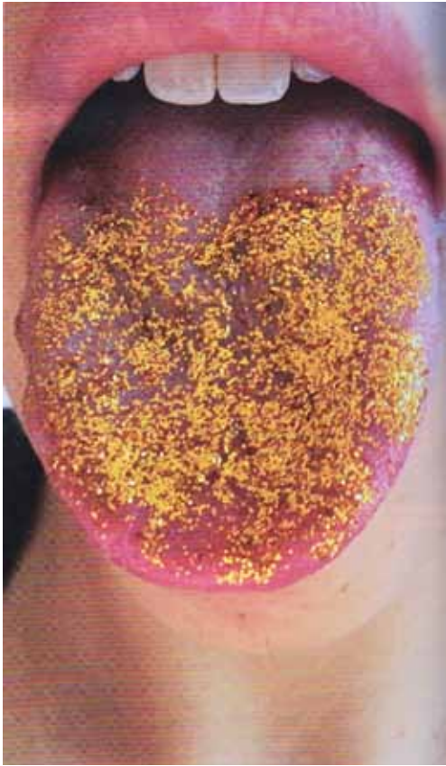
Ilustración 1. Glitter Disaster. Mcewen Studio 2016. Istanbul Design Biennial Are we human?

* Este artículo tiene una versión previa digital más corta (de 30 de marzo de 2017) para la web ARKRIT del grupo de investigación Crítica Arquitectónica de la Escuela Técnica Superior de Arquitectura de Madrid. Ver aquí: https://goo.gl/TjYdoU