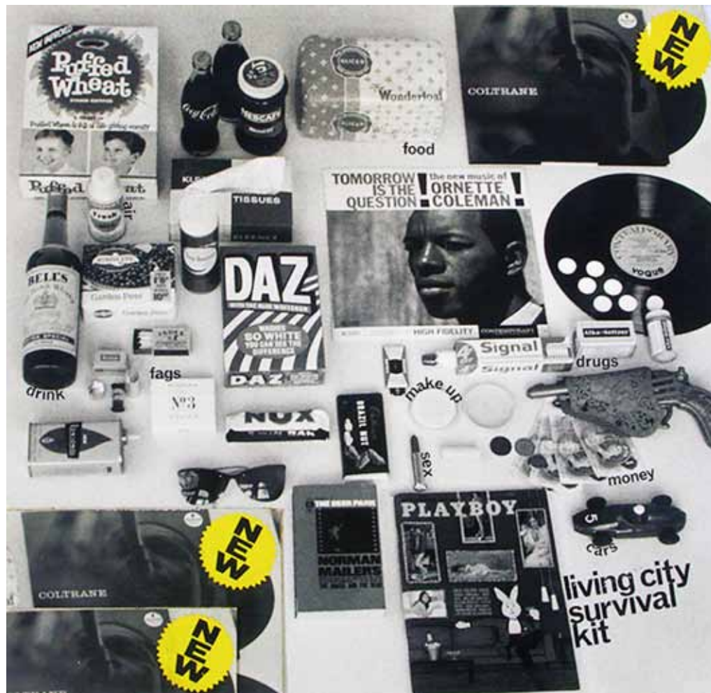
Ilustración 4. Living city survival kit. Archigram (Warren Chalk). 1963. Living Arts Magazine, London's Institute of Contemporary Arts (ICA) y también publicado en Archigram nº 3, agosto de 1963.

13), sólo sustituyendo la filosofía alemana de allí, por la cultura, política y arquitectura norteamericana de hoy: no se dude de que ha intervenido aquí una cierta virtud dormitiva [fuerza dormitiva]: los ociosos nobles, los virtuosos, los místicos, los artistas, los cristianos en sus tres cuartas partes y los oscurantistas políticos de todas las naciones estaban encantados de poseer, gracias