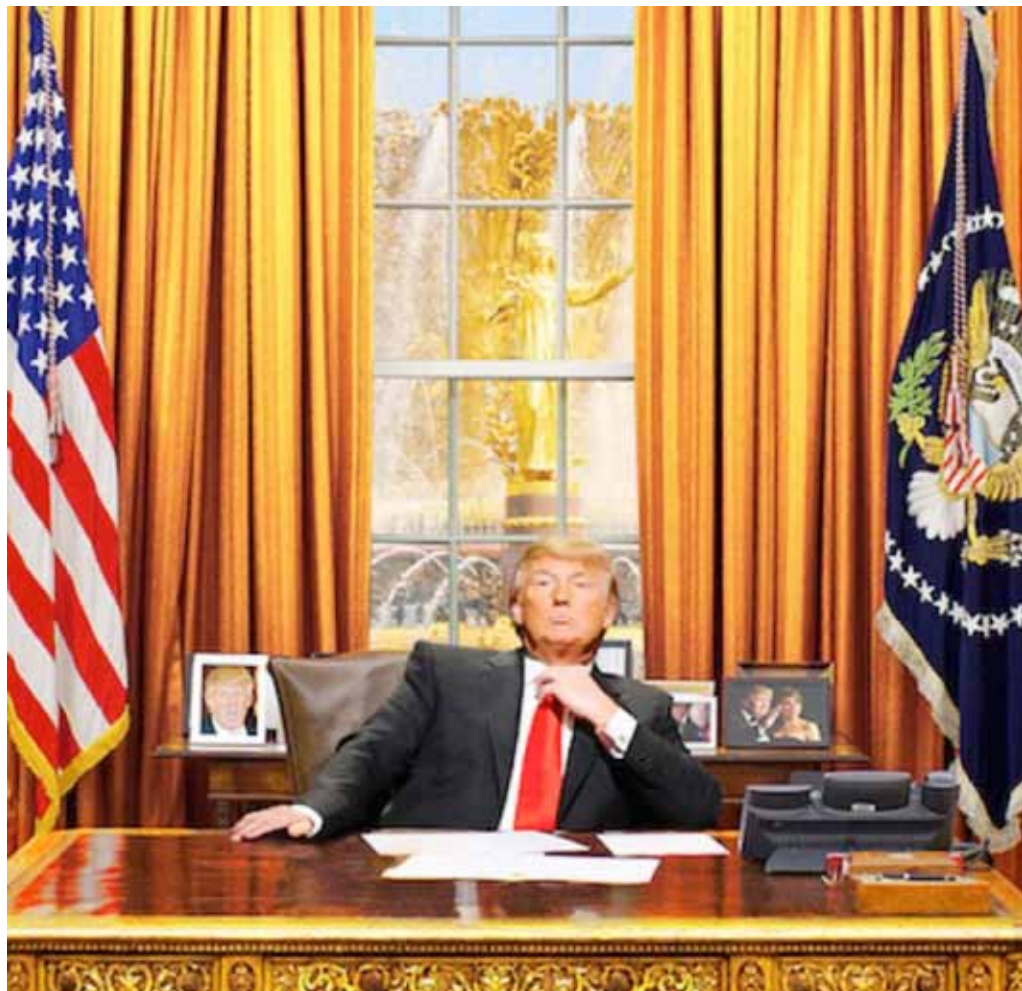
Ilustración 2. Aposento aposemático. El hombre que confundió a su mujer con un drapeado. Blarb. Los Angeles Review of Books.

No obstante, muy probablemente, viendo sus embates con George Bernard Shaw, Chesterton sería capaz de refutar críticamente la cadena de relaciones montadas por mí sobre lo amarillo. Si Shaw se permitía exagerar sus posiciones ideológicas hasta la impostura, como buen hombre de teatro, Chesterton no entraba en el fondo del problema sin antes despejar la for-