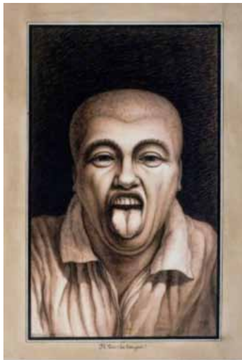
Ilustración 5. Autorretrato de Jean-Jacques Lequeu (1757-1825). En una época donde la insatisfacción exploraba en las expresiones propias.

Cuando el archigram David Green escribía sobre la Invisible University 18 , con el auge de las tecnologías, pretendía una enseñanza sin barreras, en un medio natural extendido. Hoy, el kit de supervivencia para los espejismos en el desierto de lo real está aún por hacer.