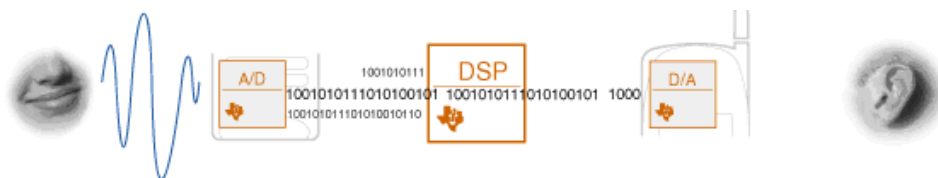
Figura 1. Ejemplo de uso de los DSPs.

Estrictamente hablando, el término DSP es aplicable a cualquier circuito integrado que trabaje con señales representadas de forma digital. En la práctica, se refiere a microprocesadores específicamente diseñados para realizar procesamiento digital de señal, para lo cual utilizan arquitecturas internas especiales que les permitan acelerar los intensos cálculos matemáticos que se les presupone van a realizar.