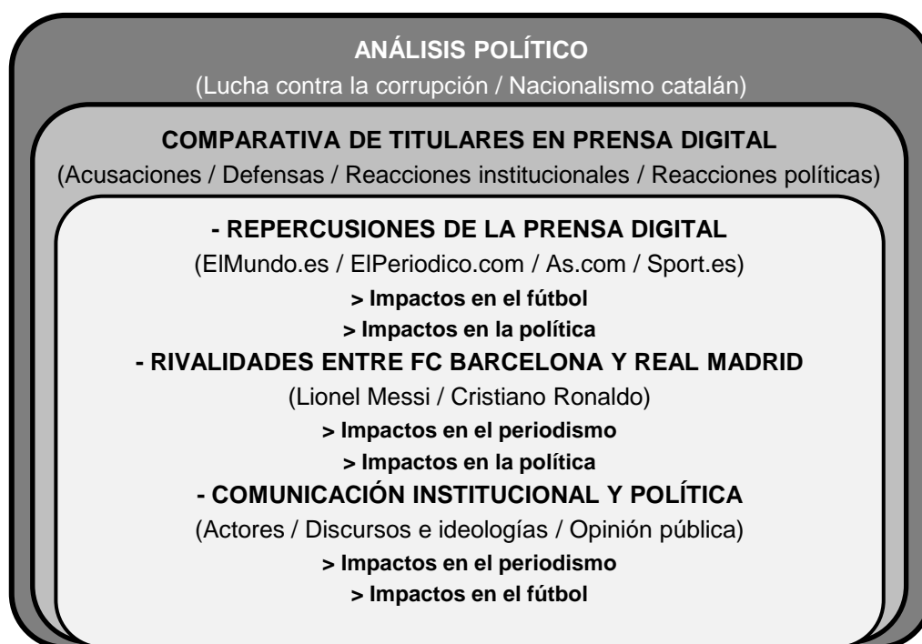
Figura 3. Procedimiento de la investigación. Elaboración propia.

En definitiva, el procedimiento de esta investigación ( Figura 3 ) se basará en determinar puntos en común entre política, periodismo y deporte. Elaboraremos un análisis político en el que nos vamos a basar en un apoyo contextual que consideramos suele formar parte del ámbito, el nacionalismo catalán y la lucha contra la corrupción. Realizaremos este estudio a través de la comparativa de titulares entre EIMundo.es, EIPeriodico.com, As.com y Sport.es que manifiesten las acusaciones sobre los casos de Messi y Ronaldo. Para completar la investigación, agregaremos titulares sobre las consecuencias de esas informaciones que reflejen las defensas que se produjeron y las reacciones desde la comunicación institucional y política. Desde los titulares de prensa digital aplicaremos las comparaciones sobre las influencias del periodismo, el periodismo en política y fútbol, las rivalidades en fútbol sobre prensa digital y política, y los impactos de la comunicación institucional y política en prensa digital y en fútbol.