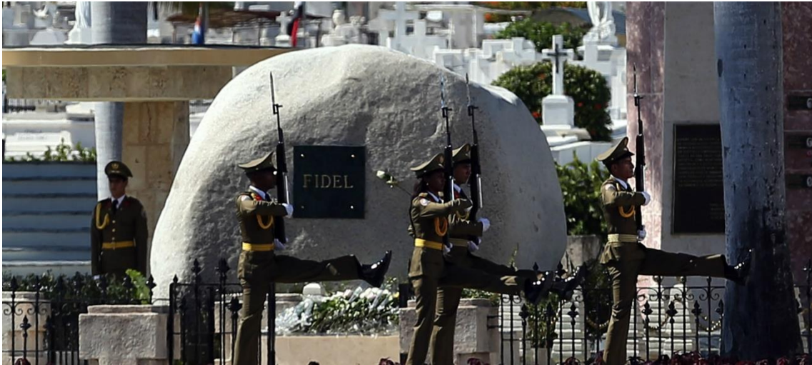
Ejército cubano desfilando tras la finalización de la ceremonia fúnebre.

Esta etiqueta tan solo fue portada por un par de militares, sin embargo, el resto del cuerpo armado llevó el uniforme de acontecimientos oficiales verde oliva. Decorado también, en este caso, con accesorios dorados. Estos además se caracterizaron por portar armas.