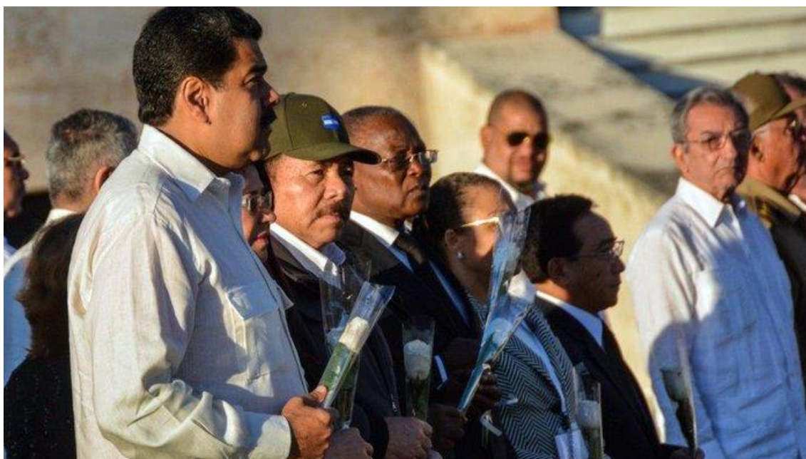
Nicolás Maduro junto a otras autoridades y personalidades en el entierro de Castro.

La ceremonia fúnebre finalmente terminó a las 07:40 horas del día 4. En ella, como ya se ha hecho mención, hicieron acto de presencia algunos Jefes de Estado de otros países. De especial importancia, fue la presencia de Nicolás Maduro, una de las autoridades de confianza para Fidel Castro y gran amigo. Lo característico de esta imagen es que todos los presentes portaban una flor blanca, la cual fue posteriormente depositada para rendir honor y respeto a Fidel. Además, la etiqueta de Maduro se caracterizó por la típica camisa que suele llevar este líder de forma habitual, aunque esta vez, de color blanco.