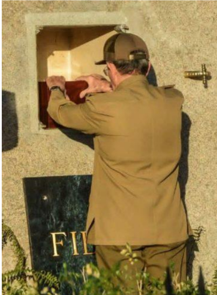
Raúl Castro da su último adiós a su hermano Fidel.