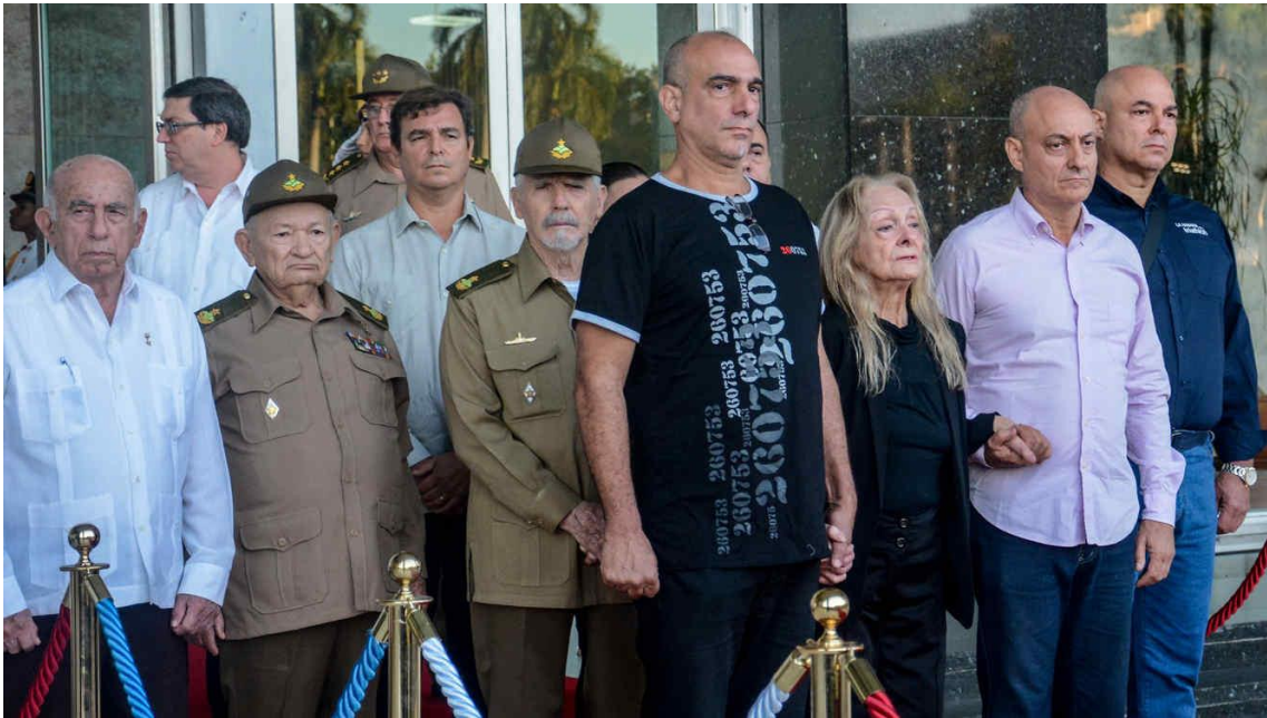
Familiares allegados a Fidel Castro, entre ellos, su esposa y alguno de sus hijos.

Así también, resulta llamativa de analizar la fotografía, para observar cual fue la etiqueta de los familiares de Castro.