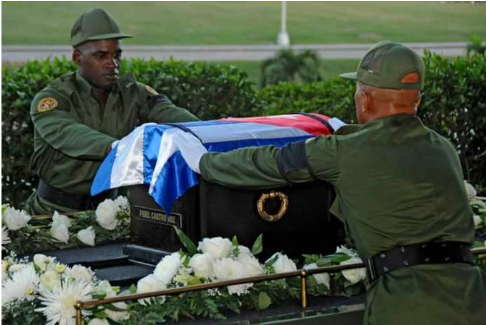
Colocación de la bandera de Cuba sobre las exequias de Fidel Castro