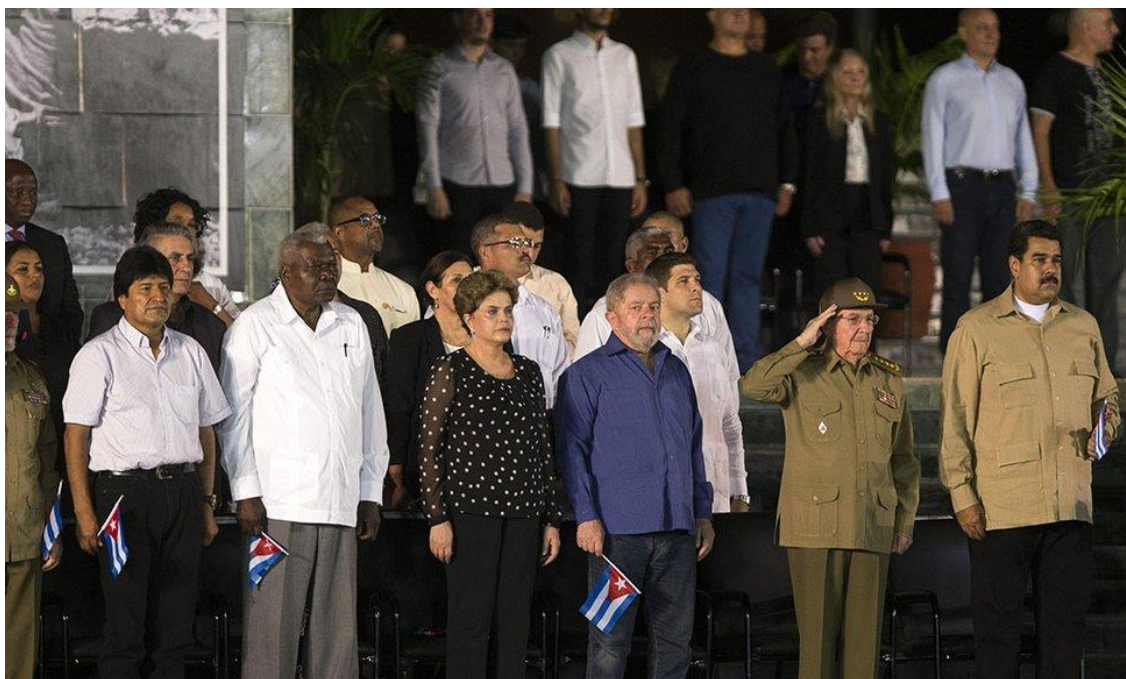
Fotografía en el acto de apertura del memorial a Fidel Castro