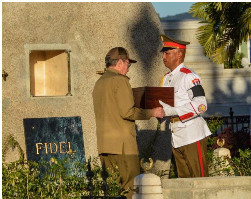
Miembro del ejército entrega las exequias de Fidel a su hermano Raúl Castro.