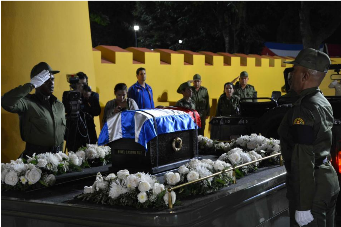
Militares rinden honores a Fidel en Bayamo.

La presencia militar también se vio representada por el coche oficial que trasladó los restos mortales de Fidel. El propio coche también mostraba el color representativo del ejército, el verde oliva. En la imagen también se puede observar la presencia del escudo cubano, así como también, un conjunto de flores blancas, las cuales son comúnmente utilizadas en los entierros en símbolo de sinceridad, fuerza, honor, recuerdos y cariño (Por siempre, 2016).