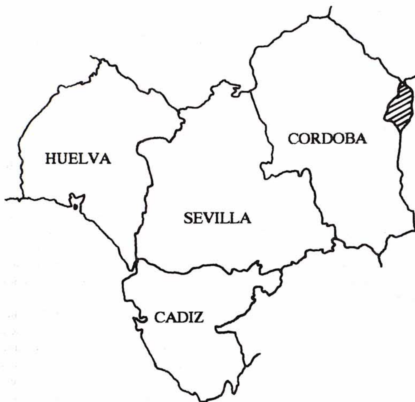
Fig. 1. Localisation de la zone étudiée dans l'Andalousie occidentale.