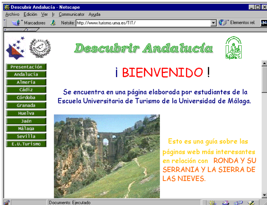
Figura 2. Página de la Serranía de Ronda en Descubrir Andalucía