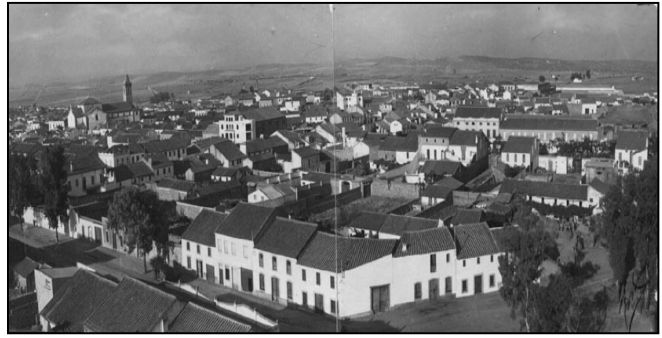
Panorámica de Pozoblanco. 1915.