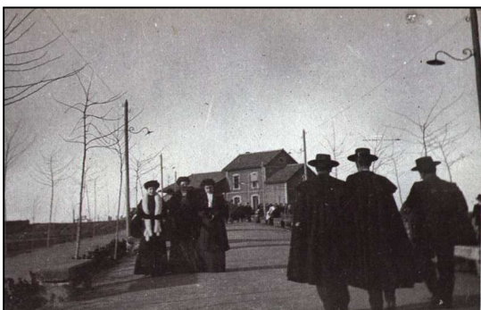
Paseo de la estación. Años 20