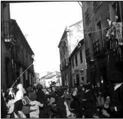
Carnavales en Pozoblanco.