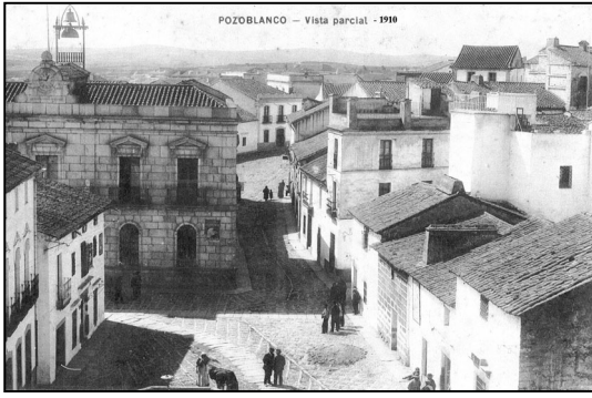
Ayuntamiento de Pozoblanco. 1910.