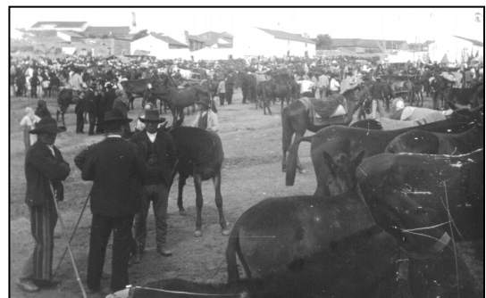
Feria de rodeo. Años 20.