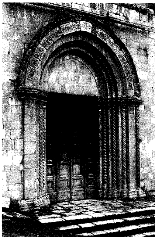
Figura 2 Cascia, S. Agostino, portal del siglo XV

daños ocasionados por el terremoto de 1703, gracias a los considerables fondos que el Papa Clemente XII destinó en 1738 para su reconstrucción, se sustituyeron las cerchas por un sistema de bóvedas de crucería que descansaba sobre unas esbeltas parástades realizadas en piedra caliza labrada.