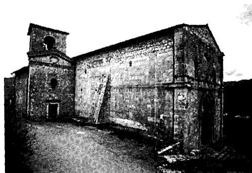
Figura 1 Cascia, S. Agostino, vista general.

La fachada, obra de los maestros comasinos, está rematada por un tímpano, y la interrumpe una cornisa marcaplanta esculpida con flores cruciformes, siguiendo el modelo de la iglesia de San Francisco, de la misma época. Se accede a la iglesia por una portada con un amplio derrame caracterizado — en sentido plástico antes que figurativo — por la presencia de tres columnitas salomónicas y helicoidales alternadas con aristas; otras dos columnas salomónicas delimi-