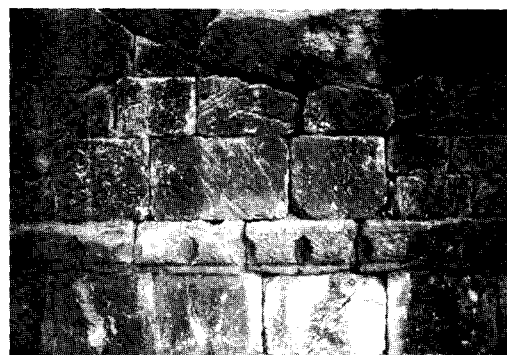
Figura 3 Cascia, S. Agostino, detalle del muro

Las características mecánicas del aparejo, en particular la capacidad de responder con su capacidad estabilizadora a los esfuerzos horizontales provocados por la acción sísmica (la causa principal de las lesiones que se observan), al permitir posibles oscilaciones de escasa entidad, pero manteniendo a la vez la necesaria integridad del espesor, dependen de la forma en que está hecha la pared y del estado de conservación intrínseco de la misma. Por consiguiente, el juicio acerca del comportamiento mecánico de una pared coincide con el juicio expresado acerca de la calidad de su realización y de los resultados de los estudios realizados (figura 3).