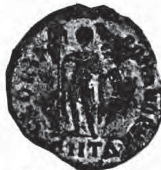
Monedas halladas en «Las Bóvedas» (Marbella)