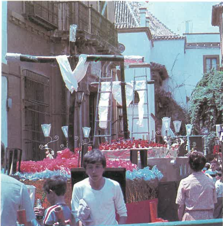
Por regla general, los pasos tradicionales y pasos de mayo no llevan imágenes, solamente una cruz.

Se utilizan todos los medios al alcance de los organizadores, desde verdaderas obras de arte realizadas por artesanos adultos y expertos y con la colaboración de hermandades (Los Venerables, El Baratillo, etc), hasta ingenuos pasitos realizados con cajas y con pobres medios,