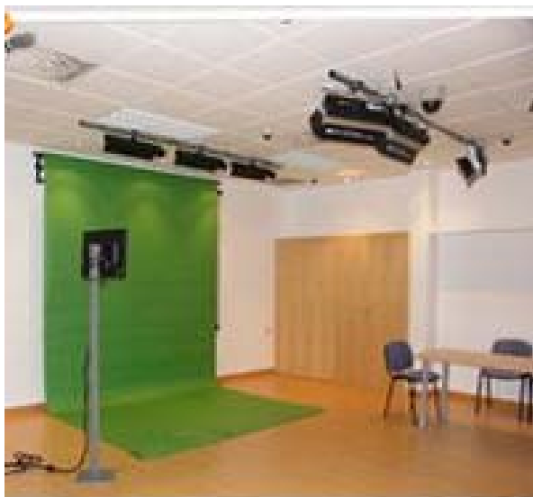
Ejemplo sala Polimedia de la UHU

A través de la aplicación Polimedia, se consigue la producción de contenidos formativos de alta calidad enfocados principalmente hacia la teleformación y el trabajo individualizado, que pueden ser almacenados en distintos soportes de distribución: cd-rom, dvd-rom, lápices de memoria usb, internet, ipod, etc.