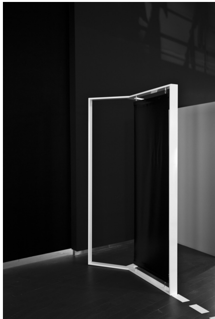
Fig. 2. marina_morón [fotografía] (Jesús Marina + Elena Morón). Stave XII