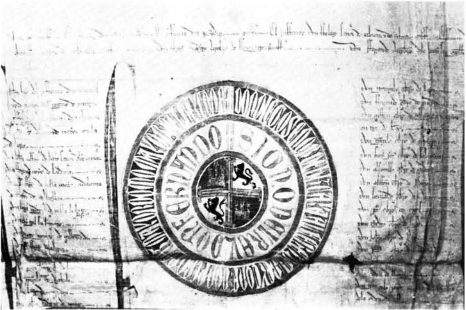
Crismón y rueda del privilegio de confirmación dado por Fernando IV (doc. núm. 1).