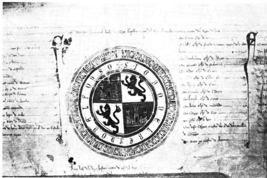
Crismón y rueda del privilegio de confirmación dado por Alfonso XI (doc. núm. 2).